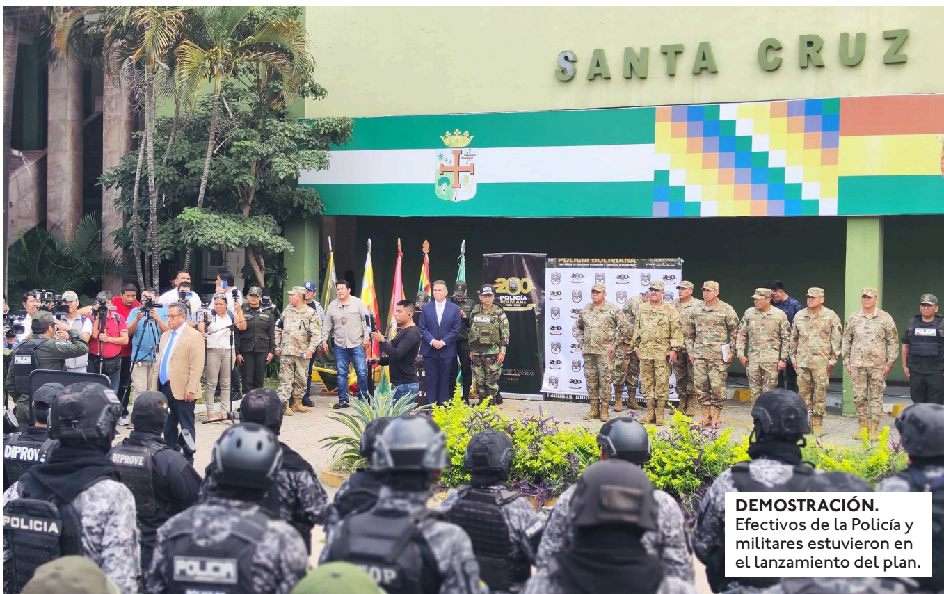
DEMOSTRACIÓN. Efectivos de la Policía y militares estuvieron en el lanzamiento del plan.

DELEGADOS DE BOLIVIA Y BRASIL SUBRAYARON LA NECESIDAD DE REFORZAR LA LUCHA CONTRA EL NARCOTRÁFICO, EN UN EVENTO REALIZADO EN SANTA CRUZ.