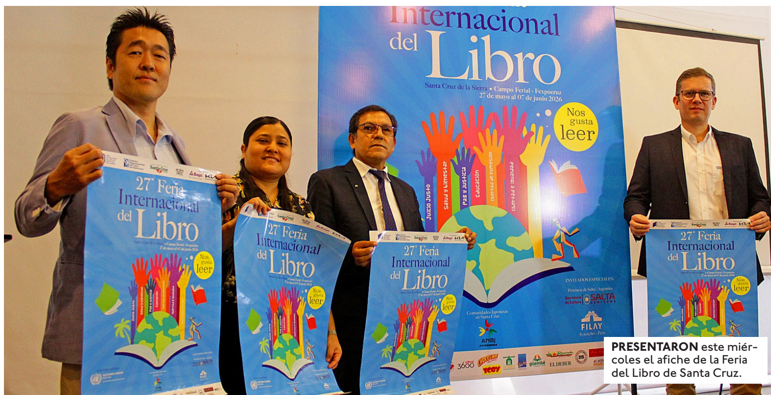
PRESENTARON este miércoles el afiche de la Feria del Libro de Santa Cruz.