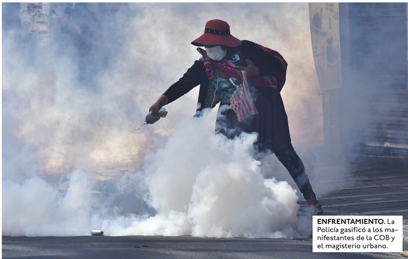
ENFRENTAMIENTO. La Policía gasificó a los manifestantes de la COB y el magisterio urbano.

CAMPESINOS DE LA PAZ BLOQUEABAN AYER LA CARRETERA A DESAGUADERO EN APOYO AL PARO DECRETADO POR LA COB EL VIERNES.