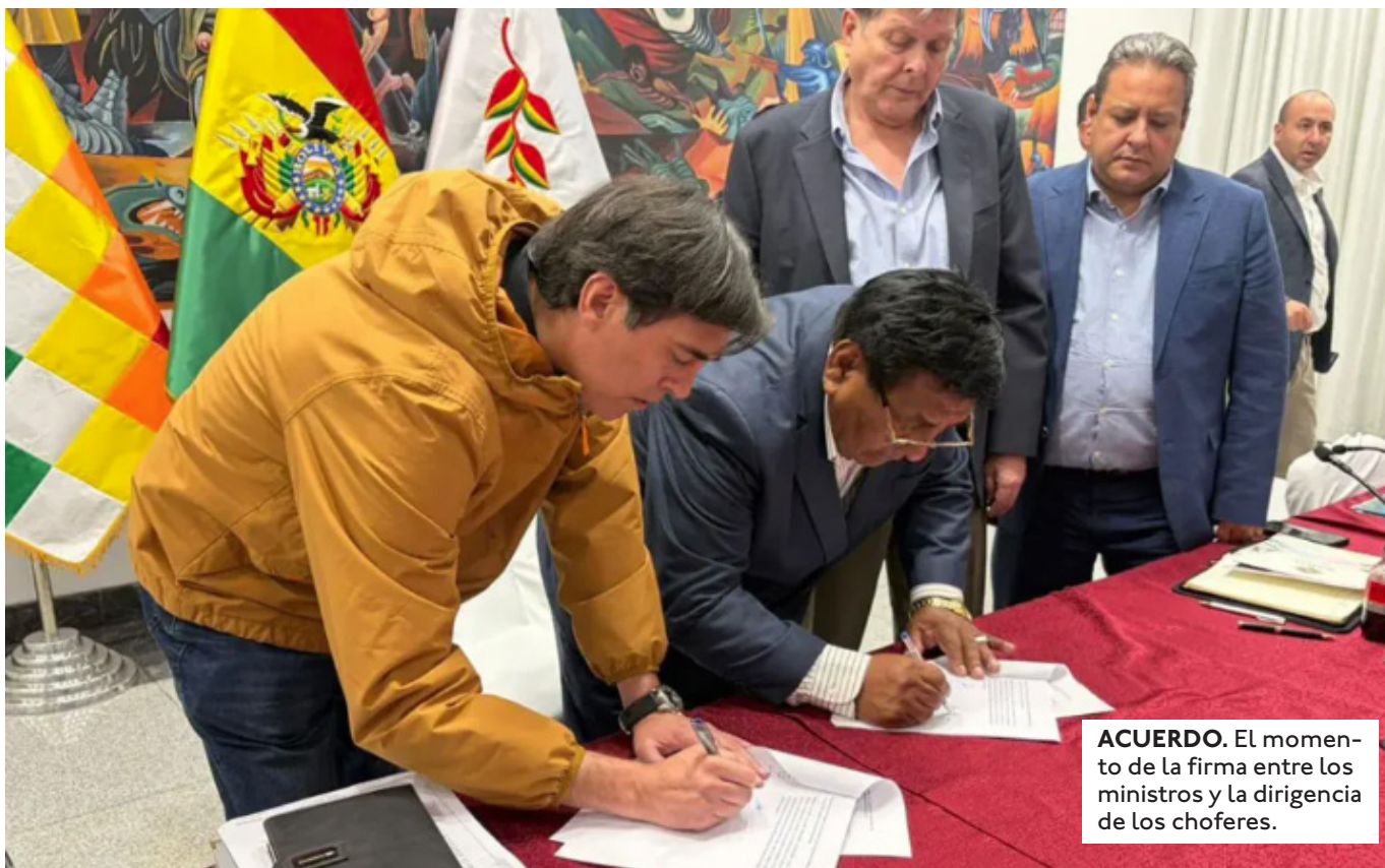
ACUERDO. El momento de la firma entre los ministros y la dirigencia de los choferes.