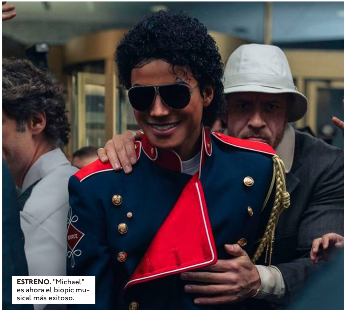
ESTRENO. "Michael" es ahora el biopic musical más exitoso.

Un fenómeno cultural imparable. La película no solo ha triunfado en la venta de entradas, sino que ha provocado un efecto dominó en las plataformas de streaming, donde el catálogo musical de Michael Jackson ha experimentado un aumento del 300% en reproducciones durante los últimos tres días. La estrategia de los productores de mantener un equilibrio entre la genialidad musical del artista y sus momentos más humanos ha resonado profundamente en el público, generando una recomendación "boca a