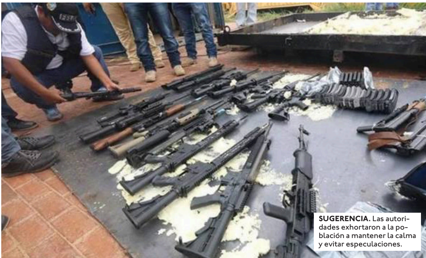
SUGERENCIA. Las autoridades exhortaron a la población a mantener la calma y evitar especulaciones.

LA ARMADA INFORMÓ QUE YA HAY PERSONAS APREHENDIDAS Y SE MENCIONÓ LA EXISTENCIA DE INDICIOS SOBRE LA POSIBLE PARTICIPACIÓN DE CIUDADANOS EXTRANJEROS.