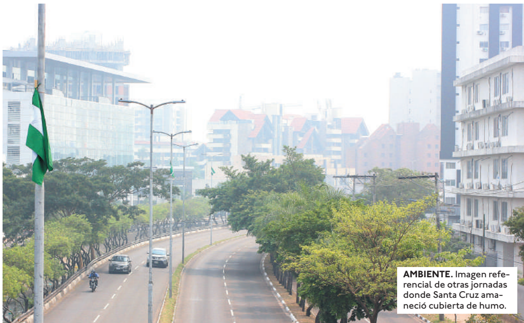
AMBIENTE. Imagen referencial de otras jornadas donde Santa Cruz amaneció cubierta de humo.

SE LOGRÓ TRAS VARIOS DÍAS DE INTENSO TRABAJO CON EL AVIÓN CISTERNA Y EL HELICÓPTERO CON BAMBIBUCKET, BOMBEROS Y VOLUNTARIOS.