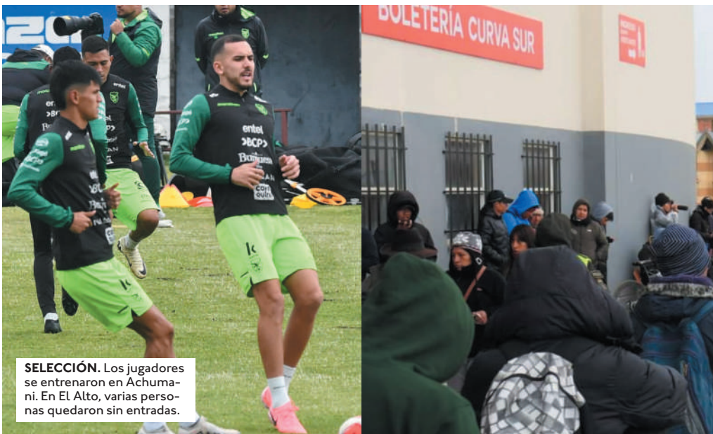
SELECCIÓN. Los jugadores se entrenaron en Achumani. En El Alto, varias personas quedaron sin entradas.

LA ALCALDÍA DE EL ALTO EN COORDINACIÓN CON LA FBF INICIÓ EL CAMBIO DE LAS POLÉMICAS BUTACAS DE "ASIENTO DE PLASTOFOR" QUE SE DETERIORARON TRAS EL COMPROMISO ANTE VENEZUELA.