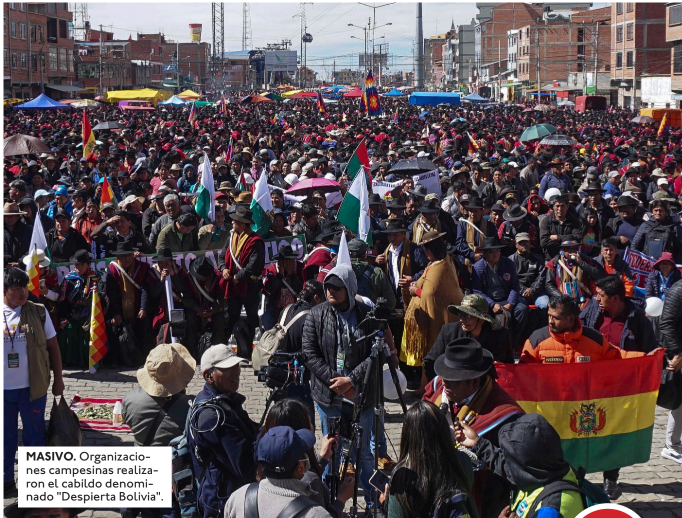
MASIVO. Organizaciones campesinas realizaron el cabildo denominado "Despierta Bolivia".