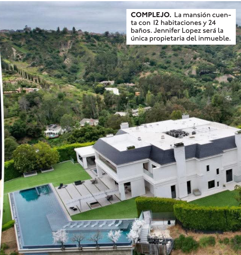
COMPLEJO. La mansión cuenta con 12 habitaciones y 24 baños. Jennifer Lopez será la única propietaria del inmueble.