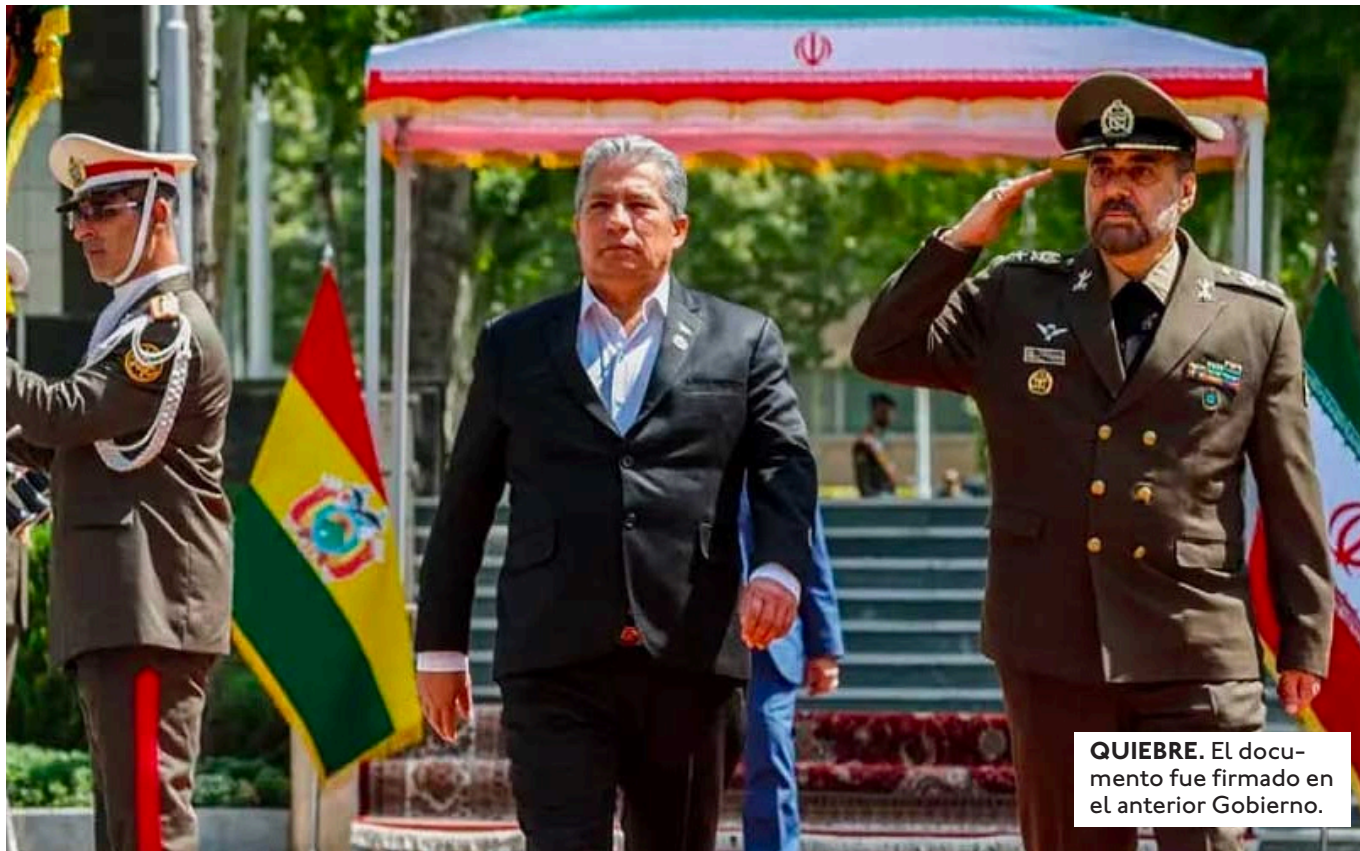
QUIEBRE. El documento fue firmado en el anterior Gobierno.

PROTAGONIZARON UNA MARCHA DE PROTESTA TRAS DENUNCIAR GRAVES PROBLEMAS OPERATIVOS DERIVADOS DEL SUMINISTRO DE GASOLINA DE MALA CALIDAD.