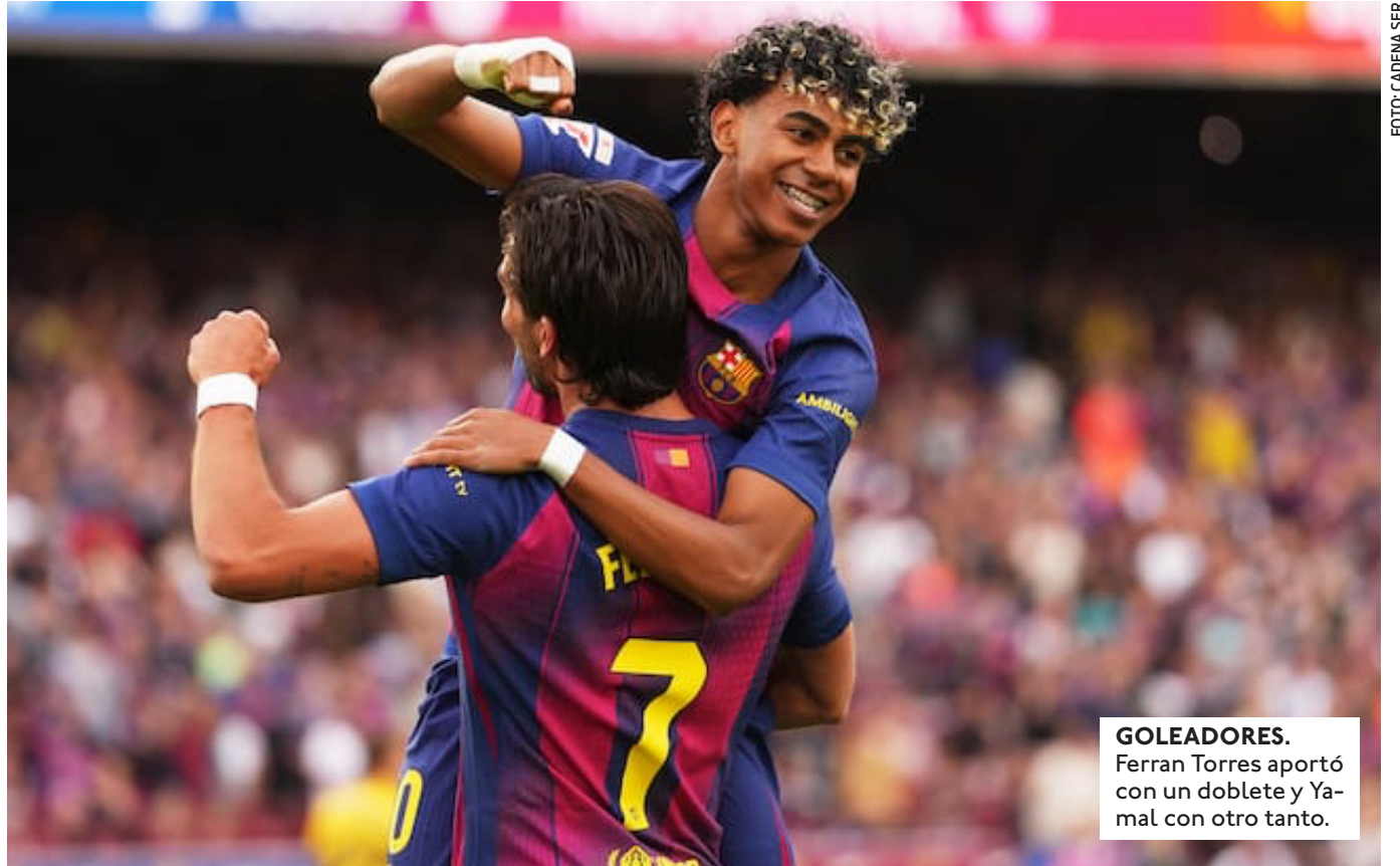
GOLEADORES. Ferran Torres aportó con un doblete y Yamal con otro tanto.

EL 21 DE ABRIL, EL REAL MADRID SERÁ LOCAL ANTE EL ALAVES. MIENTRAS QUE EL BARCELONA, AL SIGUIENTE DÍA RECIBIRÁ AL CELTA DE VIGO.