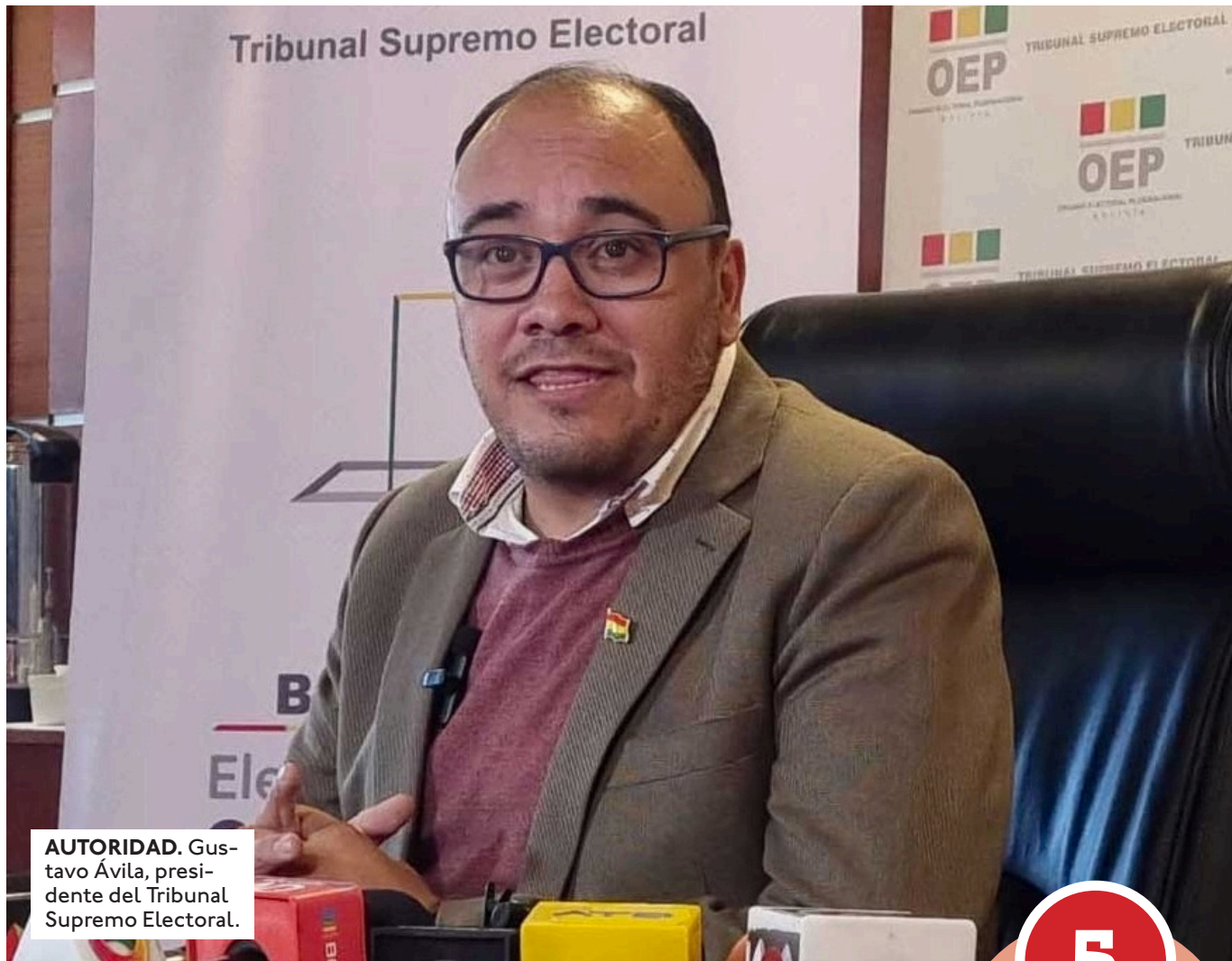
AUTORIDAD. Gustavo Ávila, presidente del Tribunal Supremo Electoral.

En alerta. En paralelo, el TSE se declaró en estado de alerta tras una determinación judicial que ordena suspender la difusión de una encuesta de intención de voto en Santa Cruz, una medida que la institución considera preocupante por su impacto en el proceso