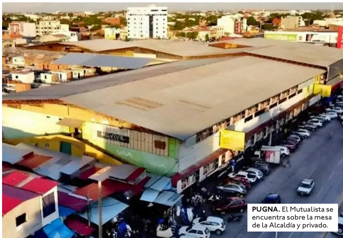
PUGNA. El Mutualista se encuentra sobre la mesa de la Alcaldía y privado.