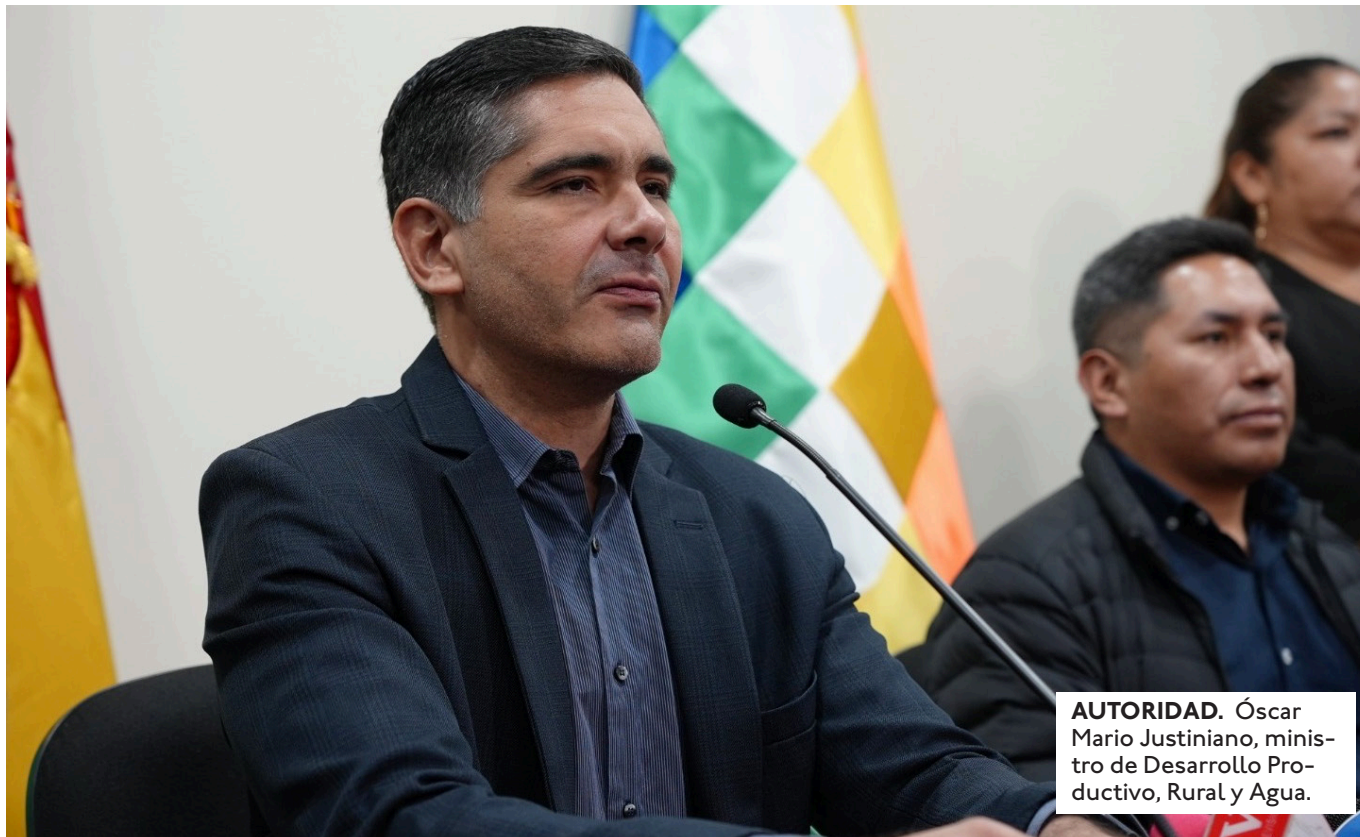
AUTORIDAD. Óscar Mario Justiniano, ministro de Desarrollo Productivo, Rural y Agua.

AUTORIZA AL INSTITUTO NACIONAL DE REFORMA AGRARIA (INRA) CONVERTIR LA PEQUEÑA PROPIEDAD TITULADA EN MEDIANA.