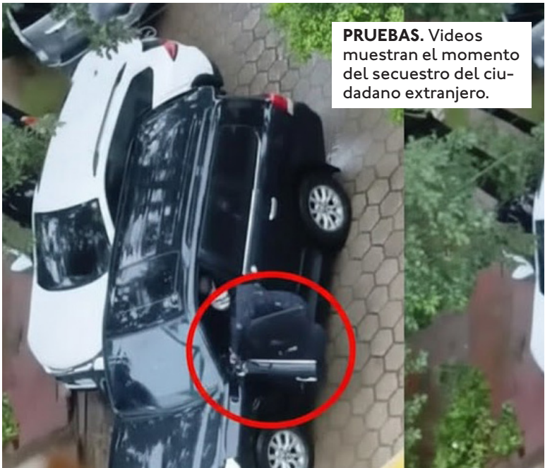
PRUEBAS. Videos muestran el momento del secuestro del ciudadano extranjero.

6 relojes de alta gama y 10 mil dólares fueron sustraídos de condominio.