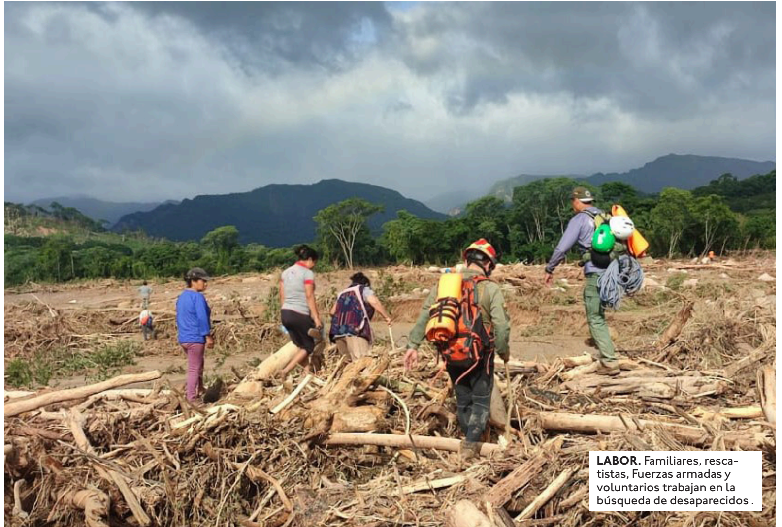
LABOR. Familiares, rescatistas, Fuerzas armadas y voluntarios trabajan en la búsqueda de desaparecidos.

sonas de 10 comunidades del municipio de El Torno fueron evacuadas hasta el mediodía de este lunes por rescatistas de la Gobernación, brigadistas voluntarios y efectivos de las Fuerzas Armadas. Las labores continuaron durante la tarde, con el objetivo de sacar a más familias afectadas por la crecida de las aguas. El operativo es ejecutado por la Unidad de Rescate de la Gobernación, en coordinación con brigadas especializadas como Cross, UUBR, K-9, GIRVAC, Feroz, SAR-Bolivia,