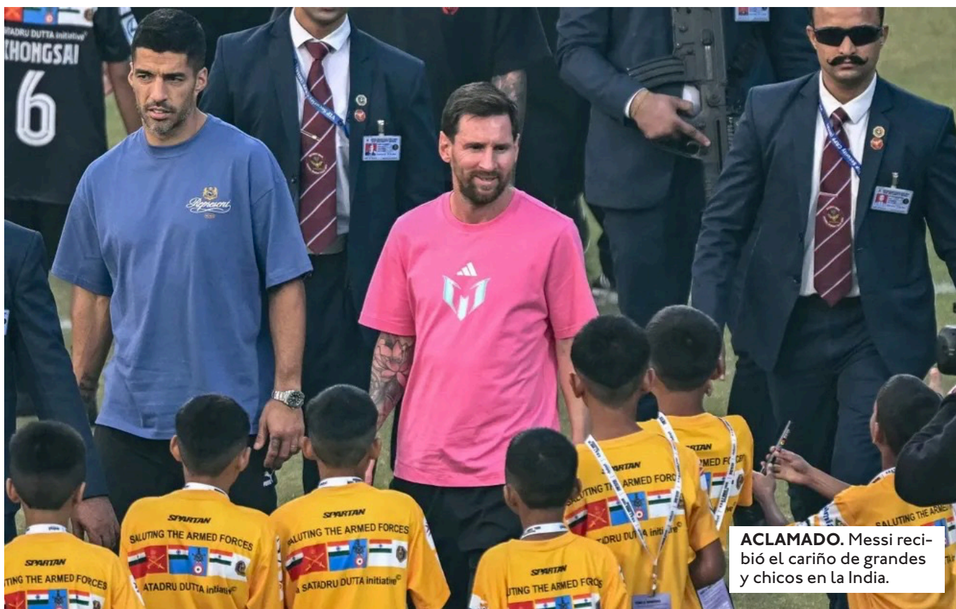
ACLAMADO. Messi recibió el cariño de grandes y chicos en la India.

SERGIO REGUILÓN ES NUEVO JUGADOR DE INTER DE MIAMI, CLUB QUE RECIENTEMENTE CONQUISTÓ SU PRIMERA MLS CUP. LLEGUE EN LUGAR DE JORDI ALBA.