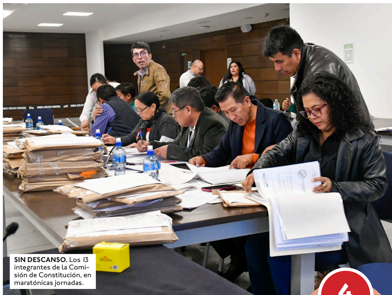
SIN DESCANSO. Los 13 integrantes de la Comisión de Constitución, en maratónicas jornadas.

Las etapas que restan. Los aspirantes que no estén de acuerdo con la calificación obtenida podrían un recurso de revisión este lunes, que será resuelto hoy. Con esta fase, faltan tres para concluir el proceso: resolución del recurso de revisión de méritos (1 día), notificación de la resolución del recurso de revisión de méritos (1 día) y aprobación del informe de evaluación y remisión de la lista final a la Asamblea Legislativa Plurinacional (1 día). Entonces el vicepresidente Edmand Lara debe convocar a sesión del pleno de la ALP para elegir a