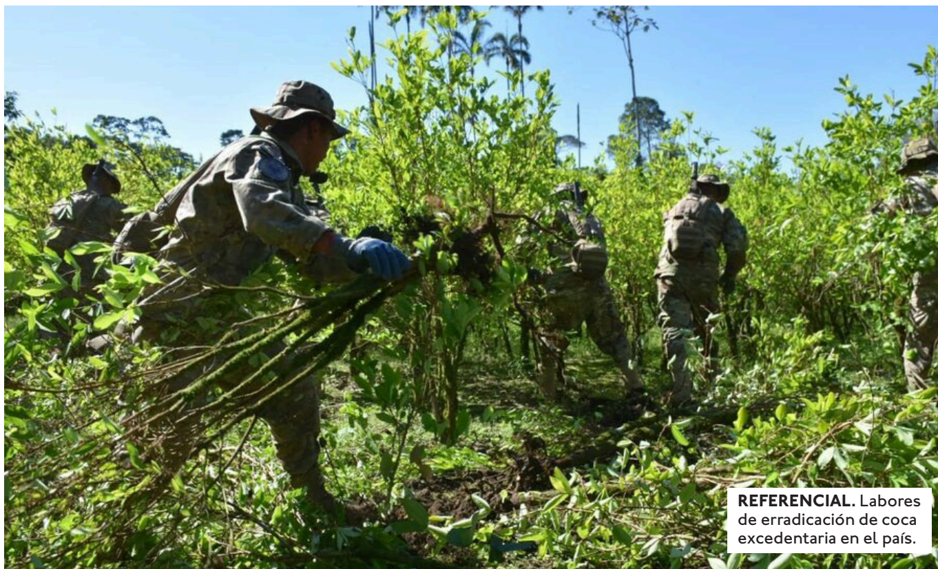
REFERENCIAL. Labores de erradicación de coca excedentaria en el país.

EL GOBIERNO DE BOLIVIA REPORTÓ LA ERRADICACIÓN DE 10.001 HECTÁREAS, DE LAS CUALES UNO-DC VALIDÓ EL 23% A TRAVÉS DE ACOMPAÑAMIENTO EN CAMPO Y ANÁLISIS DE INFORMACIÓN.