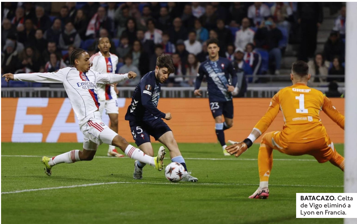
BATACAZO. Celta de Vigo eliminó a Lyon en Francia.

DESPUÉS DE CAER 1-0 ANTE PANATHINAIKOS EN LA IDA, EL CUADRO ESPAÑOL APROVECHÓ DE LOCAL Y GOLEÓ 4-0 PARA METERSE A CUARTOS.