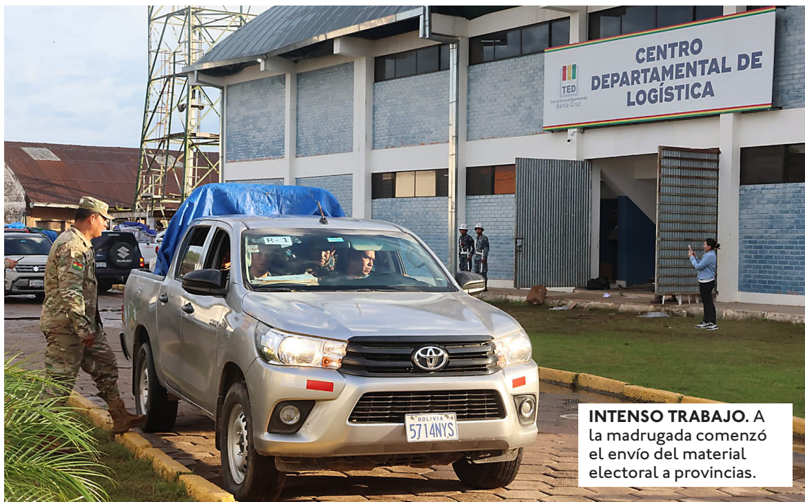
INTENSO TRABAJO. A la madrugada comenzó el envío del material electoral a provincias.