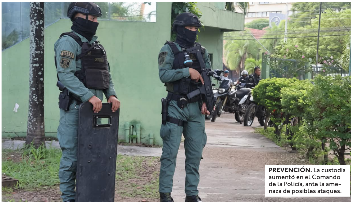
PREVENCIÓN. La custodia aumentó en el Comando de la Policía, ante la amenaza de posibles ataques.

SIGUE LA INVESTIGACIÓN DEL CASO MARSET. ESTE JUEVES, LA POLICÍA ALLANÓ UNA PISTA CLANDESTINA EN LA ZONA DE PORTACHUELO.