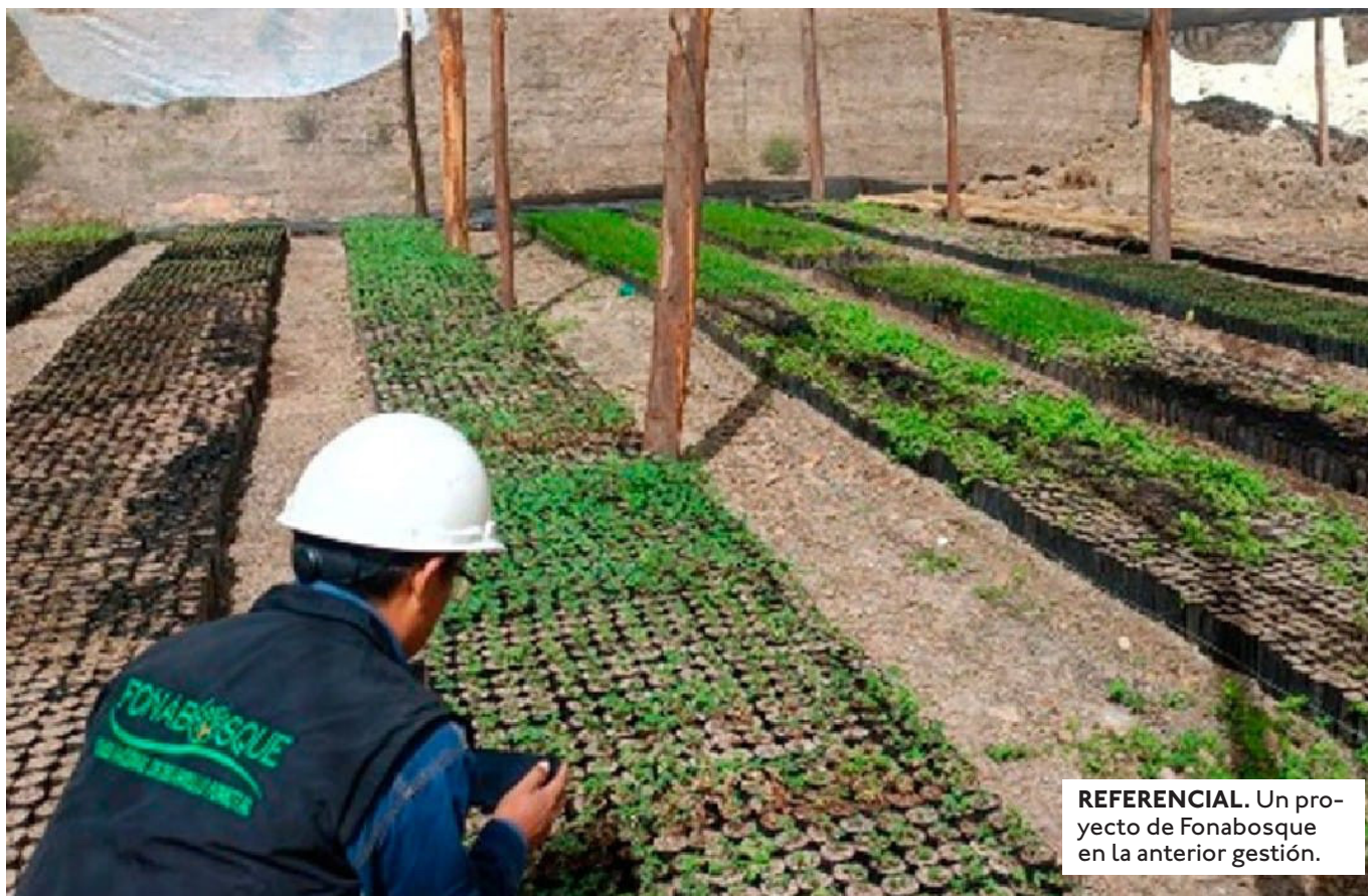
REFERENCIAL. Un proyecto de Fonabosque en la anterior gestión.

COLANZI SEÑALÓ QUE HAY MECANISMOS PARA RECOBRAR EL DINERO MALVERSADO. EL PRIMER PASO ES ENVIAR UN INFORME AL VIMINISTERIO DE MEDIO AMBIENTE PARA ACTIVAR LOS RECURSOS LEGALES.