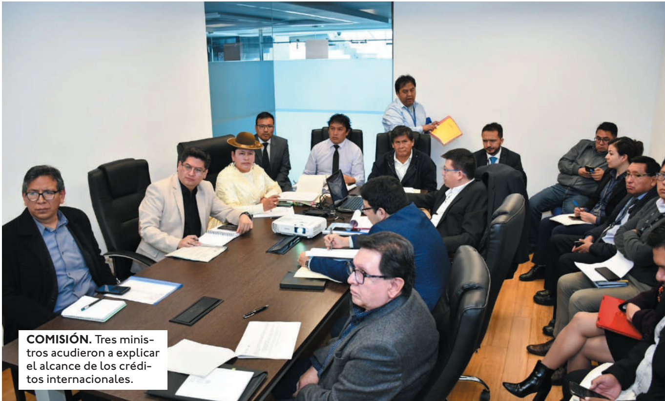
COMISIÓN. Tres ministros acudieron a explicar el alcance de los créditos internacionales.

EN PASADOS DÍAS, EL EX-PRESIDENTE INSTÓ A LA ASAMBLEA LEGISLATIVA APROBAR LOS CRÉDITOS INTERNACIONALES QUE SE ENCUENTRAN PENDIENTES.