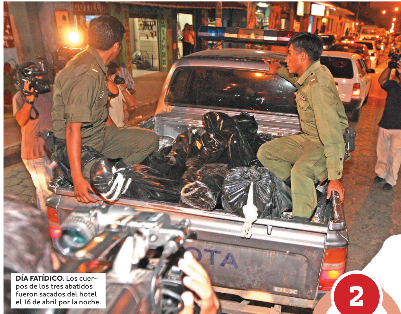
DÍA FATÍDICO. Los cuerpos de los tres abatidos fueron sacados del hotel el 16 de abril por la noche.

Presión contra Morales. "Todos los ciudadanos bolivianos, absolutamente todos, tienen la obligación de acudir al llamado de la Justicia cuando son solicitados", dijo el ministro de Justicia, Iván Lima en referencia a las declaraciones hechas por Evo Morales, quien el domingo anticipó que no se presentará a declarar y que