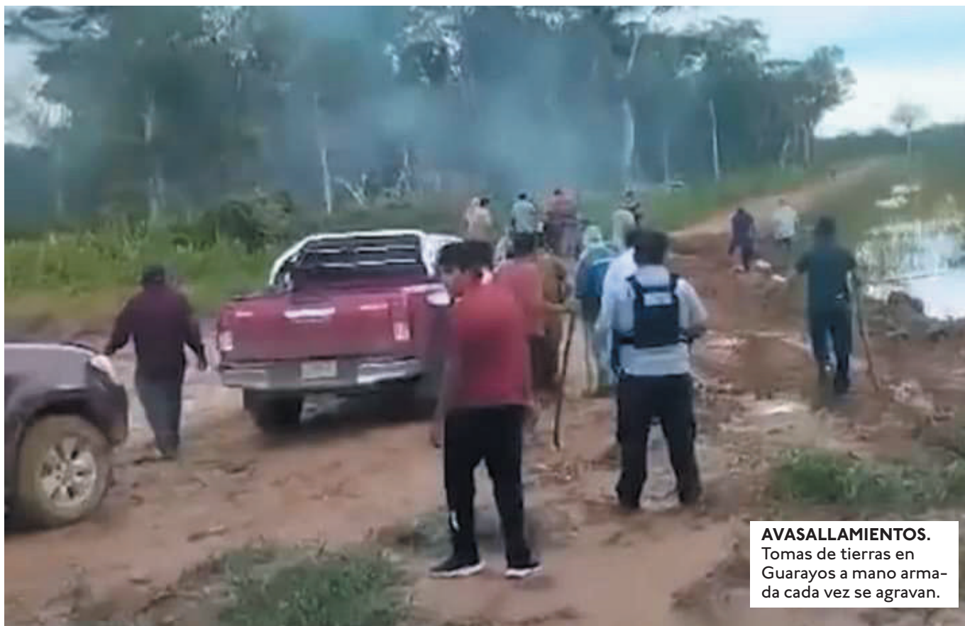
AVASALLAMIENTOS. Tomas de tierras en Guarayos a mano armada cada vez se agravan.