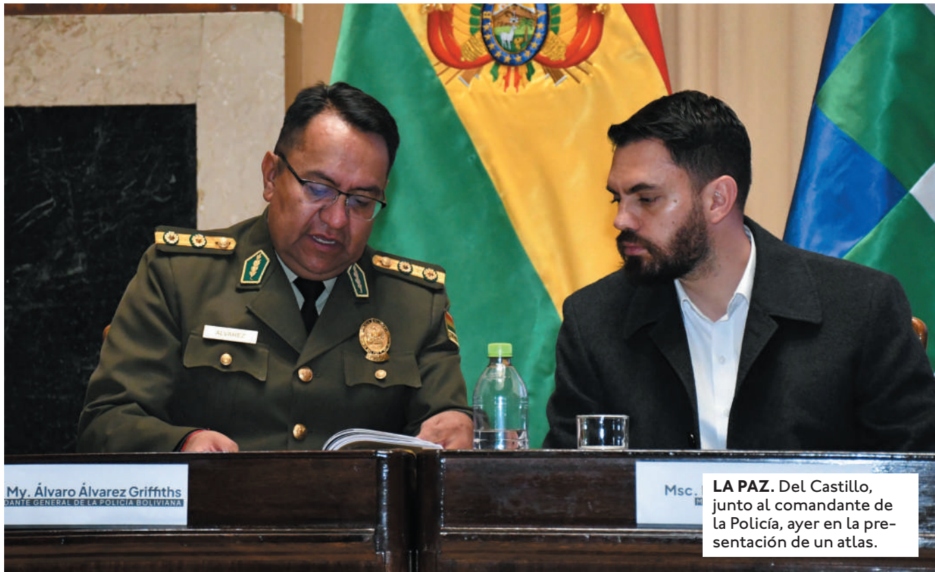
LA PAZ. Del Castillo, junto al comandante de la Policía, ayer en la presentación de un atlas.

EN ENERO PASADO, EL MINISTRO EDUARDO DEL CASTILLO ANUNCIÓ LA INCORPORACIÓN DE 1.832 POLICÍAS, 276 DE ELLOS PARA SANTA CRUZ.