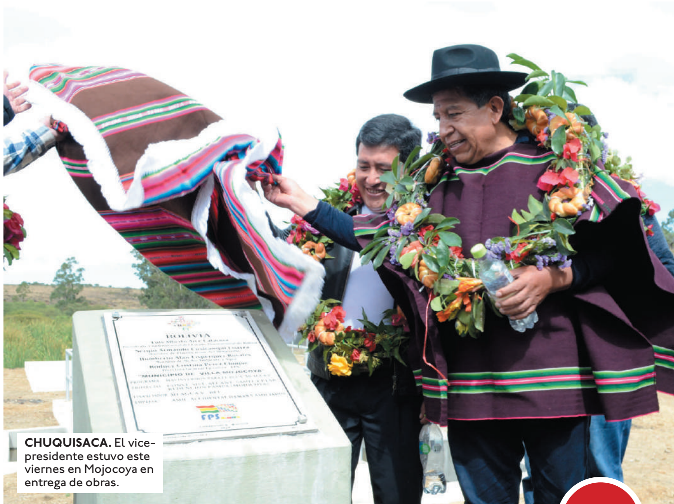
CHUQUISACA. El vicepresidente estuvo este viernes en Mojocoya en entrega de obras.