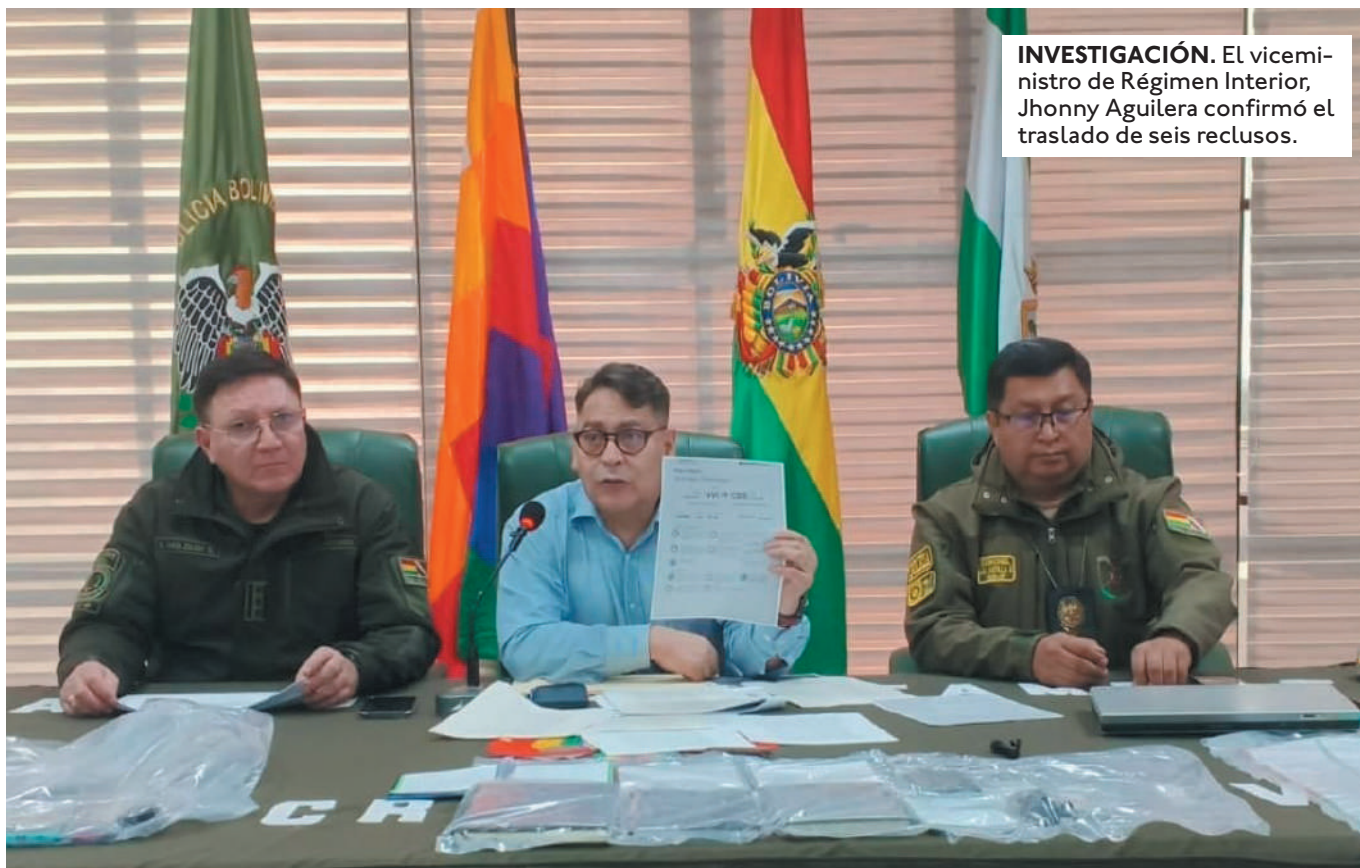
INVESTIGACIÓN. El viceministro de Régimen Interior, Jhonny Aguilera confirmó el traslado de seis reclusos.

UN PRODUCTOR SE SUMÓ A LAS VÍCTIMAS DE ESTAFA LE SACARON $US 45 MIL PERO NO LE ENTREGARON LAS 100 TONELADAS DE SOYA.