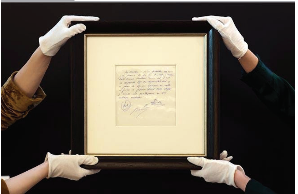
LA SERVILLETA con el primer contrato de Leo Messi por el Barcelona ha sido subastada por la casa Bonhams por un precio de 762.000 libras (890.000 euros).