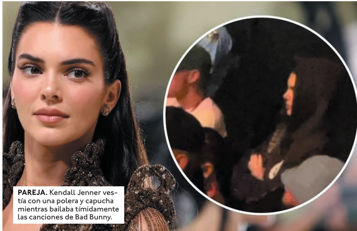
PAREJA. Kendall Jenner vestía con una polera y capucha mientras bailaba tímidamente las canciones de Bad Bunny.

El romance entre Kendall Jenner y Bad Bunny comenzó de manera fulgurante tras ser presentados por