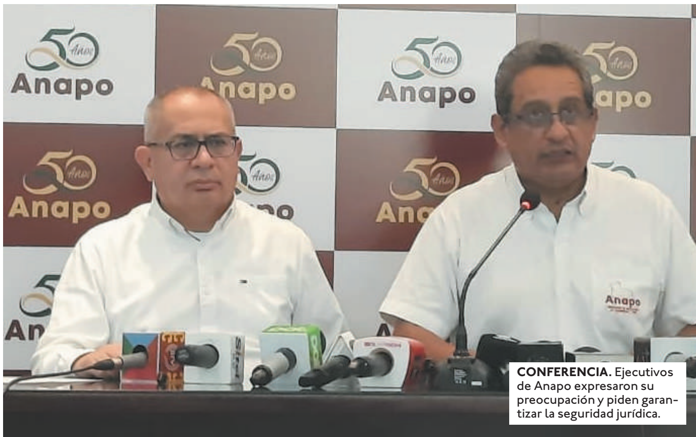
CONFERENCIA. Ejecutivos de Anapo expresaron su preocupación y piden garantizar la seguridad jurídica.

EL GERENTE DE ANAPO INFORMÓ QUE LOS AVASALLADORES ESTÁN BUSCANDO TOMAR MÁS TIERRAS EN EL NORTE INTEGRADO.