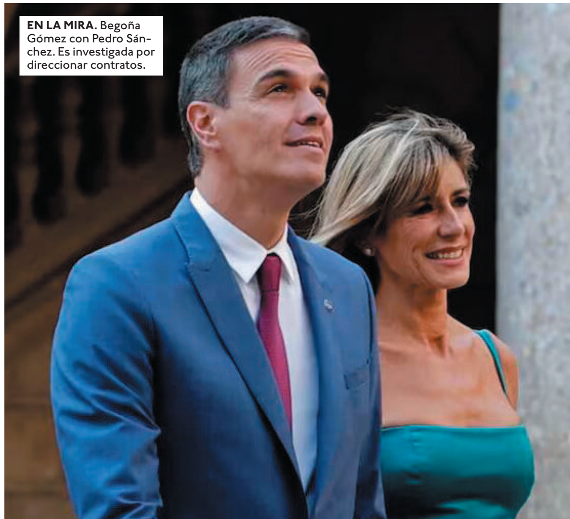
EN LA MIRA. Begoña Gómez con Pedro Sánchez. Es investigada por direccionar contratos.

EL MINISTRO de Exteriores anuncia que España retira "definitivamente" a su embajadora en Argentina, a la que ya había llamado a consultas.