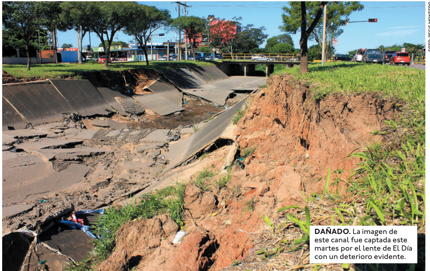
DAÑADO. La imagen de este canal fue captada este martes por el lente de EL DÍA con un deterioro evidente.

UNA EMPRESA ESPECIALIZADA REALIZA EL TRABAJO PARA IDENTIFICAR ZONAS MÁS AFECTADAS POR EL AGUA EN LA CAPITAL CRUCEÑA.