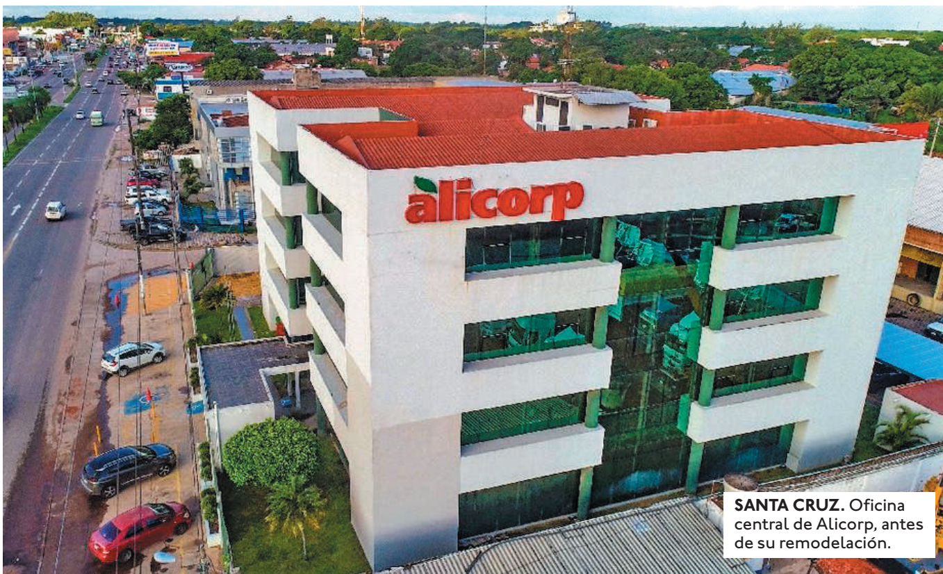
SANTA CRUZ. Oficina central de Alicorp, antes de su remodelación.

"A LA FECHA DE LA PRESENTE COMUNICACIÓN, NO HAY NINGUNA CERTEZA DE QUE LA POTENCIAL TRANSACCIÓN SE CONCRETE", SEÑALÓ ALICORP.