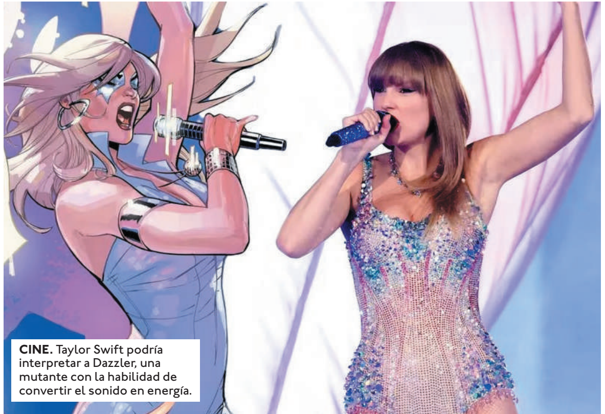
CINE. Taylor Swift podría interpretar a Dazzler, una mutante con la habilidad de convertir el sonido en energía.

Dazzler es un personaje popular entre los fanáticos de los X-Men, y la intérprete de "Shake It Off", de 34 años, encajaría perfectamente ya que incluso portan un look muy parecido. Además, su llegada a Marvel coincidiría con la reciente incorporación de los mutantes a la franquicia, lo que abre un sinfín de posibilidades para nuevas historias. Por el momento, no hay confirmación oficial por parte de ninguna de las partes. No obstante, cabe mencionar que anteriormente, se dijo que este mismo rol de Swift se incluiría en el próximo largometraje Deadpool & Wolverine. En una reciente entrevista con Screen Rant, Ryan Reynolds admitió que está al tanto de las especulaciones en relación a Swift, quien es una de sus amigas cercanas. Él bromeó al mencionar que "cualquier cosa" es posible en el mundo de superhéroes. "Ya sabes, en filmes como este hay mucho rumores de las personas que podrían aparecer. Vi a uno que esta-