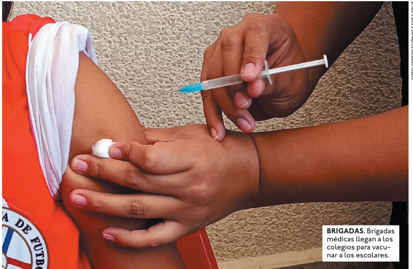
BRIGADAS. Brigadas médicas llegan a los colegios para vacunar a los escolares.

LA CAMPAÑA DE VACUNACIÓN EN LOS COLEGIOS INICIÓ EL 23 DE ABRIL Y FINALIZARÁ EL 31 DE MAYO, SE PRETENDE VACUNAR A MÁS DE 350 MIL NIÑOS.