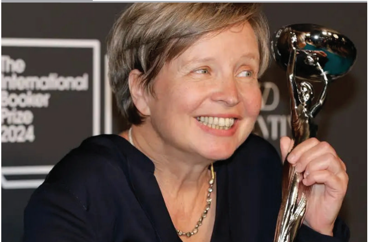
LA NOVELA 'Kairós', de la escritora alemana Jenny Erpenbeck, ha ganado el prestigioso premio literario Booker Internacional 2024.