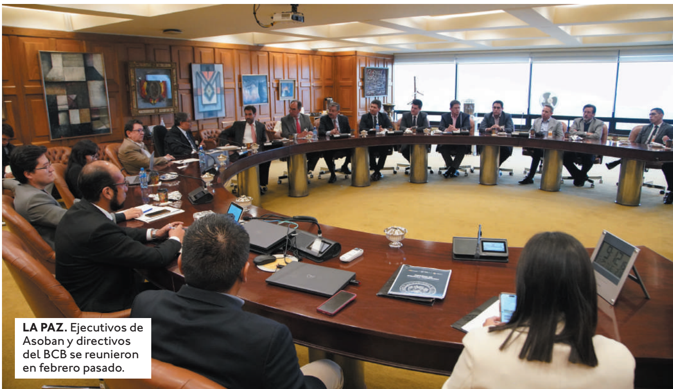
LA PAZ. Ejecutivos de Asoban y directivos del BCB se reunieron en febrero pasado.

EL MINISTRO DE ECONOMÍA ADVIRTIÓ AL SECTOR CON DRÁSTICAS SANCIONES SI NO ENTREGAN DE MANERA PROLIJA Y OPORTUNA LOS DÓLARES.