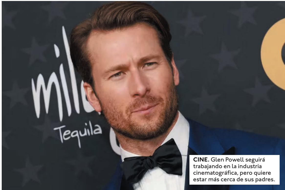
CINE. Glen Powell seguirá trabajando en la industria cinematográfica, pero quiere estar más cerca de sus padres.

“Él me dijo: ‘Cuando regreso a Austin, todo allá es real. Ahí están mis amigos y mi familia, mis acciones importan allí’”, recordó Powell sobre una conversación con el protagonista de Interestelar. La familia fue otro factor fundamental. Powell sintió la necesidad de estar más cerca de sus padres para cuidarlos en su vejez, y también para poder cuidar a sus sobrinos. “Quiero estar presente a medida que mis padres envejecen y mis sobrinos crecen”, dijo Powell, quien ha comprado una casa a solo 30 minutos de sus progenitores. Un tercer factor tiene que ver con su educación universitaria. “Es algo más emocional para mí, y muy importante para mi mamá”, indicó sobre la perspectiva de graduarse pronto de la Universidad de Texas. Solo le falta completar