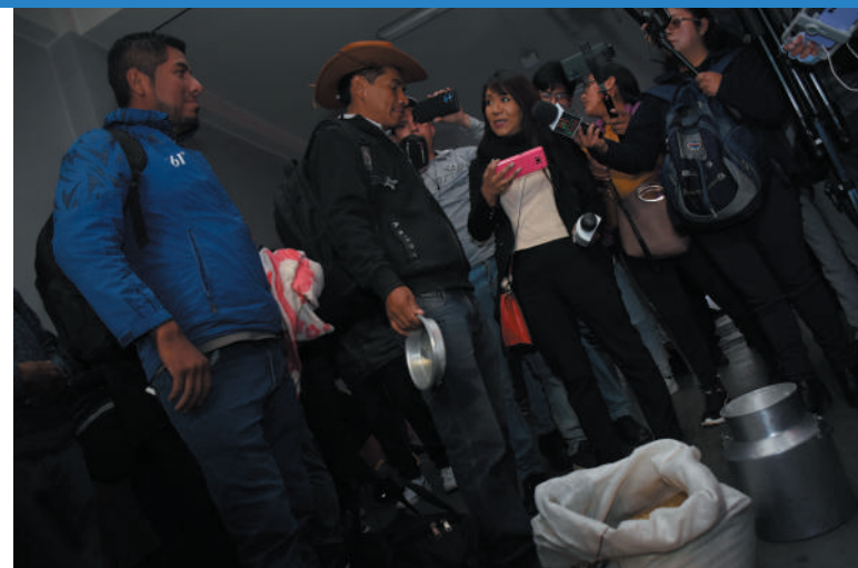
PREOCUPACIÓN. Dirigentes lecheros pidieron ajuste en el precio.