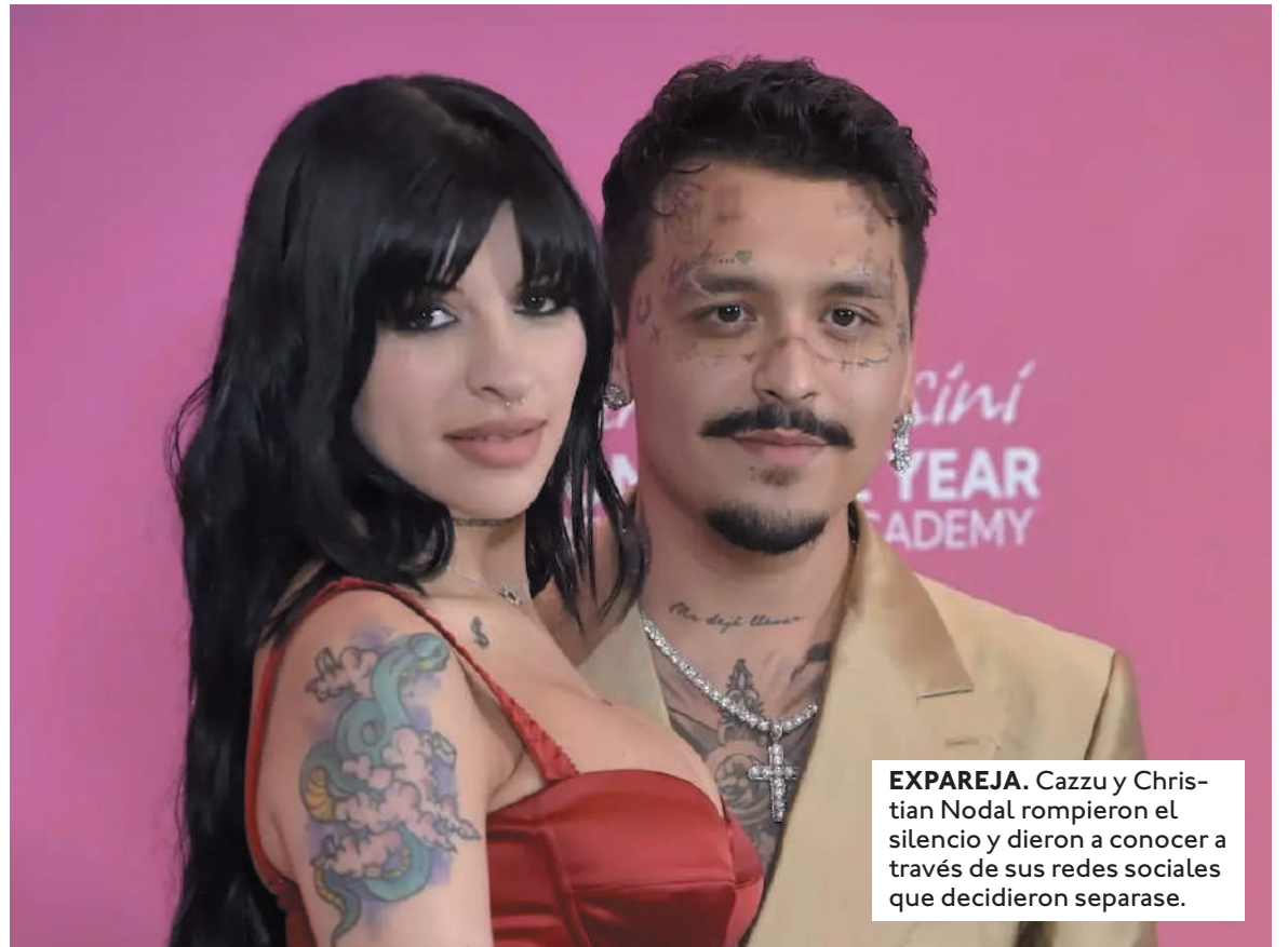
EXPAREJA. Cazzu y Christian Nodal rompieron el silencio y dieron a conocer a través de sus redes sociales que decidieron separarse.

¿Cómo conquistó Christian Nodal a Cazzu? La nueva canción de