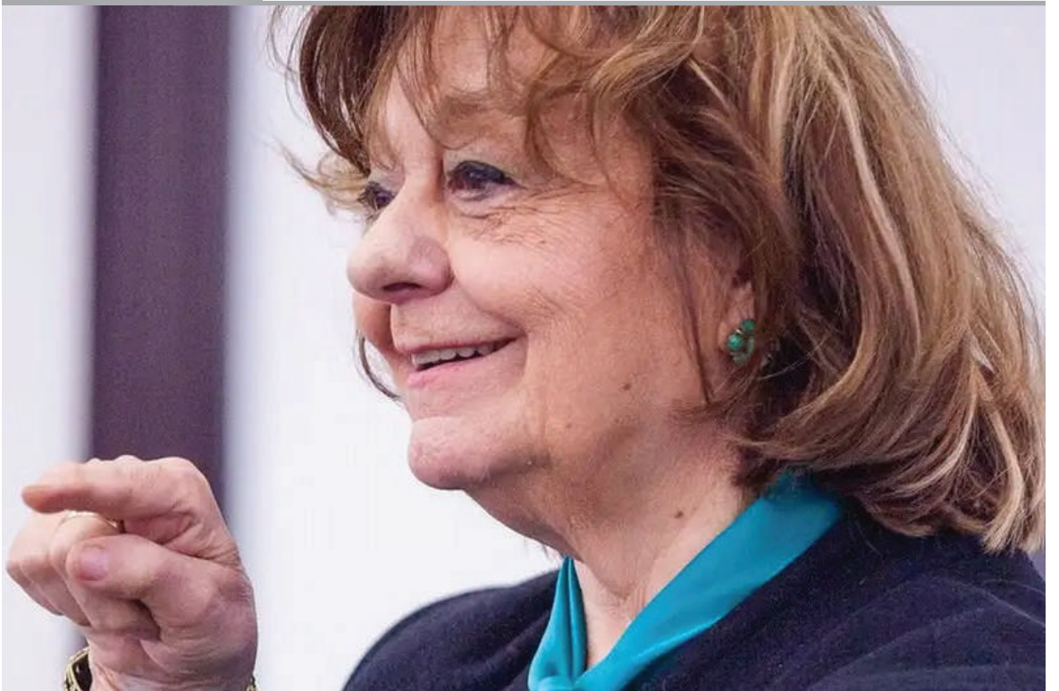
LA POETA Ana Blandiana, una de las figuras más relevantes de la literatura rumana fue galardonada con el Premio Princesa de Asturias de las Letras 2024.