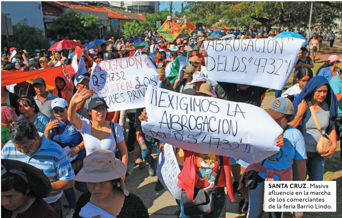
SANTA CRUZ. Masiva afluencia en la marcha de los comerciantes de la feria Barrio Lindo.

GREMIALES PREVEN FORTALECER SUS MEDIDAS DE PRESIÓN DESDE INICIOS DE JUNIO, SI EL GOBIERNO NO SOLUCIONA SUS PEDIDOS.