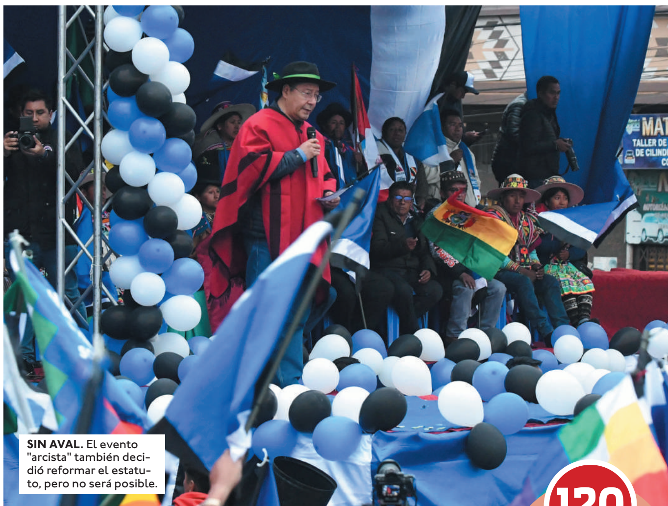
SIN AVAL. El evento "arcista" también decidió reformar el estatuto, pero no será posible.

Parte resolutive. En el punto 2 de la resolución aprobada este jueves por sala plena del TSE señala: "Rechazar el registro del Congreso Nacional Ordinario del MAS-IPSP realizado el 3, 4 y 5 de