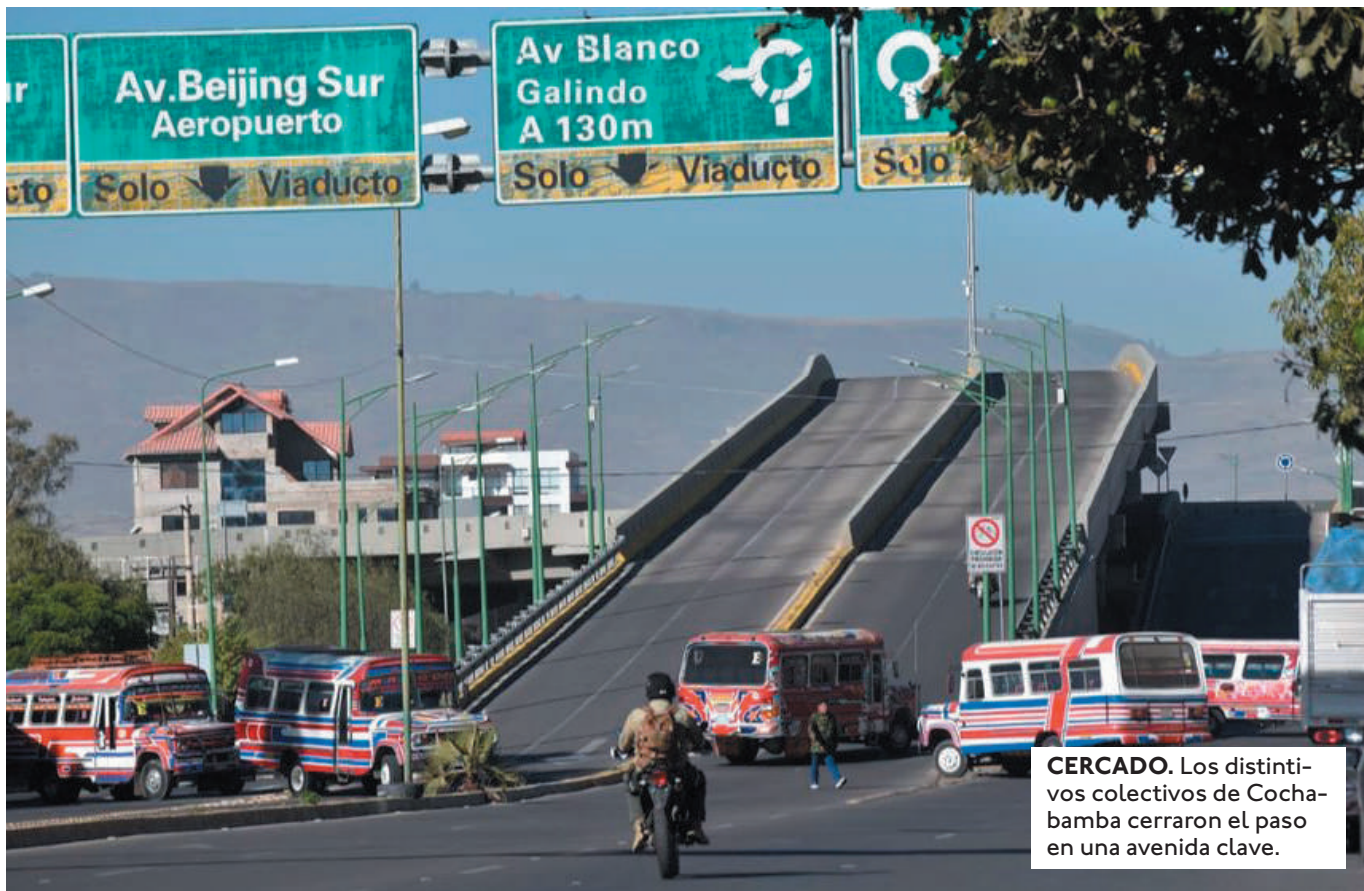
CERCADO. Los distintivos colectivos de Cochabamba cerraron el paso en una avenida clave.

PARA EL 3 Y 4 DE JUNIO, EL TRANSPORTE PESADO CONVOCÓ A UN BLOQUEO NACIONAL DE CAMINOS POR LA FALTA DE DÓLARES Y COMBUSTIBLES.