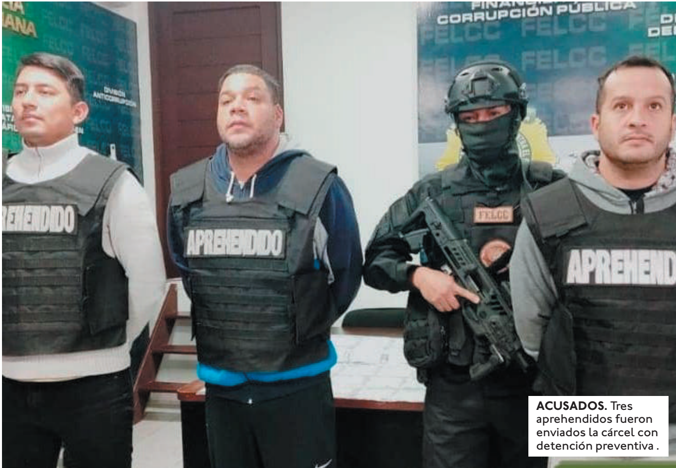
ACUSADOS. Tres aprehendidos fueron enviados la cárcel con detención preventiva.

LE PAGABAN ENTRE 35 Y 50 BOLIVIANOS POR CADA ENVÍO DE DINERO QUE HACÍA CADA UNIVERSITARIO. LOS RECLUTABAN POR REDES SOCIALES.