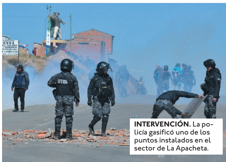
INTERVENCIÓN. La policía gasificó uno de los puntos instalados en el sector de La Apacheta.