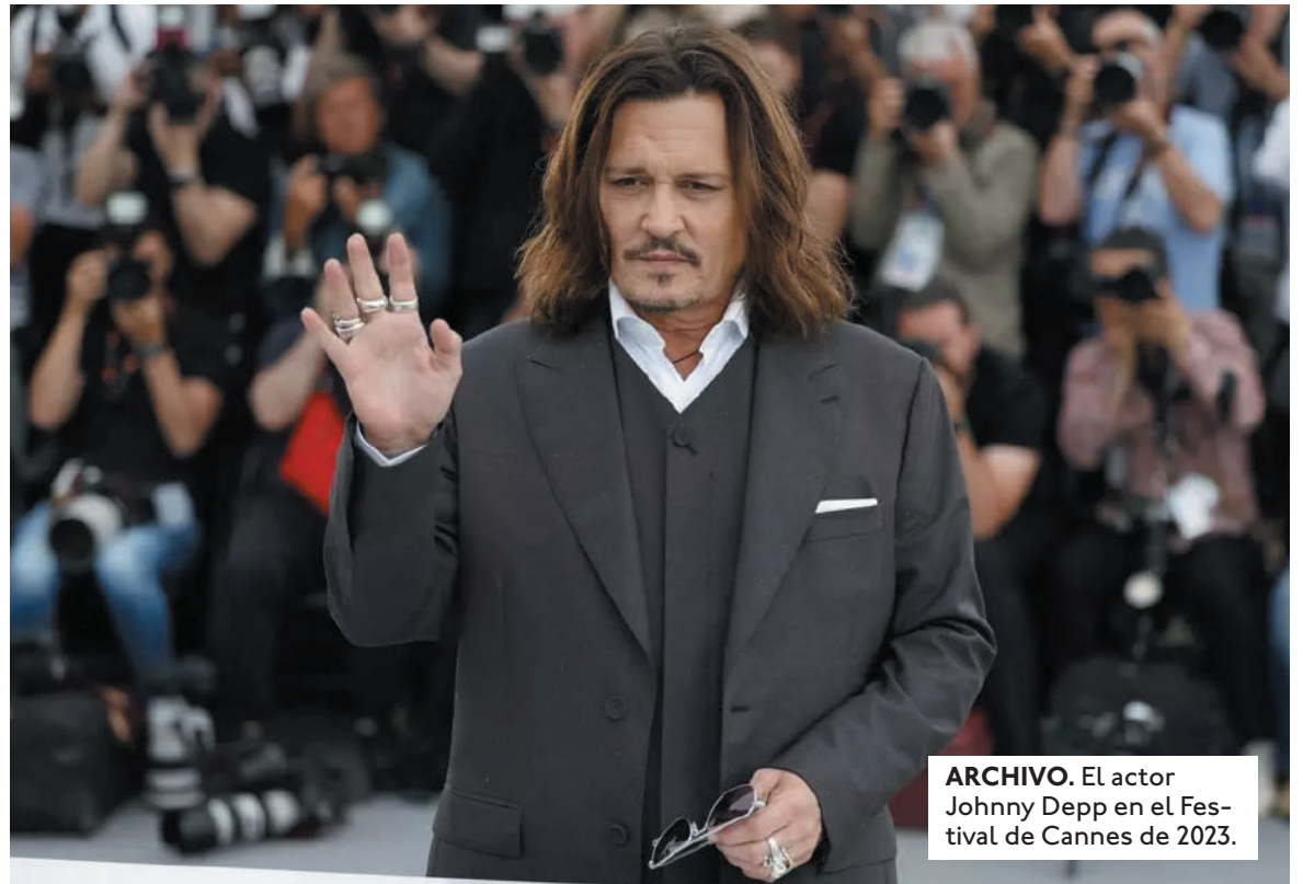
ARCHIVO. El actor Johnny Depp en el Festival de Cannes de 2023.

En mayo, Jeff Bridges actualizó sobre su estado de salud, tres años después de revelar su diagnóstico de cáncer. Tras anunciar su diagnóstico en 2020, el actor