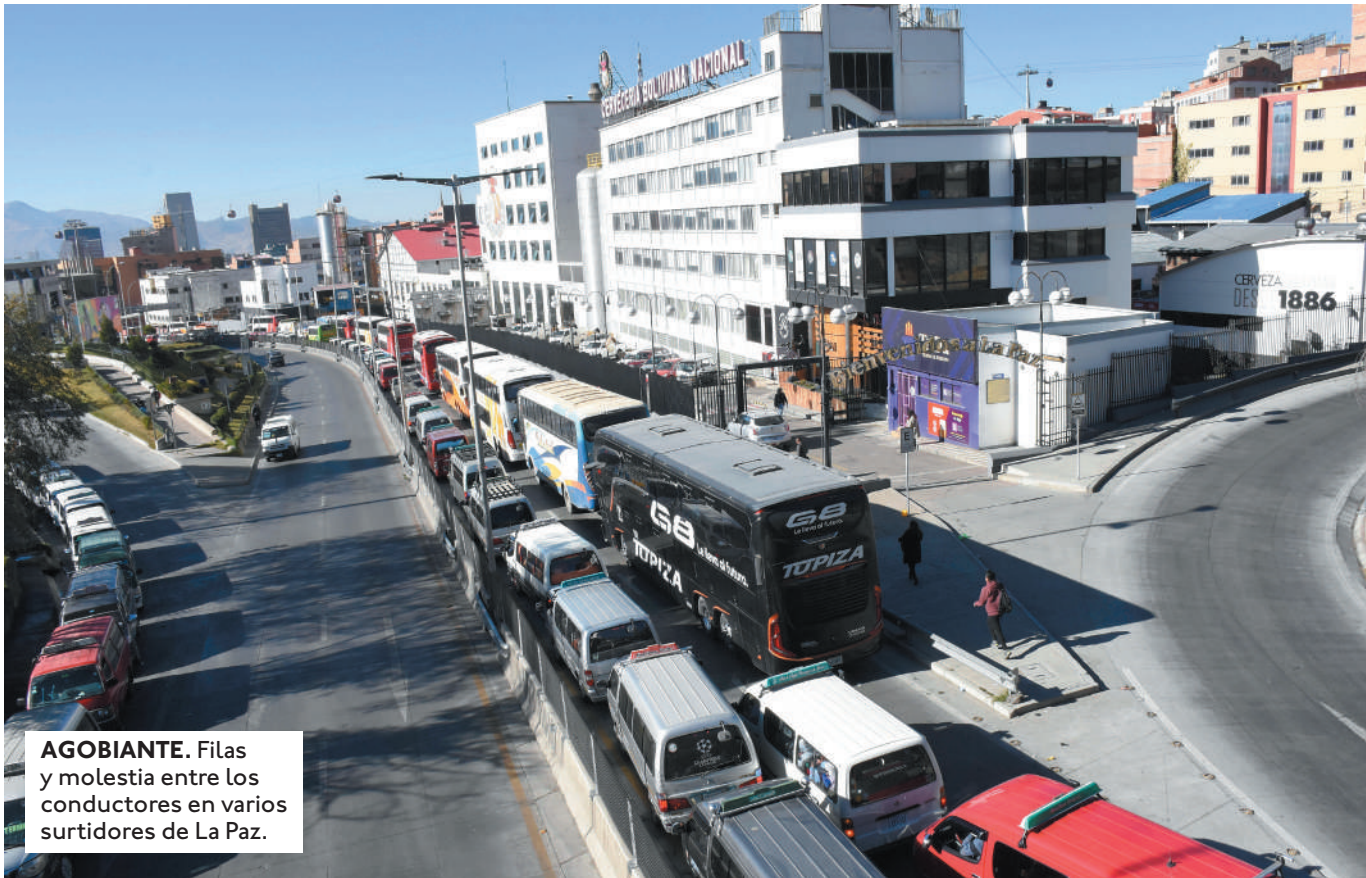
AGOBIANTE. Filas y molestia entre los conductores en varios surtidores de La Paz.

"HOY, ESTAMOS VIENDO ALGUNAS FILAS EN LOS SURTIDORES", DIJO EL PRESIDENTE DE YPFB, ARMIN DORGATHEN QUIEN PIDIÓ A LA POBLACIÓN NO CAER EN LA ESPECULACIÓN.