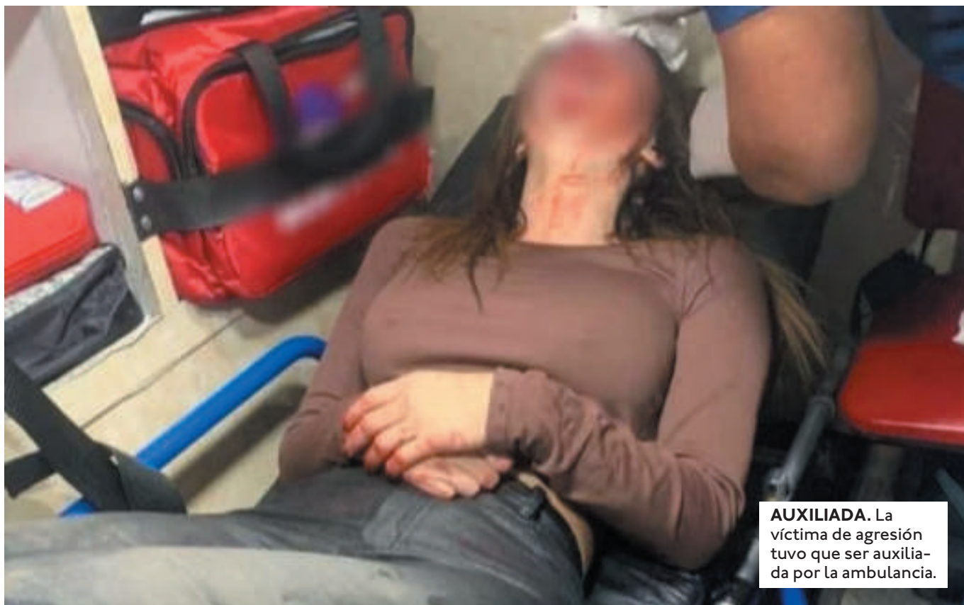
AUXILIADA. La víctima de agresión tuvo que ser auxiliada por la ambulancia.

LA POLICÍA INICIÓ LAS INVESTIGACIONES TRAS LA DENUNCIA PRESENTADA POR LA VÍCTIMA POR EL DELITO DE VIOLENCIA FAMILIAR Y DOMÉSTICA.