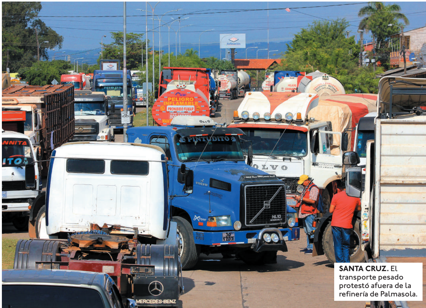
SANTA CRUZ. El transporte pesado protestó afuera de la refinería de Palmasola.

CONFEDERACIONES NO AFINES AL GOBIERNO HAN ANUNCIADO BLOQUEO EL 10 DE JUNIO Y MARCHA EL 11 DESDE PATACAMAYA.