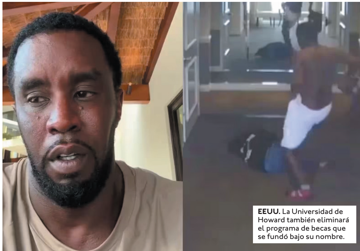
EEUU. La Universidad de Howard también eliminará el programa de becas que se fundó bajo su nombre.

En el comunicado publicado en el sitio web de la universidad, se menciona: "El comportamiento de Combs, tal como se ve en un video publicado recientemente, es fundamentalmente incompatible con los valores y creencias de la Universidad de Howard, que ya no se lo considera digno de ostentar el más alto honor de la institución". El portavoz añadió que "el centro de estudios se opone inquebrantable a todos los actos de violencia interpersonal". Además de revocar el doctorado honorario y devolverle la donación realizada el año pasado, también se disolverá el programa de becas a su nombre y se rescindirá un acuerdo de compromiso firmado en 2023 con la Fundación Sean Combs,