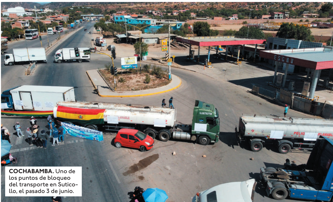
COCHABAMBA. Uno de los puntos de bloqueo del transporte en Súticollo, el pasado 3 de junio.

LA FALTA DE COMBUSTIBLE AFECTA LA ZAFRA CAÑERA EN SANTA CRUZ Y PERJUDICA TAMBIÉN EL AVANCE EN LA CAMPAÑA DE INVIERNO.