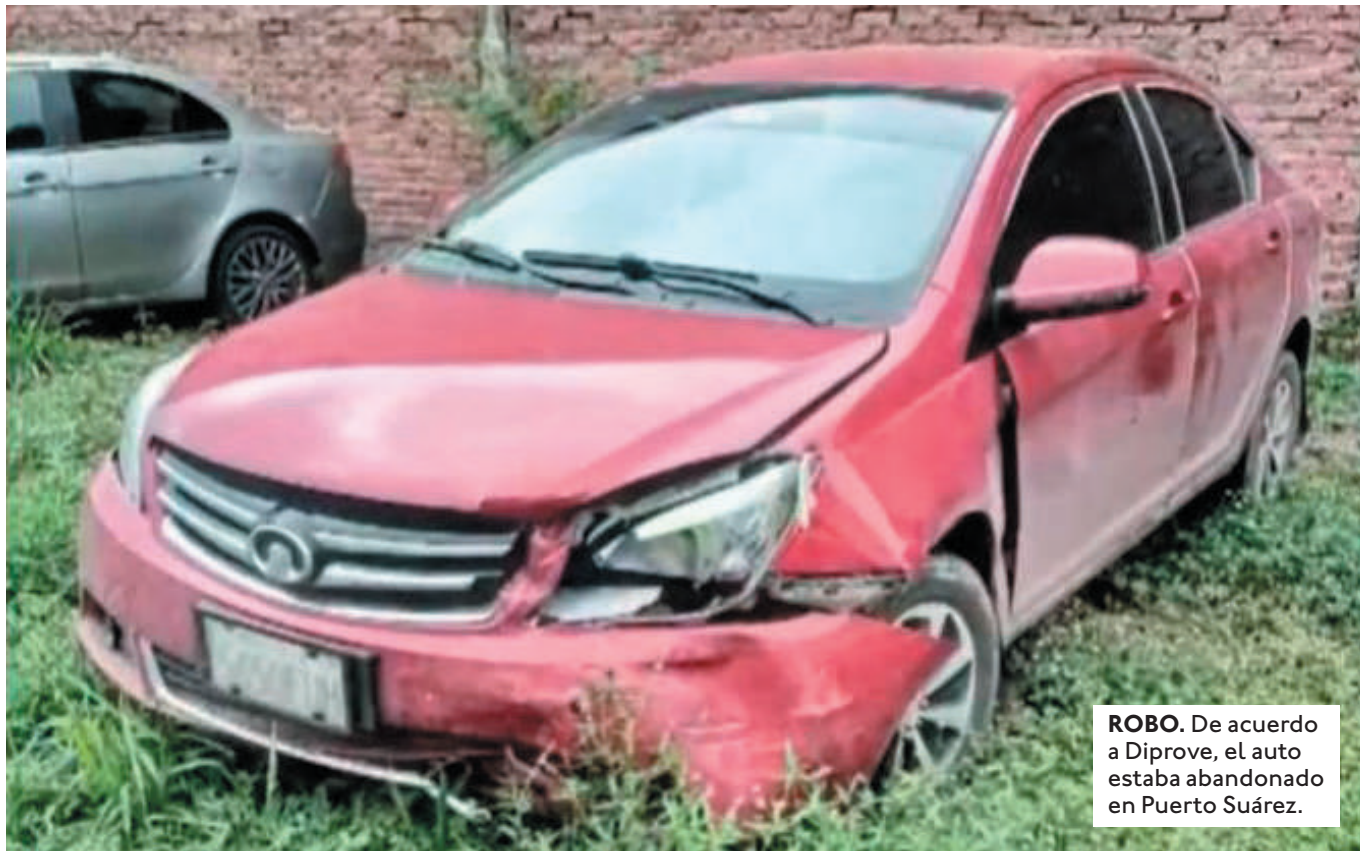
ROBO. De acuerdo a Diprove, el auto estaba abandonado en Puerto Suárez.

LOS PROPIETARIOS DEL VEHÍCULO PRESENTARÁN DENUNCIA YA QUE EL VEHÍCULO FUE HURTADO DE LA COMISARÍA DE LA PAMPA DE LA ISLA.