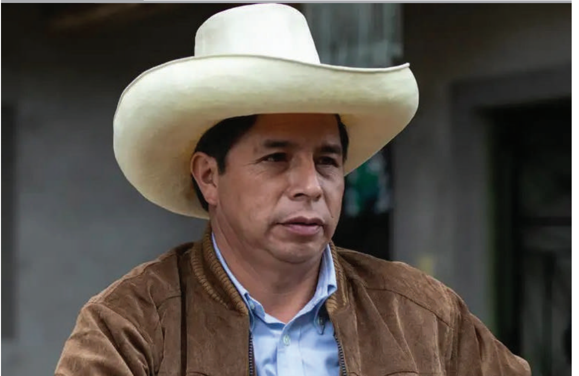
PEDRO CASTILLO seguirá otros 14 meses en prisión preventiva. La Justicia de Perú amplió la prisión preventiva contra el expresidente peruano, procesado por intento de golpe de Estado en diciembre de 2022.