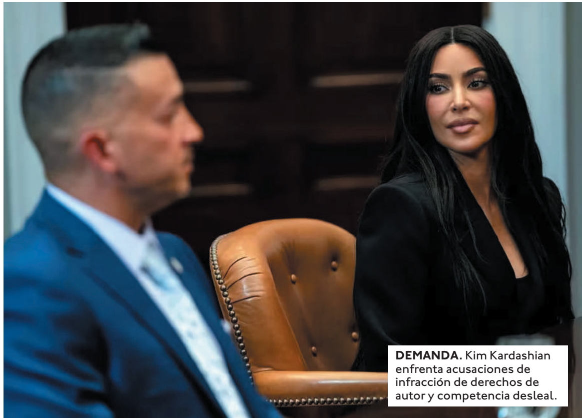
DEMANDA. Kim Kardashian enfrenta acusaciones de infracción de derechos de autor y competencia desleal.

Según la Fundación Judd, las piezas mostradas en el video fueron fabricadas por Clements Design y copiaban los famosos diseños de Judd, como la mesa La Mansana y la silla 84. Judd, fallecido en 1994, era conocido por su enfoque en las formas limpias y los materiales industriales, y sus diseños se han convertido en íconos entre los coleccionistas de muebles desde 1982. La Fundación señaló que sus auténticas mesas se venden por aproximadamente 90.000 dólares y las sillas por 9.000 dólares cada una. No obstante, los muebles en la oficina de la mediática parecían estar hechos de madera contracha-