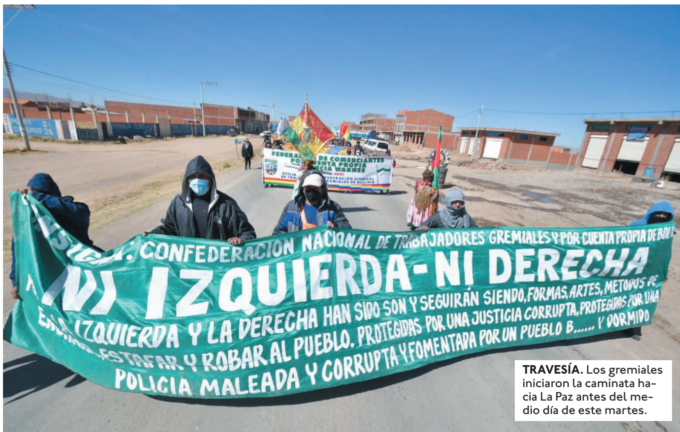
TRAVESÍA. Los gremiales iniciaron la caminata hacia La Paz antes del medio día de este martes.

EL MINISTRO DE OBRAS PÚBLICAS, ÉDGAR MONTAÑO, ENVIÓ CARTAS A LA DIRIGENCIA DEL TRANSPORTE Y LES PIDIÓ NO SER INTRANSIGENTES.