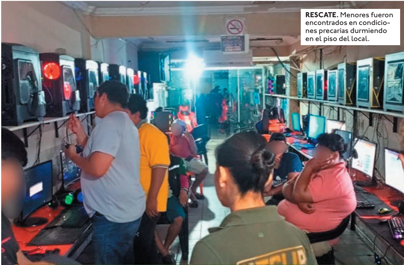
RESCATE. Menores fueron encontrados en condiciones precarias durmiendo en el piso del local.

ESTE HECHO HA DESTAPADO UNA RED DE CORRUPCIÓN DE MENORES, TRATA Y TRÁFICO DE PERSONAS CON FINES DE MENDICIDAD Y EXPLOTACIÓN LABORAL.