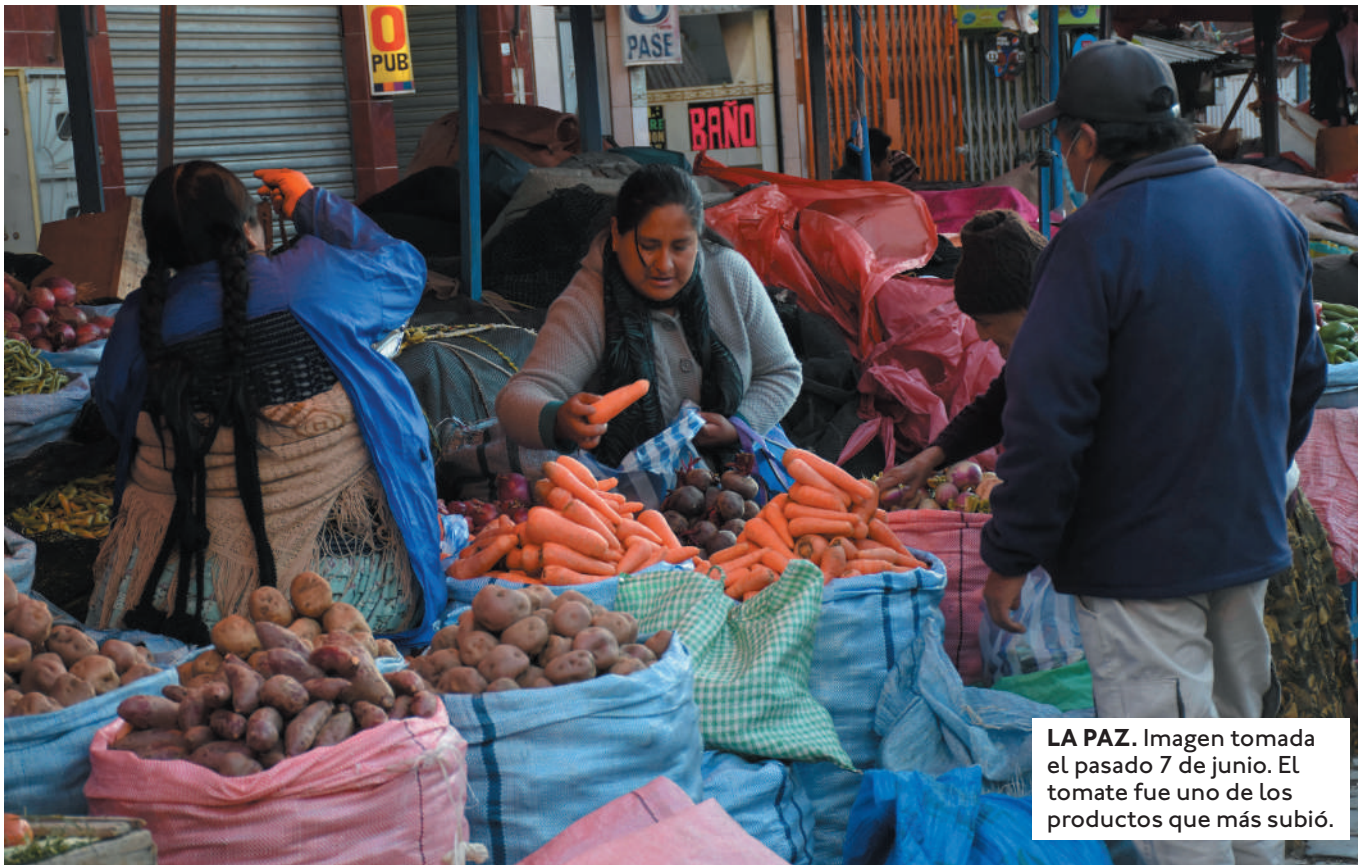
LA PAZ. Imagen tomada el pasado 7 de junio. El tomate fue uno de los productos que más subió.

SEGÚN EL MINISTRO NÉSTOR HUANCA, BOLIVIA PRODUJO ESTE AÑO 851 MIL TONELADAS Y EL CONSUMO ES DE 828 MIL, LO QUE DEJA UN SALDO A FAVOR DE 23 MIL.