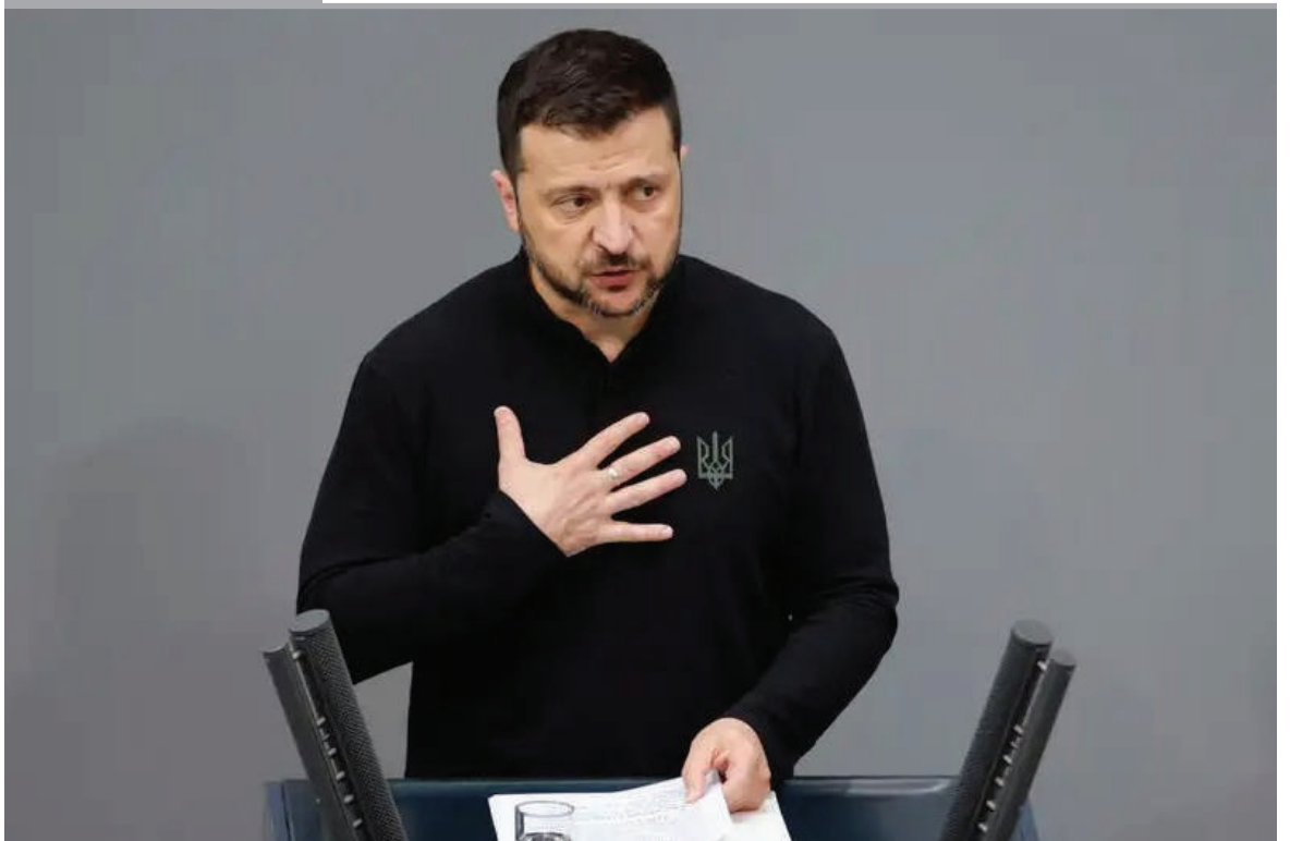
ZELENSKI alerta contra la retórica prorrusa en Europa. El discurso del presidente ucraniano desde el Bundestag fue boicoteado por los diputados de AfD y de la izquierda radical, que se ausentaron del hemiciclo.