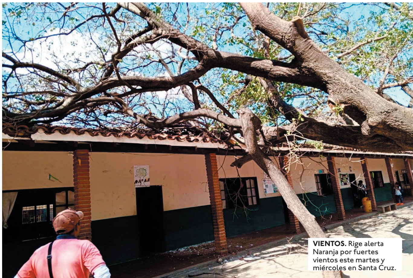
VIENTOS. Rige alerta Naranja por fuertes vientos este martes y miércoles en Santa Cruz.

(SENAMHI) EMITIÓ UNA ALERTA NARANJA EN NUEVE PROVINCIAS. SE PRONOSTICAN RÁFAGAS DE HASTA 90 KM/H PARA ESTE MIÉRCOLES.