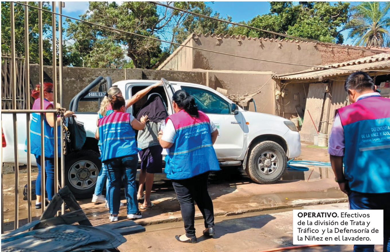
OPERATIVO. Efectivos de la división de Trata y Tráfico y la Defensoría de la Niñez en el lavadero.

TRAS LA INTERVENCIÓN EVIDENCIARON QUE LOS MENORES, ADEMÁS DE OTRAS PERSONAS, VIVÍAN EN DOS CUARTOS EN CONDICIONES DE HACINAMIENTO