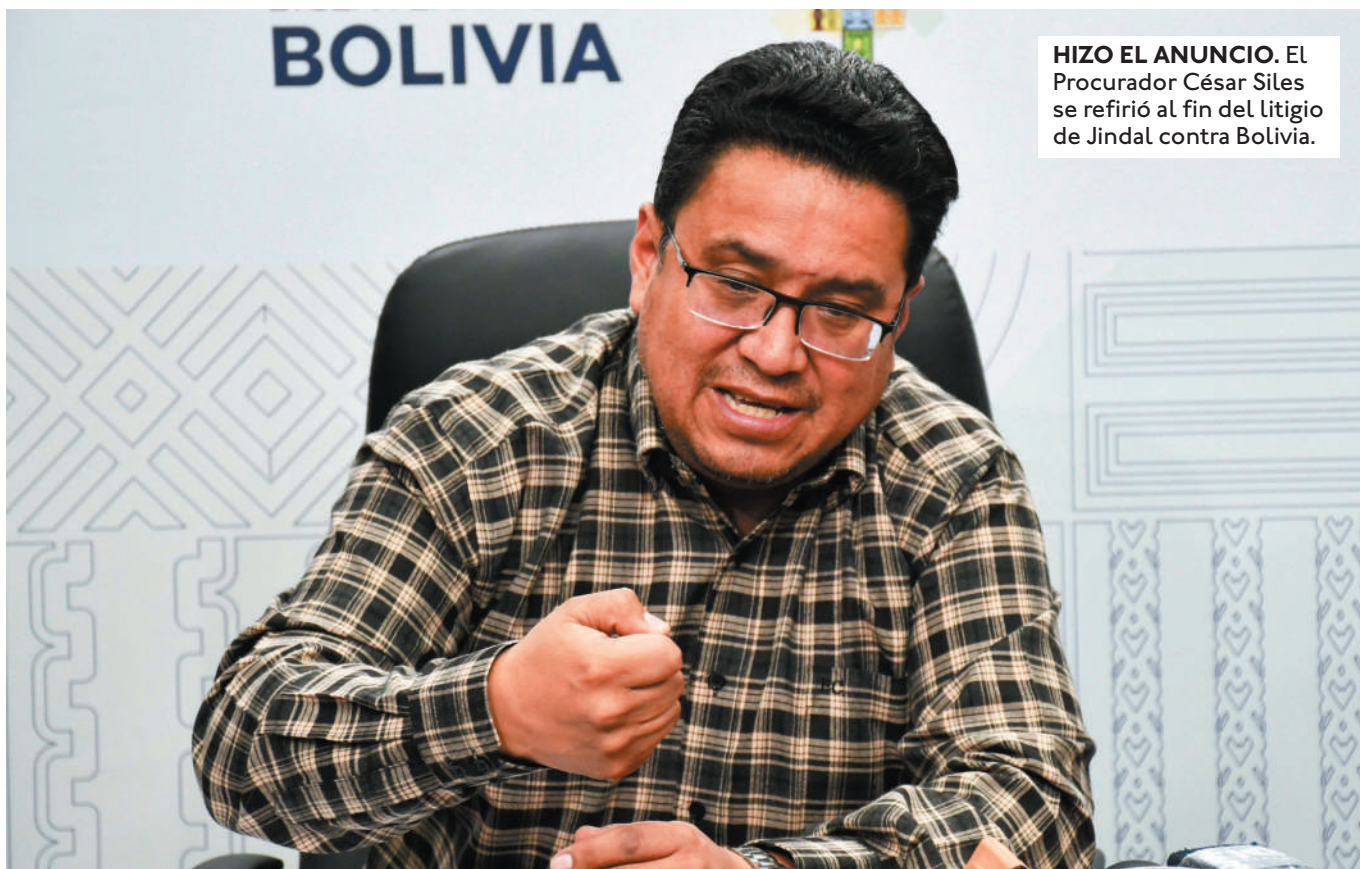
HIZO EL ANUNCIO. El Procurador César Siles se refirió al fin del litigio de Jindal contra Bolivia.

CON INVERSIÓN DE $US 546 MILLONES SE ESPERA PRODUCIR 200 MIL TONELADAS DE ACERO POR AÑO. EN SEPTIEMBRE SE ENTREGARÁN SEIS DE LAS SIETE PLANTAS.