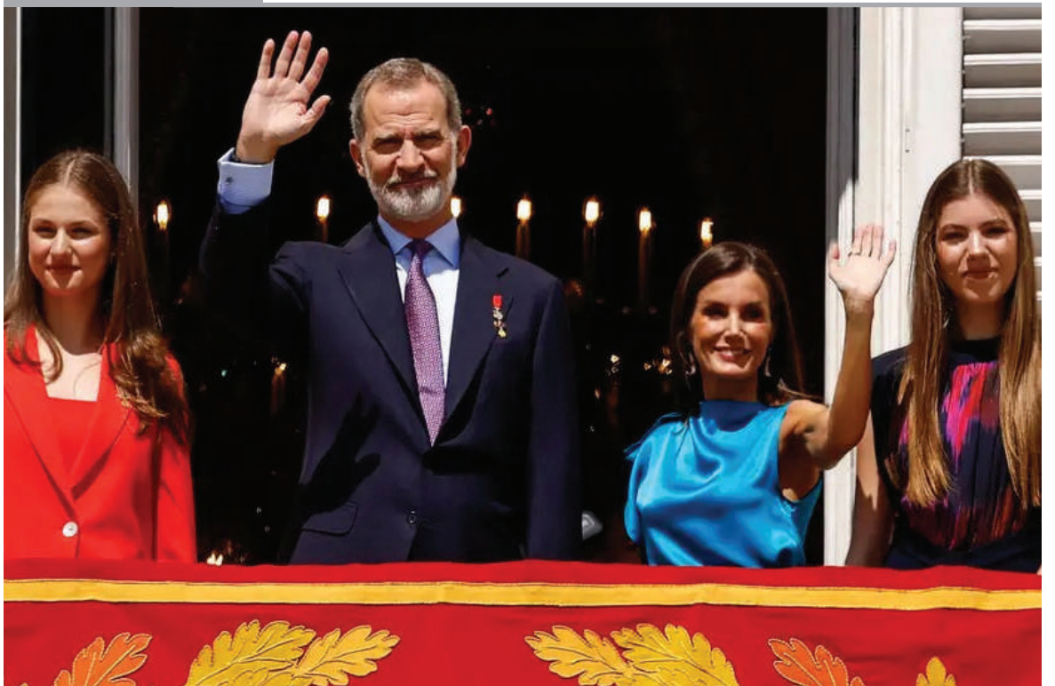
ESPAÑA CELEBRA DIEZ AÑOS DE REINADO DE FELIPE VI. Varios actos oficiales conmemoran en Madrid que se cumple una década desde la proclamación del rey el 19 de junio de 2014.