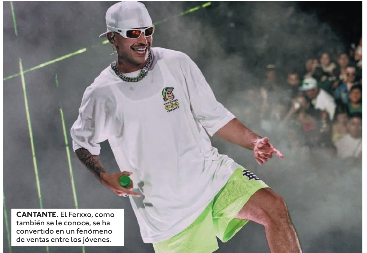
CANTANTE. El Ferxxo, como también se le conoce, se ha convertido en un fenómeno de ventas entre los jóvenes.

Por otro lado, Alejandro Domínguez, presidente de la Conmebol, destacó la participación de Feid en la inauguración de la Copa América 2024.