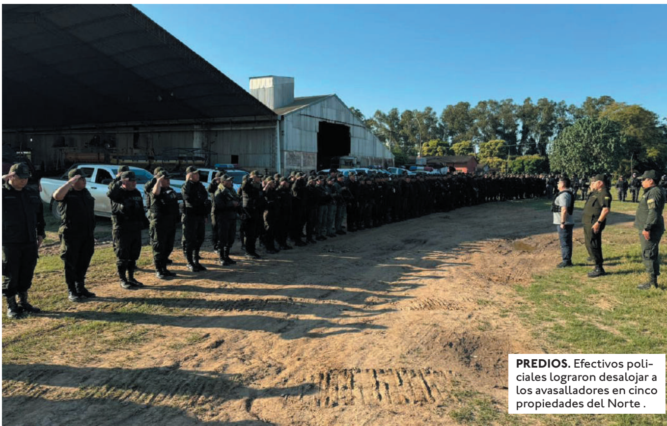
PREDIOS. Efectivos policiales lograron desalojar a los avasalladores en cinco propiedades del Norte.

EL FISCAL CARLOS CANDIA REVELÓ QUE, CUANDO ESTABA INGRESANDO A LOS PREDIOS AVASALLADOS EN LA LOCALIDAD DE SAN PEDRO, UN GRUPO DE PERSONAS LO RETUVO E INTENTÓ AGREDIRLO.