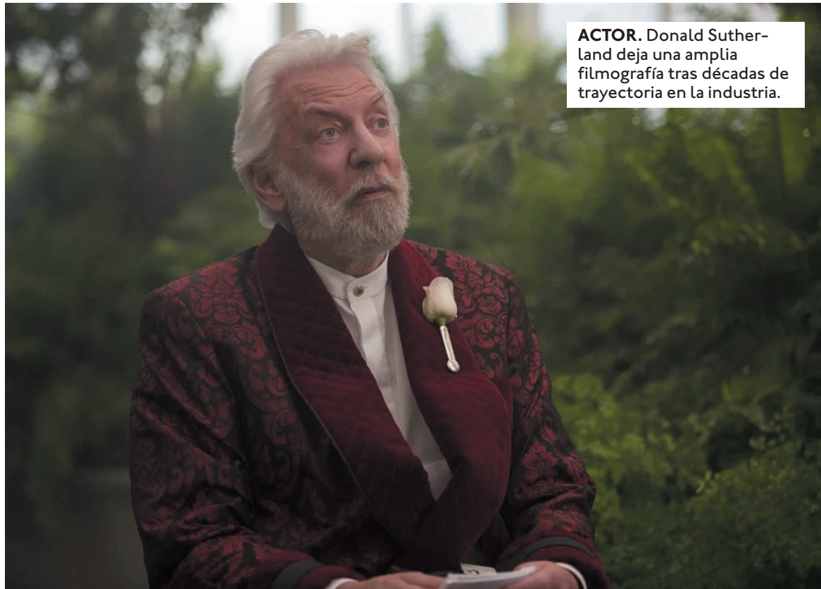
ACTOR. Donald Sutherland deja una amplia filmografía tras décadas de trayectoria en la industria.

En uno de sus primeros cambios de ritmo en la caracterización, Sutherland interpretó a un fascista sádico en la película épica 1900 de Bernardo Bertolucci de 1976, en la que su personaje balancea alegremente a un niño por los talones, golpeando la cabeza del niño contra una pared. Nacido el 17 de julio de 1935 en Saint John, New Brunswick, Canadá, Donald Sutherland acumuló unos 200 créditos cinema-