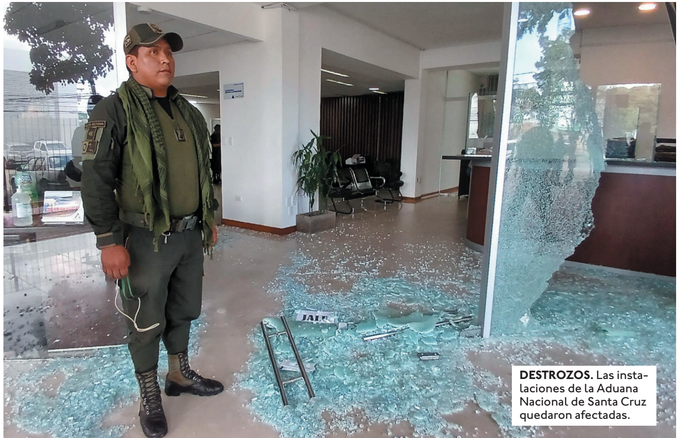
DESTROZOS. Las instalaciones de la Aduana Nacional de Santa Cruz quedaron afectadas.