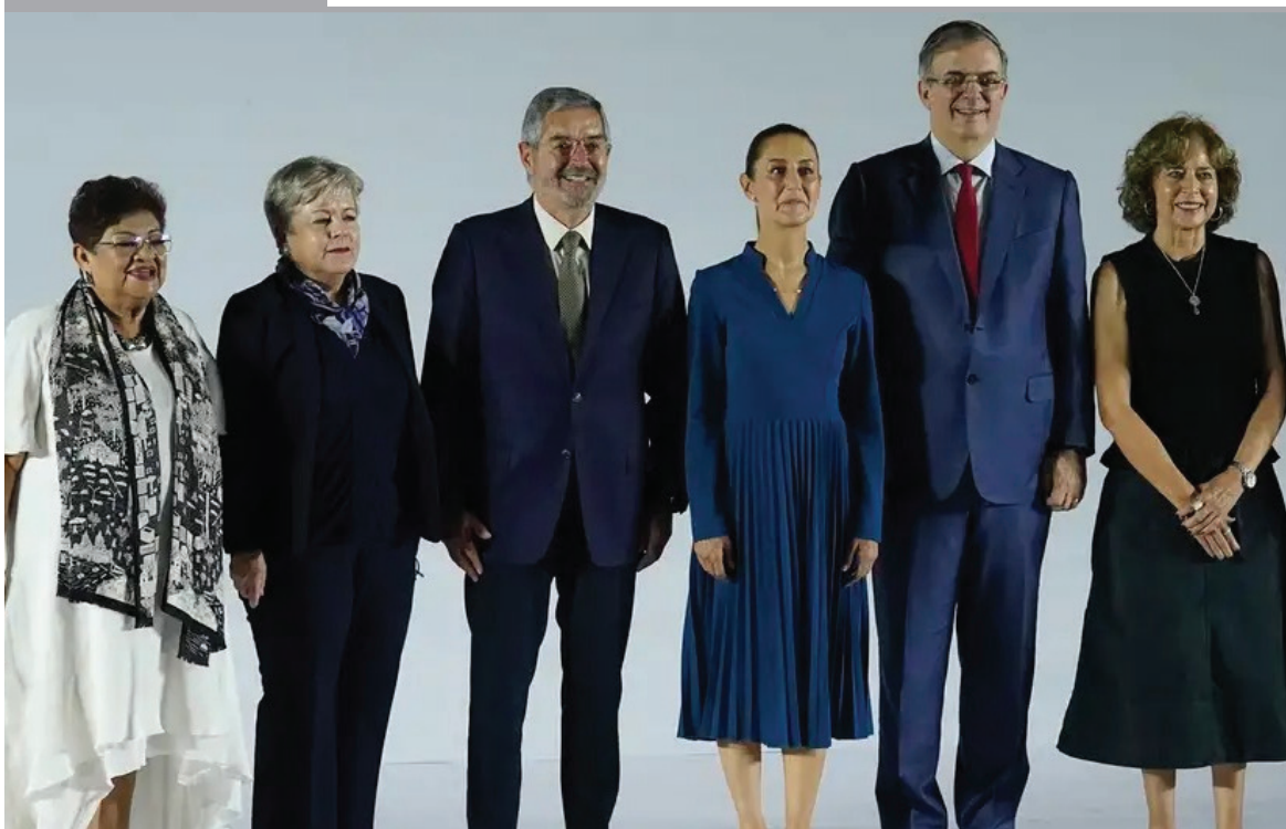
LA PRESIDENTA ELECTA DE MÉXICO, Claudia Sheinbaum, presentó a la primera parte de su gabinete. Tres hombres y tres mujeres asumirán carteras tan relevantes como la de Relaciones Exteriores, Economía y Ciencia. Para ello fueron escogidos "hombres y mujeres de primera", según palabras de Sheinbaum.