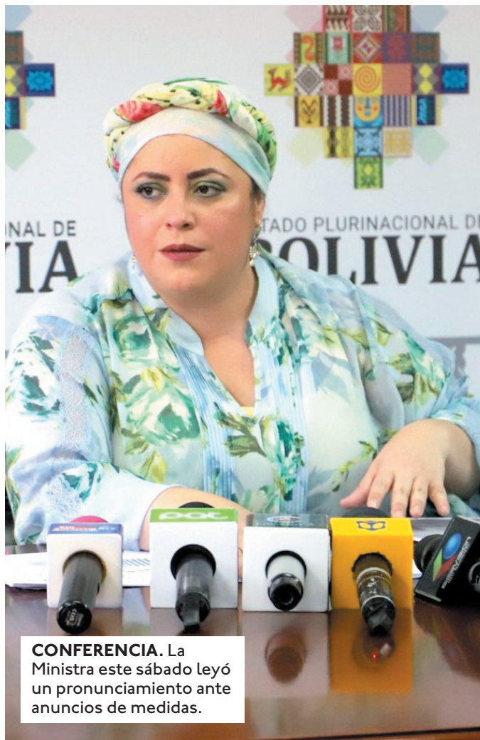
CONFERENCIA. La Ministra este sábado leyó un pronunciamiento ante anuncios de medidas.

"Evo Morales está dispuesto a bloquear nuestra economía y a con-