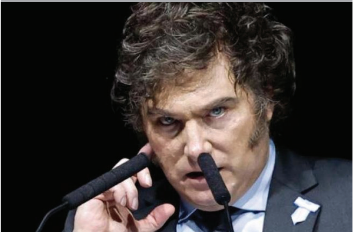
EL PRESIDENTE DE ARGENTINA, Javier Milei, llegó a España, en medio de un conflicto diplomático con el Gobierno del socialista Pedro Sánchez.