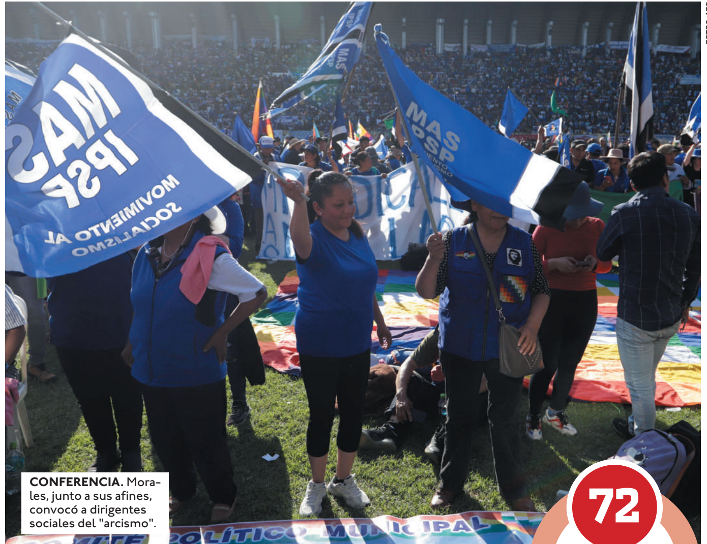
CONFERENCIA. Morales, junto a sus afines, convocó a dirigentes sociales del "arcismo".

Admite obligación de consensuar. En ese sentido, Morales indicó que su partido se encuentra "unido" y que los arcistas fueron citados para atender una de las observaciones realizadas por el TSE a las anteriores convocatorias hechas por el sector evista.