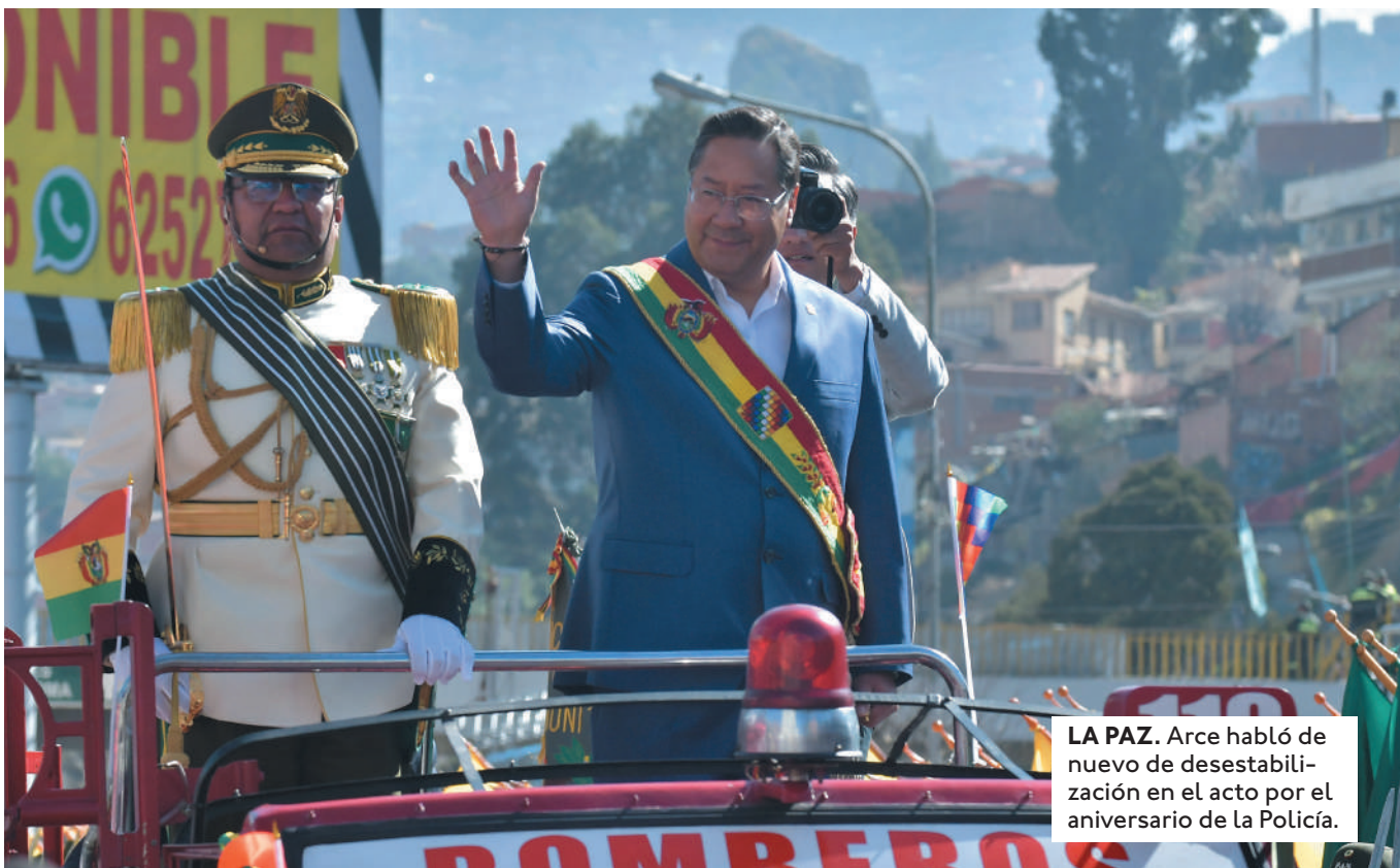
LA PAZ. Arce habló de nuevo de desestabilización en el acto por el aniversario de la Policía.

PARA DES-CALIFICAR DIVERSAS MOVILIZACIONES, EL GOBIERNO OPTÓ POR EL DISCURSO DEL SUPUESTO "GOLPE BLANDO", PERO SIN PRUEBAS AL RESPECTO.