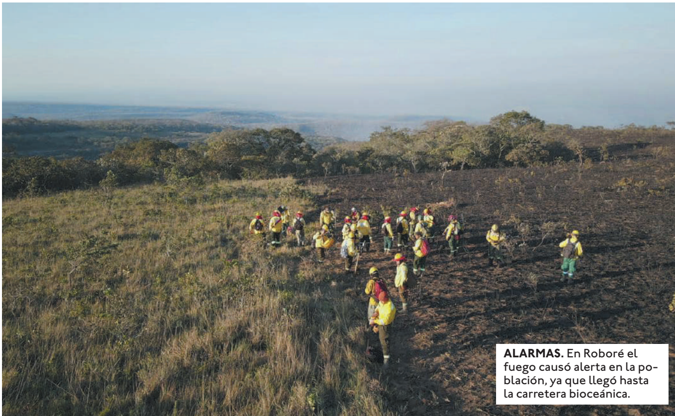
ALARMAS. En Roboré el fuego causó alerta en la población, ya que llegó hasta la carretera bioceánica.

EN ROBORÉ, EL FIN DE SEMANA SE DETECTARON LAS EMERGENCIAS EN LA ZONA DE CHOCHIS, TOTAIZALES Y EL VALLE DE TUCABACA, EN SANTIAGO DE CHIQUITO