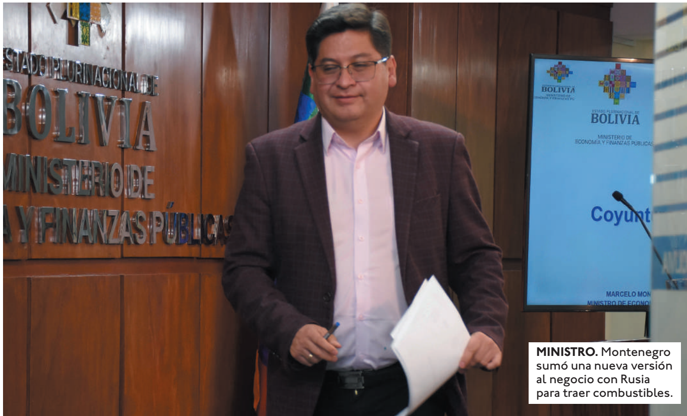
MINISTRO. Montenegro sumó una nueva versión al negocio con Rusia para traer combustibles.

LA COMPRA DE COMBUSTIBLE RUSO FUE ABORDADA EN LA REUNIÓN ENTRE LUIS ARCE CATAORA Y VLADIMIR PUTIN EN SAN PETERSBURGO.