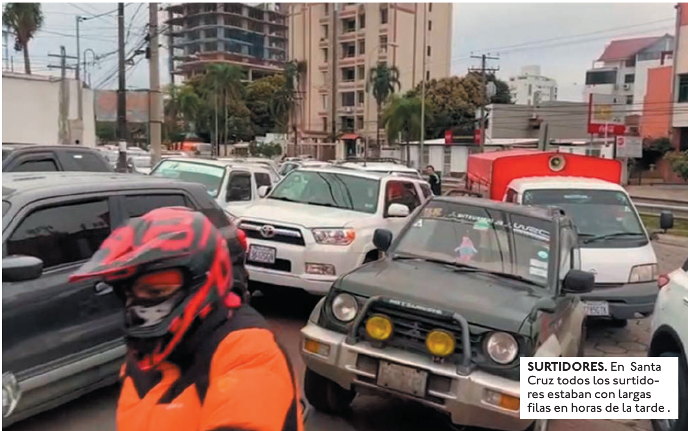
SURTIDORES. En Santa Cruz todos los surtidores estaban con largas filas en horas de la tarde.

EL COMITÉ PRO SANTA CRUZ ANUNCIÓ UNA REUNIÓN DE DIRECTORIO PARA EVALUAR LO SUCEDIDO.. FIJARON POSTURA EN DEFENSA DE LA DEMOCRACIA.