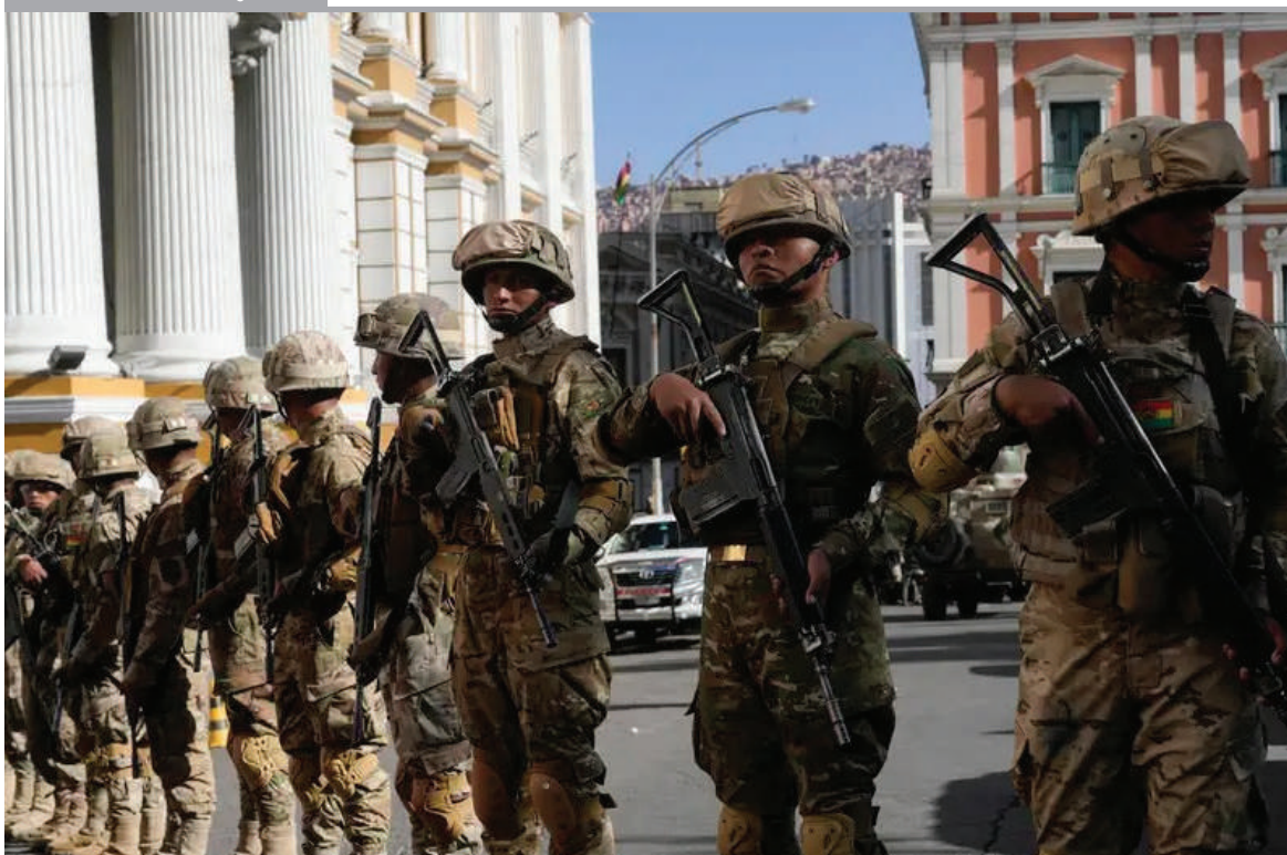
VOLVER AL PASADO. Muchos bolivianos recordaron los oscuros tiempos de los golpes de estado en el país. Éramos campeones mundiales. Es el retroceso al que nos lleva el MAS.