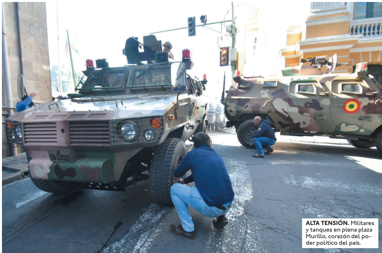
ALTA TENSION. Militares y tanques en plena plaza Murillo, corazón del poder político del país.