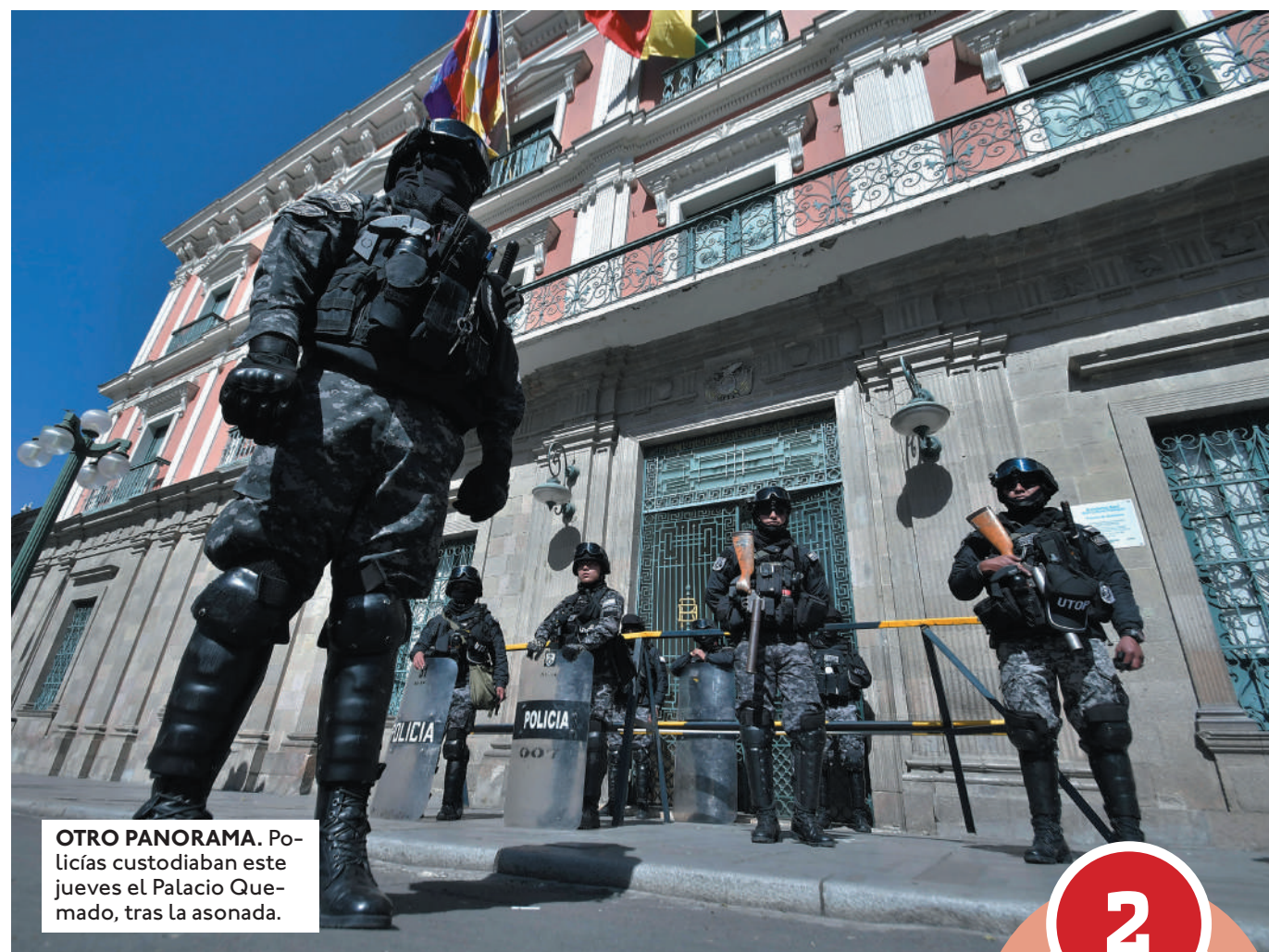
OTRO PANORAMA. Policías custodiaban este jueves el Palacio Quemado, tras la asonada.

Sospechan de espectáculo y show. "¿Fue un espectáculo mediático montado por el propio gobierno, tal y como dice el general Zúñiga? ¿Fue solo una locura de algunos militares? ¿Fue simplemente una muestra más de descontrol? ¿Qué fue lo que pasó ayer? Explique y dé la cara, presi-