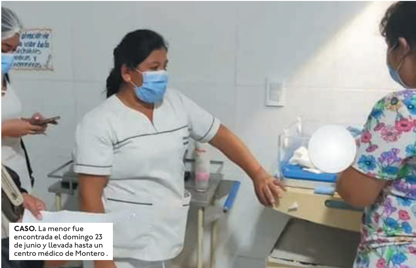
CASO. La menor fue encontrada el domingo 23 de junio y llevada hasta un centro médico de Montero.

ESTE JUEVES, LAS AUTORIDADES CONFIRMARON QUE LOS DELITOS QUE SE INVESTIGAN SON ABANDONO DE MENOR DE EDAD E INTENTÓ DE INFANTICIDIO.