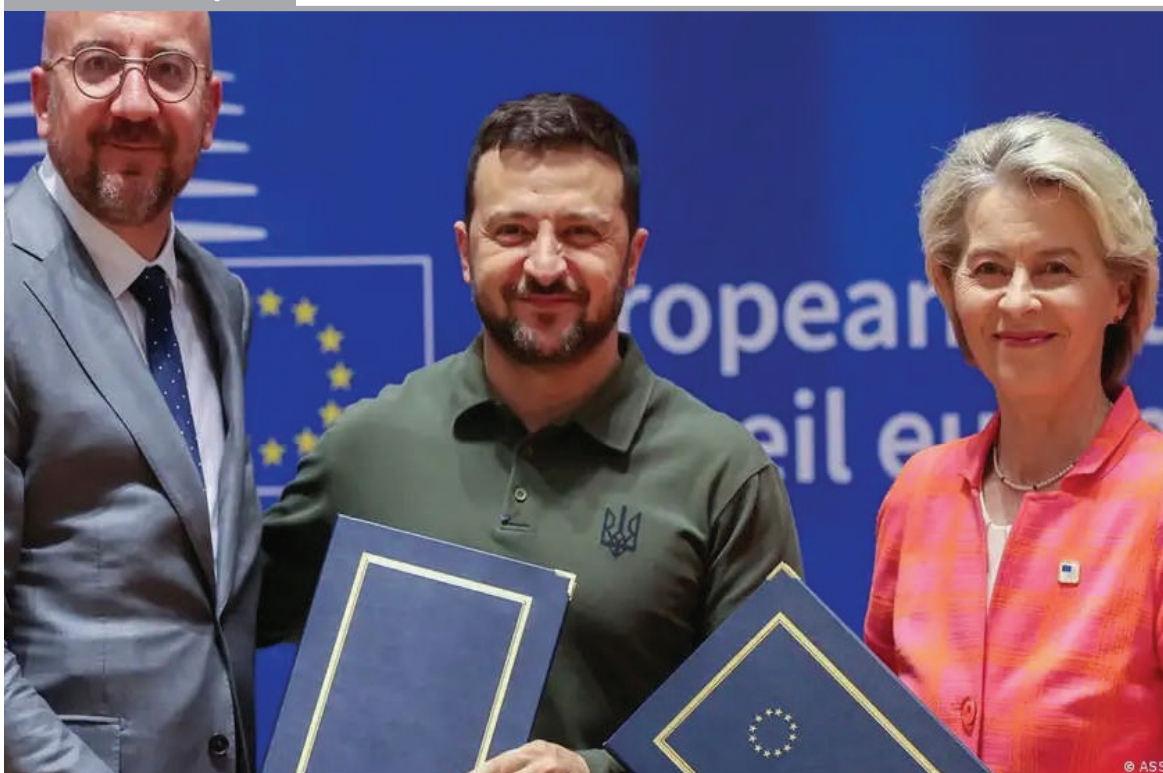
ZELENSKI FIRMA CON LA UE UN ACUERDO DE SEGURIDAD. Proseguir con el apoyo militar y financiero a Kiev, y avanzar con el proceso de adhesión son los objetivos del acuerdo.