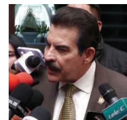
Manfred Reyes Villa

El alcalde de Cochabamba, Manfred Reyes Villa pidió a la población que "no tenga miedo no va a haber ningún golpe de Estado" mientras el pueblo esté unido. Lamentó haber visto a personas afligidas corriendo a los cajeros y a los mercados.