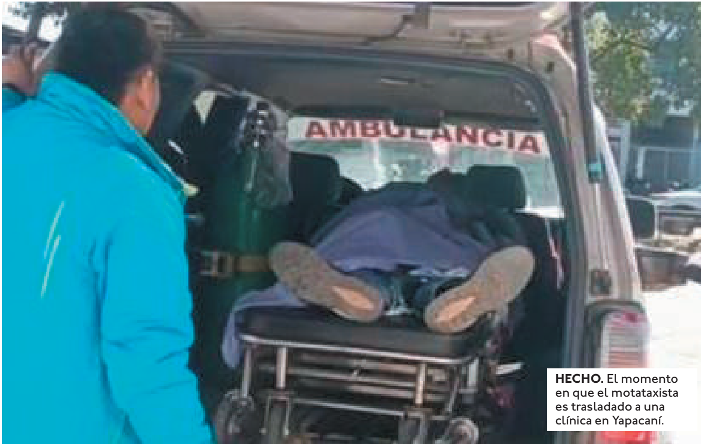
HECHO. El momento en que el mototaxista es trasladado a una clínica en Yapacaní.

EL HOMBRE ATACADO POR SU PASAJERO SE ENCUENTRA EN ESTADO CRÍTICO. SUS FAMILIARES PIDIERON AYUDA PARA CUBRIR LOS GASTOS EN LA CLÍNICA.