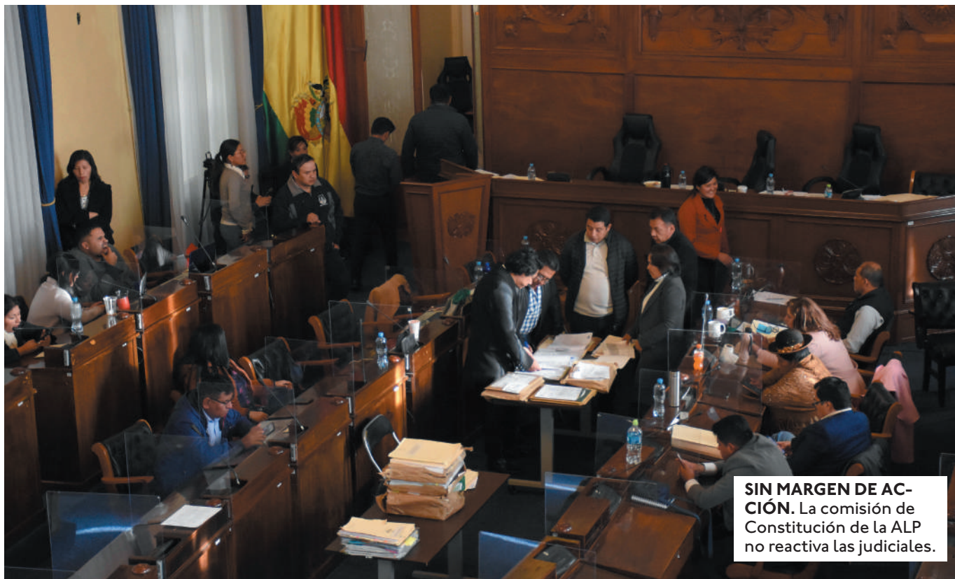
SIN MARGEN DE ACCIÓN. La comisión de Constitución de la ALP no reactiva las judiciales.

PARA HACER LAS JUDICIALES EL TSE NECESITA CINCO MESES DESDE QUE LA ALP ENTREGUE LAS LISTAS. ES DECIR QUE ANTES DE DICIEMBRE NO HABRÁ COMICIOS.