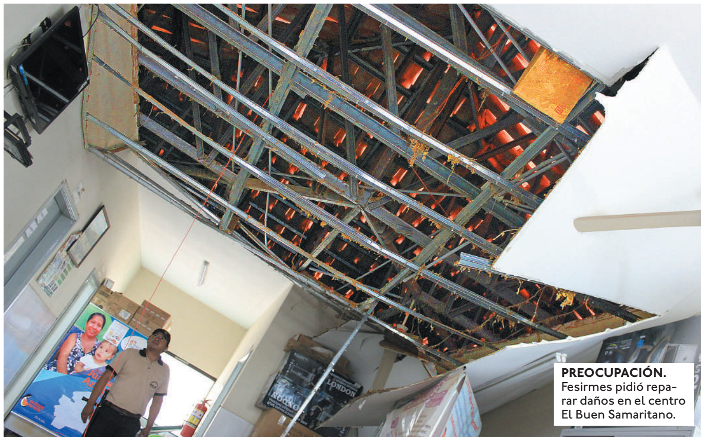
PREOCUPACIÓN. Fesirmes pidió reparar daños en el centro El Buen Samaritano.

EN LA REUNIÓN, DISCUTIERON: MANTENIMIENTO DE CENTROS DE SALUD, LA DOTACIÓN DE MEDICAMENTOS E INSUMOS Y CONTRATACIÓN DE PERSONAL.