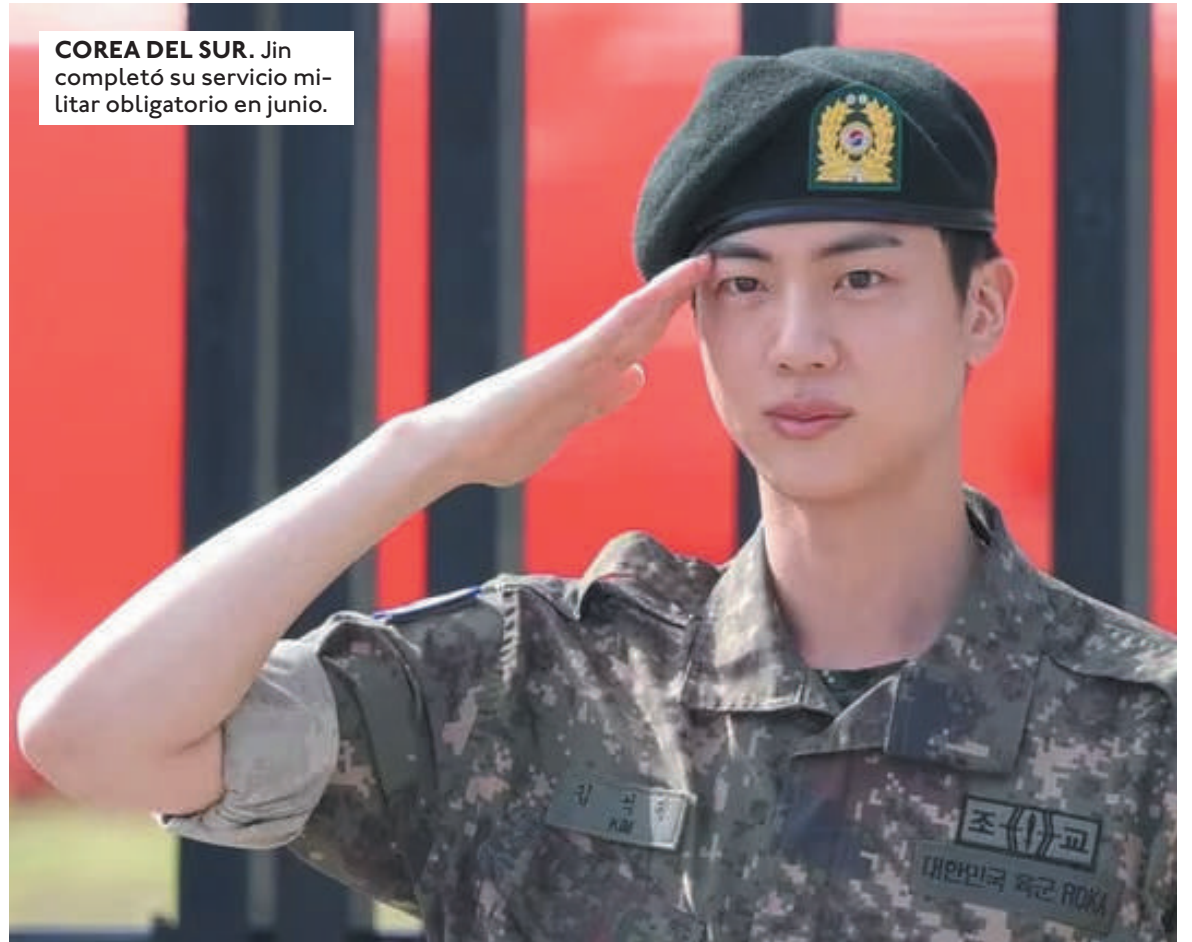
COREA DEL SUR. Jin completó su servicio militar obligatorio en junio.

Jin se unirá a otras figuras importantes como el exfutbolista marfileño Didier Drogba, el exjugador de baloncesto franco-estadounidense Tony Parker, un sobreviviente del Holocausto, familiares de víctimas del atentado de Niza, astronautas y una diversidad de atletas en la ruta del relevo. La elección de Jin como portador de la antorcha se atribuye a la popularidad global de BTS y su alcance en el público juvenil. La boyband nominada al Grammy se ha caracterizado por el mensaje optimista de su música, como el lema "ámate a ti mismo" que fue parte de uno de sus discos. Según la agencia de noticias Yonhap, el integrante de BTS viajará a