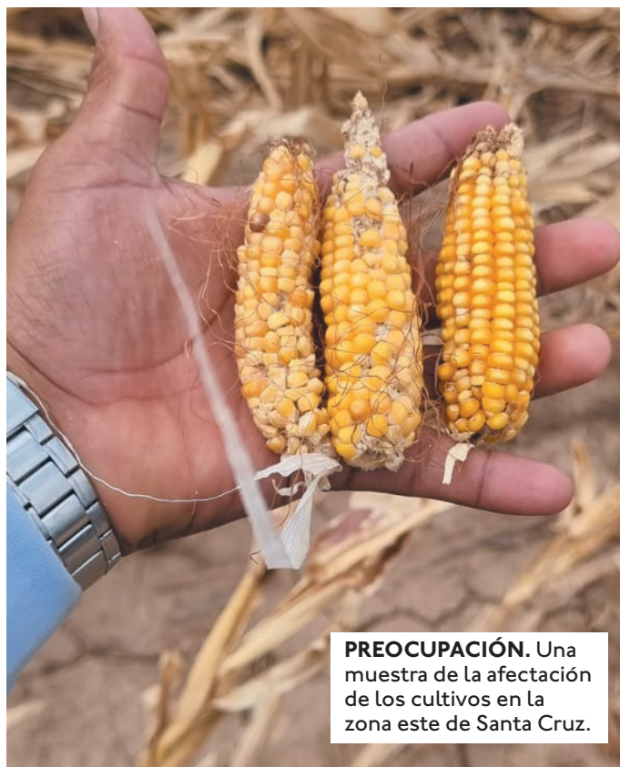
PREOCUPACIÓN. Una muestra de la afectación de los cultivos en la zona este de Santa Cruz.