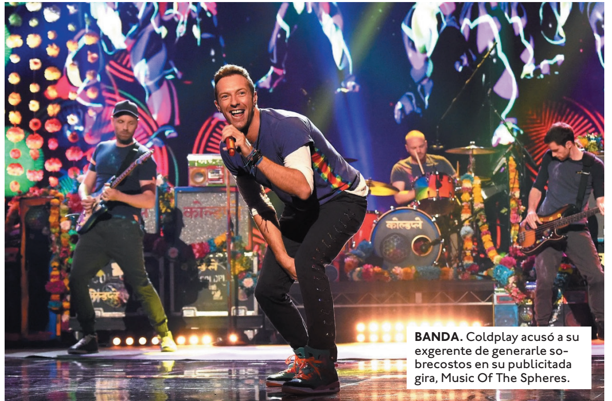
BANDA. Coldplay acusó a su exgerente de generarle sobrecostos en su publicitada gira, Music Of The Spheres .