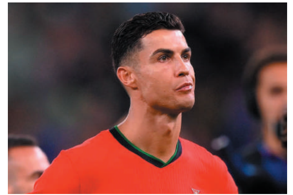
ABATIDO. Cristiano Ronaldo estuvo al borde de las lágrimas tras ser eliminado en su probable última Eurocopa.