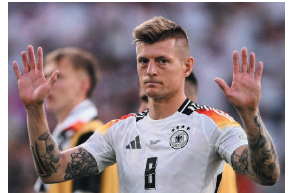
FIN DEL CICLO. Kroos se despidió del fútbol con una derrota ante España. Recibió cariño de compañeros y rivales.