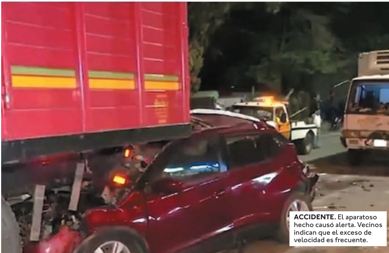
ACCIDENTE. El aparatoso hecho causó alerta. Vecinos indican que el exceso de velocidad es frecuente.

TESTIGOS DEL ACCIDENTE RESCATARON MILAGROSAAMENTE CON VIDA AL CHOFER DEL VEHÍCULO PARTICULAR QUE QUEDÓ ATRAPADO ENTRE DOS CAMIONES.