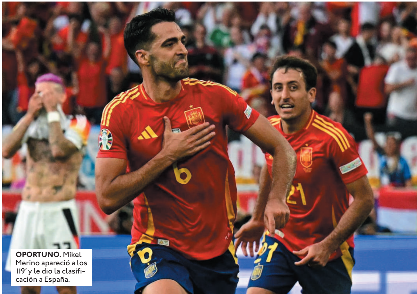
OPORTUNO. Mikel Merino apareció a los 119' y le dio la clasificación a España.