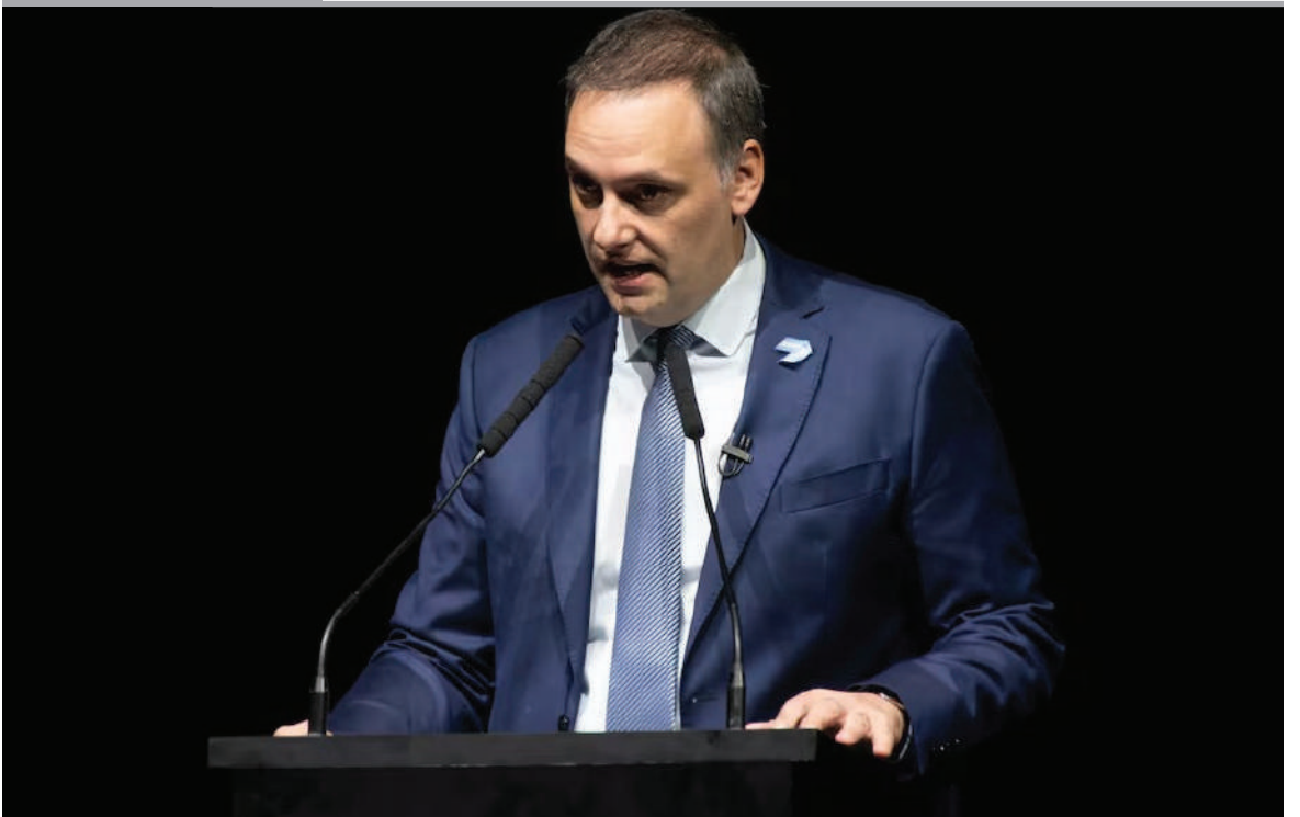
MANUEL ADORNI, EL 'DOMADOR DE PERIODISTAS' DE MILEI. El portavoz presidencial es la cara más mordaz del Gobierno argentino. Sus dardos tienen preferencia por las organizaciones sociales, empleados públicos, feministas y mapuches.