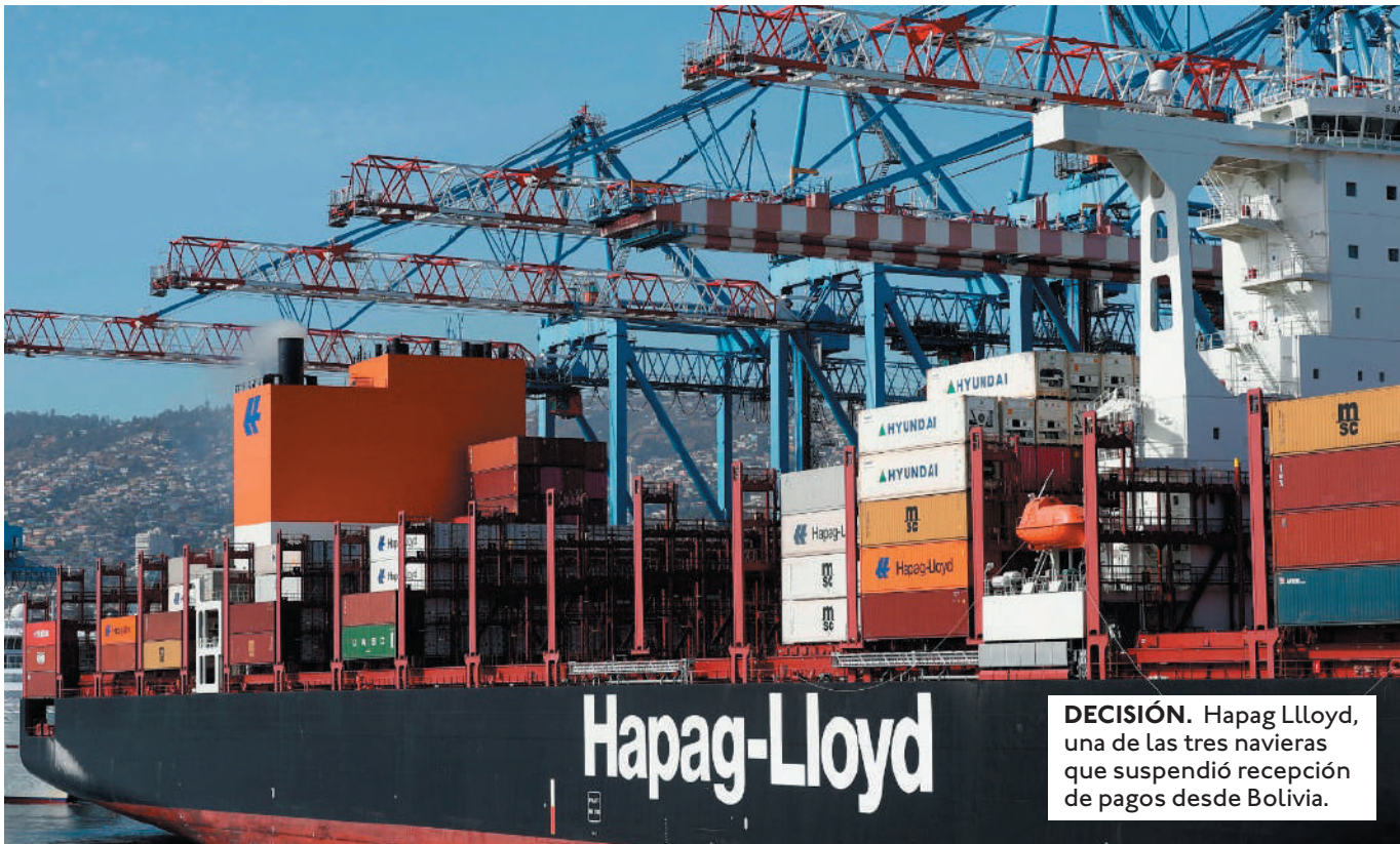
DECISIÓN. Hapag Lloyd, una de las tres navieras que suspendió recepción de pagos desde Bolivia.

LA NAVIERA NORUEGA, LA QUE MÁS CARGA MUEVE A NIVEL MUNDIAL, COMUNICÓ QUE DESDE EL 10 DE JULIO DEJARÁ DE RECIBIR PAGOS DESDE BOLIVIA EN CUATRO SERVICIOS, ENTRE ELLOS LOS FLETES Y DOC FREE.