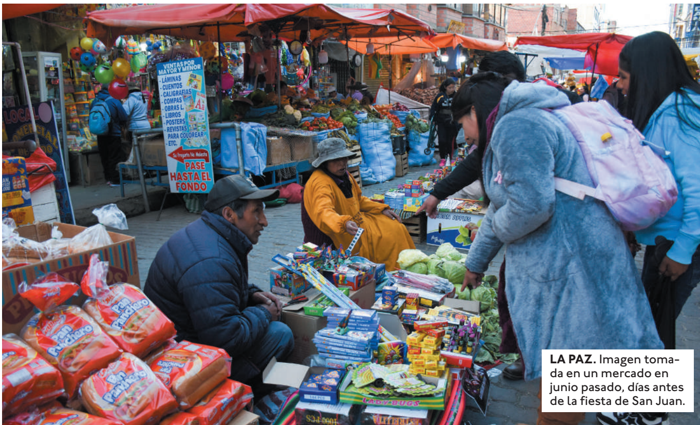
LA PAZ. Imagen tomada en un mercado en junio pasado, días antes de la fiesta de San Juan.

LA INFLACIÓN BAJA HA SIDO RESALTADA POR EL GOBIERNO COMO UNO DE SUS LOGROS, PERO LAS CIFRAS MUESTRAN UN PUNTO DE INFLEXIÓN Y TENDENCIA AL ALZA.