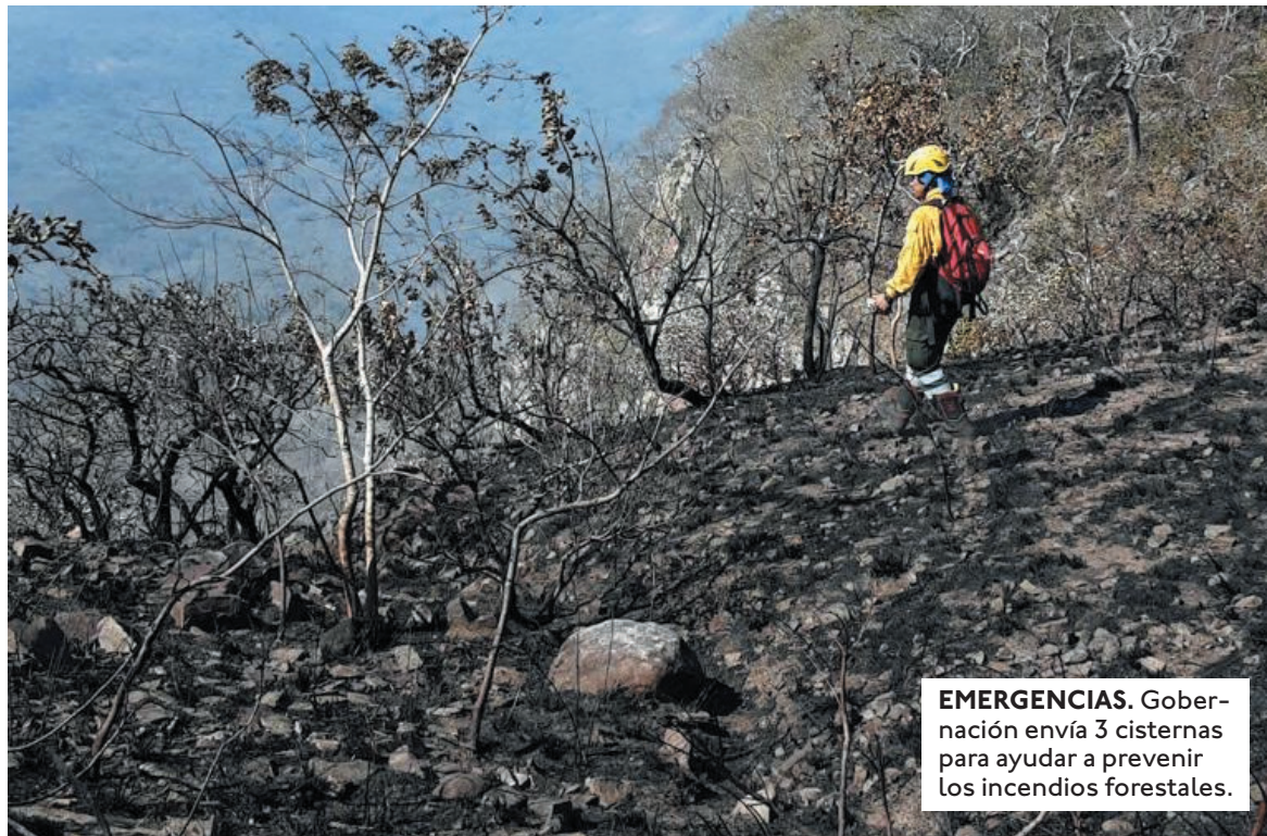
EMERGENCIAS. Gobernación envía 3 cisternas para ayudar a prevenir los incendios forestales.

En la vía administrativa por lo que comunica a Terceros Interesados que conozcan causales con motivos de oposición a la pretensión a presentarla por Escrito ante la Dirección Departamental del SERECI- SAN JULIAN, en Secretaría de Dirección, ubicada en San Julián mercado municipal planta alta, en el plazo de 15 días calendario, a partir de la fecha de la publicación.