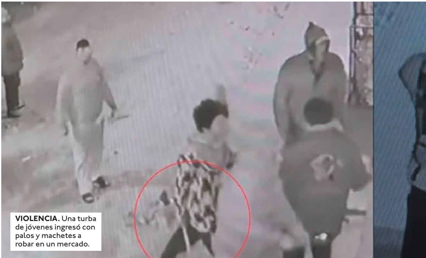
VIOLENCIA. Una turba de jóvenes ingresó con palos y machetes a robar en un mercado.

EL TRABAJADOR DE SEGURIDAD DE DICHO MERCADO QUE INTENTÓ IMPEDIR EL ROBO, PERO FUE AGREDIDO Y ESTÁ HOSPITALIZADO.