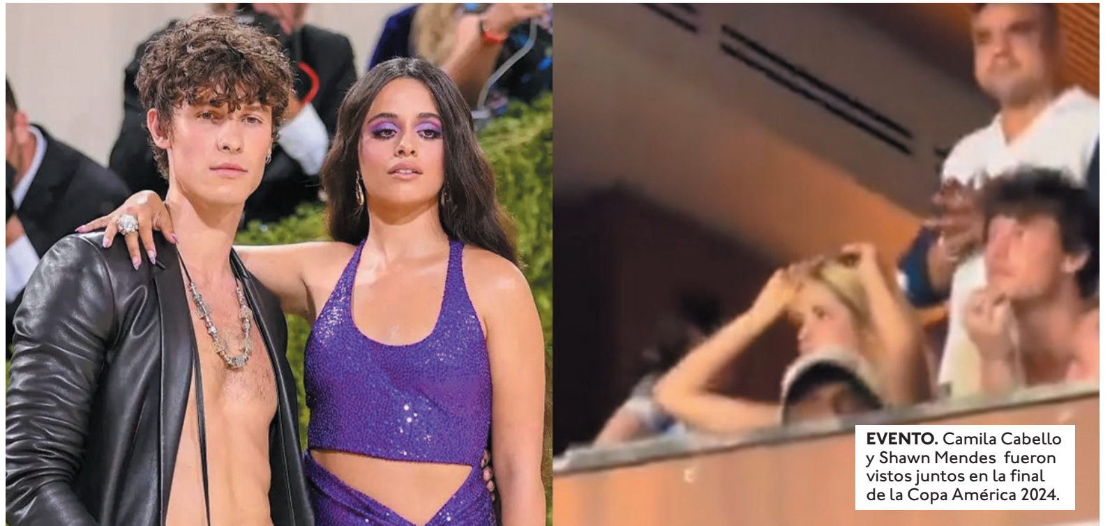
EVENTO. Camila Cabello y Shawn Mendes fueron vistos juntos en la final de la Copa América 2024.

SOSPECHA. Una serie de videos en los que aparecen los cantantes se viralizaron en redes sociales, se sospecha que hubieran retomado su romance.