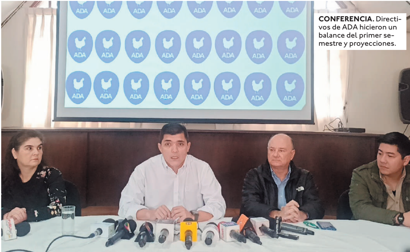
CONFERENCIA. Directivos de ADA hicieron un balance del primer semestre y proyecciones.

EL DEPARTAMENTO TIENE 420 AVÍCOLAS QUE PRODUCEN EL 65% DE LOS POLLOS DE ENGORDE Y EL 52% DE HUEVOS, SEGÚN ADA.