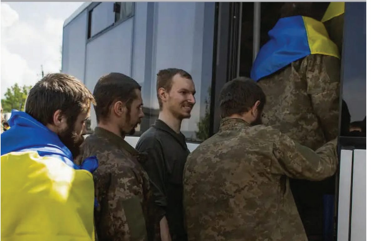
RUSIA Y UCRANIA INTERCAMBIAN 95 PRISIONEROS DE GUERRA. Desde mayo se han realizado al menos una vez al mes este tipo de canjes de soldados.