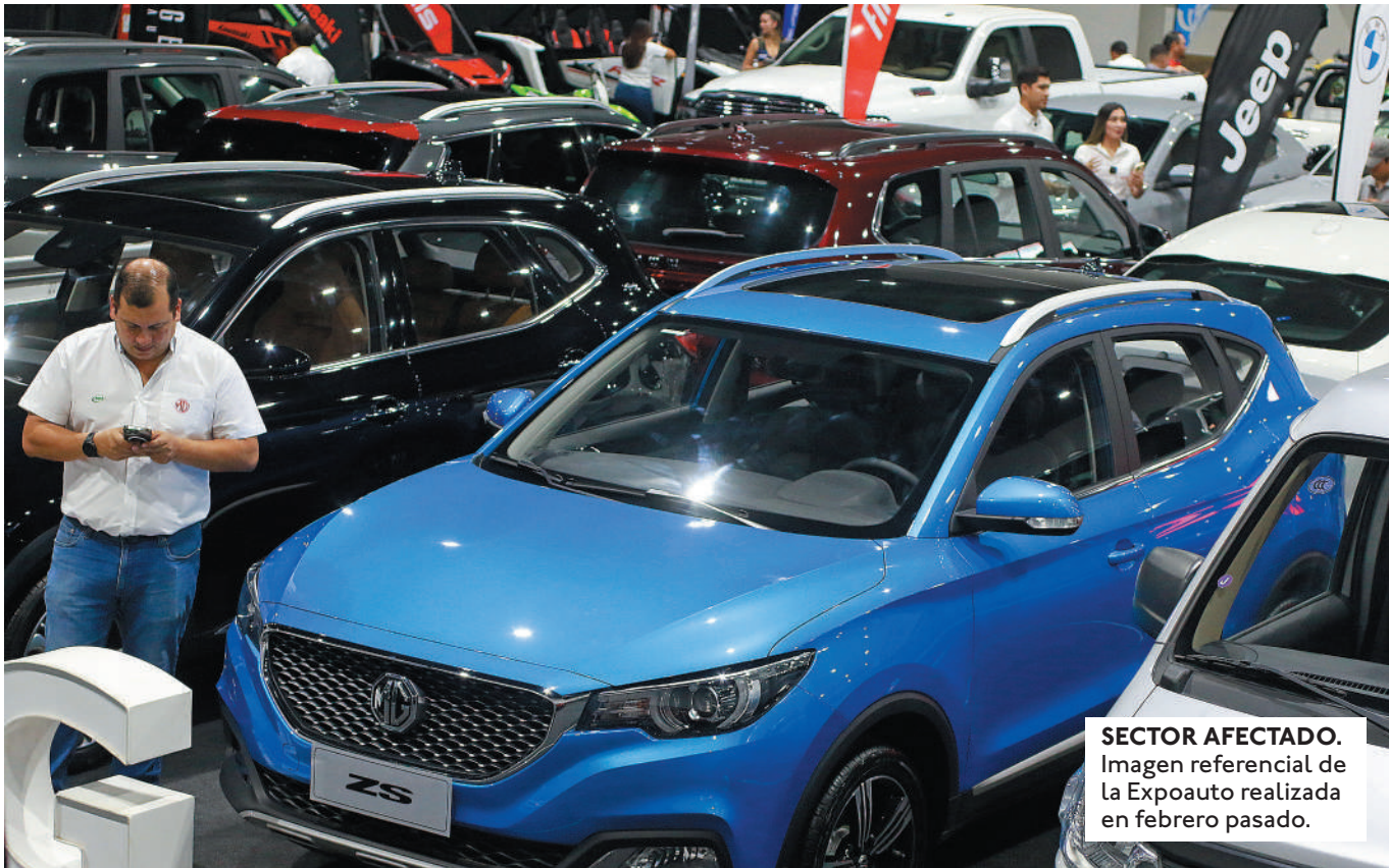
SECTOR AFECTADO. Imagen referencial de la Expoauto realizada en febrero pasado.

PARA LAS AUTOMOTRICES EXPOCRUZ ES UN EVENTO CLAVE PARA ASEGURAR VENTAS, PERO SE PREVE QUE ESTE AÑO TENDRÁN MENOS PRESENCIA QUE EN ANTERIORES VERSIONES.