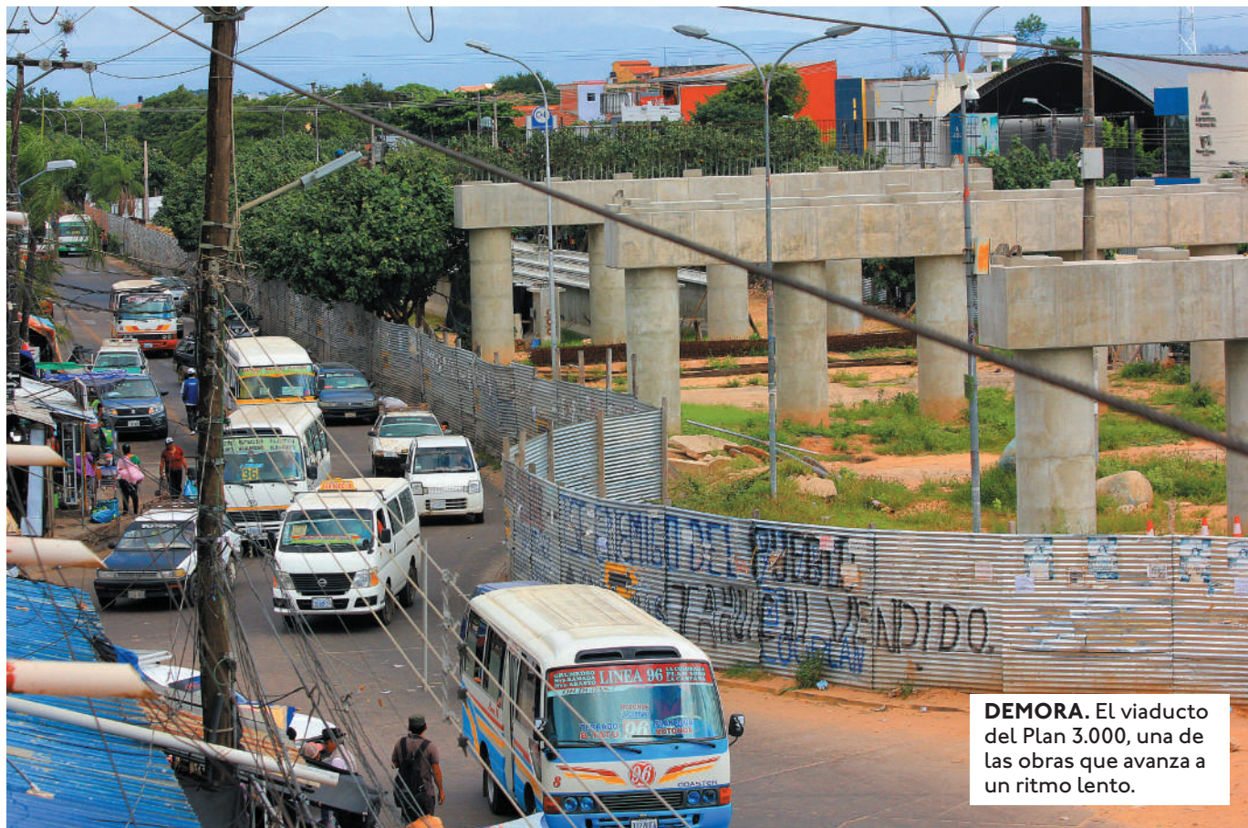
DEMORA. El viaducto del Plan 3.000, una de las obras que avanza a un ritmo lento.

LA CIUDADANÍA CRUCEÑA VIENE RECLAMANDO EL ABANDONO DE OBRAS EN LOS DIFERENTES VIADUCTOS: PLAN 3000 Y LA GUARDIA.