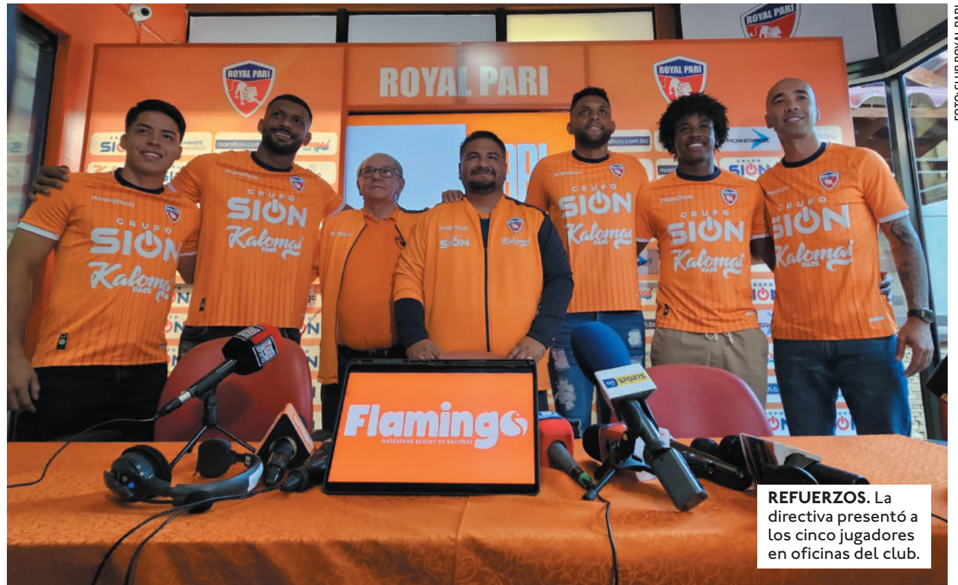
REFUERZOS. La directiva presentó a los cinco jugadores en oficinas del club.

EL MEDIO-CAMPISTA TIENE TODO ENCAMINADO PARA REGRESAR AL ALBO, PESE A QUE DISPUTÓ CON ORIENTE PETROLERO EL DUELO DEL PASADO SÁBADO ANTE SAN ANTONIO EN BULO BULO.