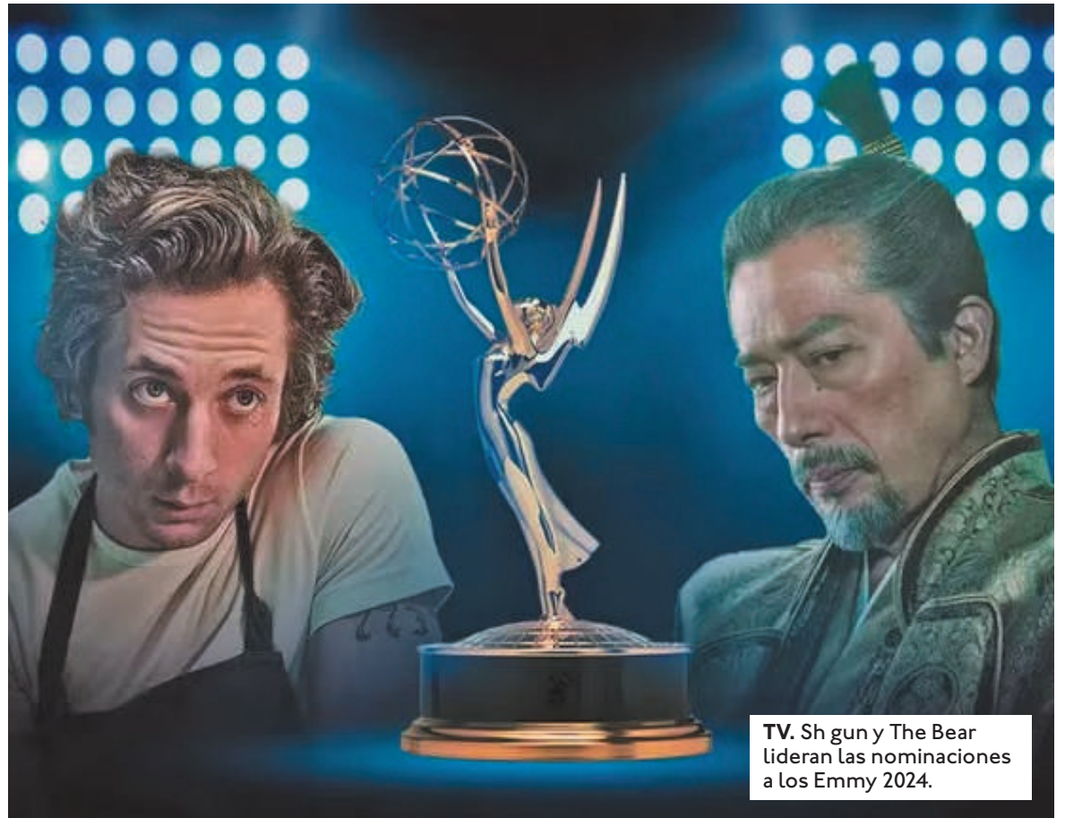
TV. Shogun y The Bear lideran las nominaciones a los Emmy 2024.

impactó al recibir su primera nominación como actriz en los Emmy por la serie Only Murders in the Building. Sus compañeros de elenco Steve Martin, Martin Short, Meryl Streep y Paul Rudd, la acompañarán en la ceremonia luego de que también obtuvieran menciones, trazando un buen camino para el show televisivo en general. Entre las sorpresas no