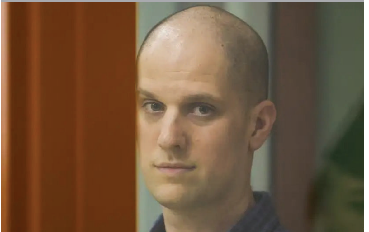
EVAN GERSHKOVICH CONDENADO A 16 AÑOS DE PRISIÓN EN RUSIA. El reportero de Wall Street Journal fue acusado por espiar la industria de armamento ruso, algo que fue desestimado tanto por el periódico como por el gobierno de EE.UU.