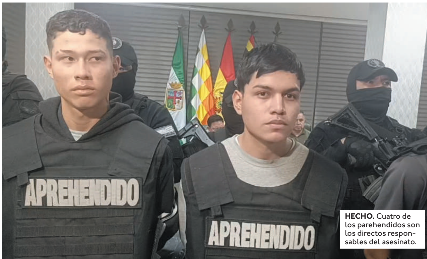
HECHO. Cuatro de los aprehendidos son los directos responsables del asesinato.