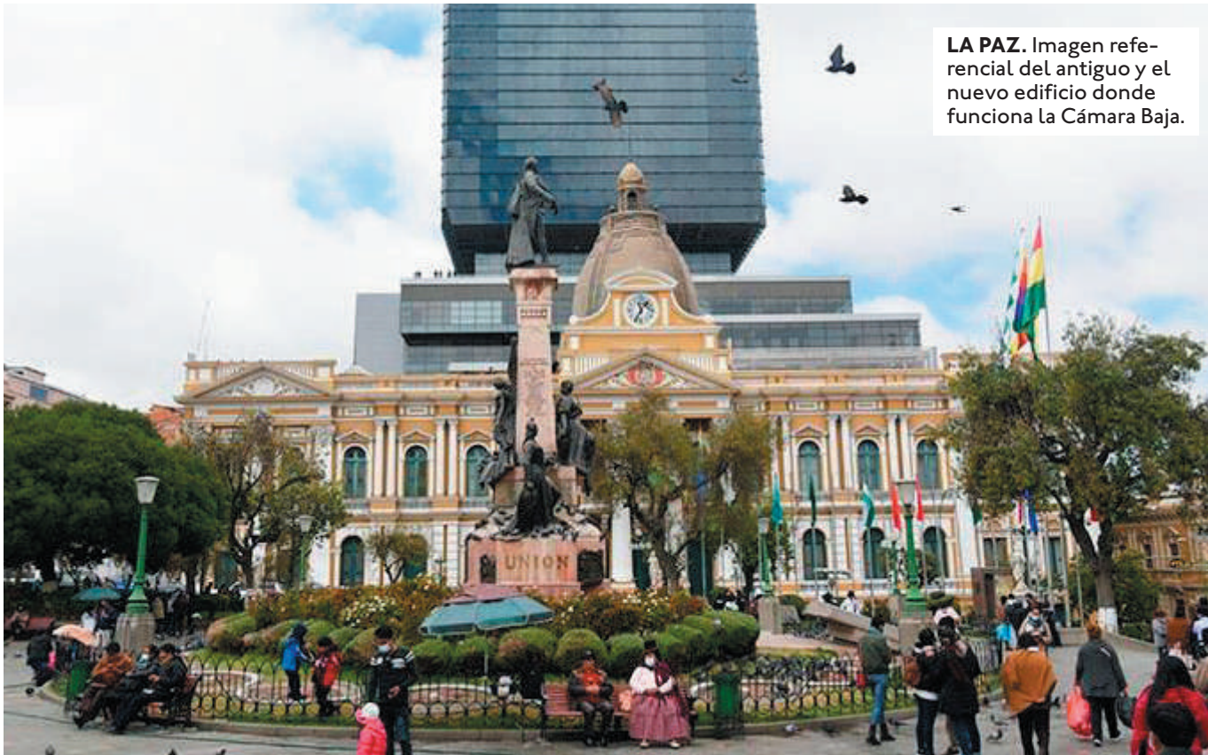
LA PAZ. Imagen referencial del antiguo y el nuevo edificio donde funciona la Cámara Baja.

TRAS ESTALLAR EL ANTERIOR CASO DE CORRUPCIÓN, ISRAEL HUAYTARI REMARCÓ QUE LOS DELITOS SON PERSONALES Y NO IMPLICAN A LA INSTITUCIÓN. OPOSITORES LO CUESTIONAN POR INACCIÓN DE LA CÁMARA BAJA, QUE SESIONA POCO.