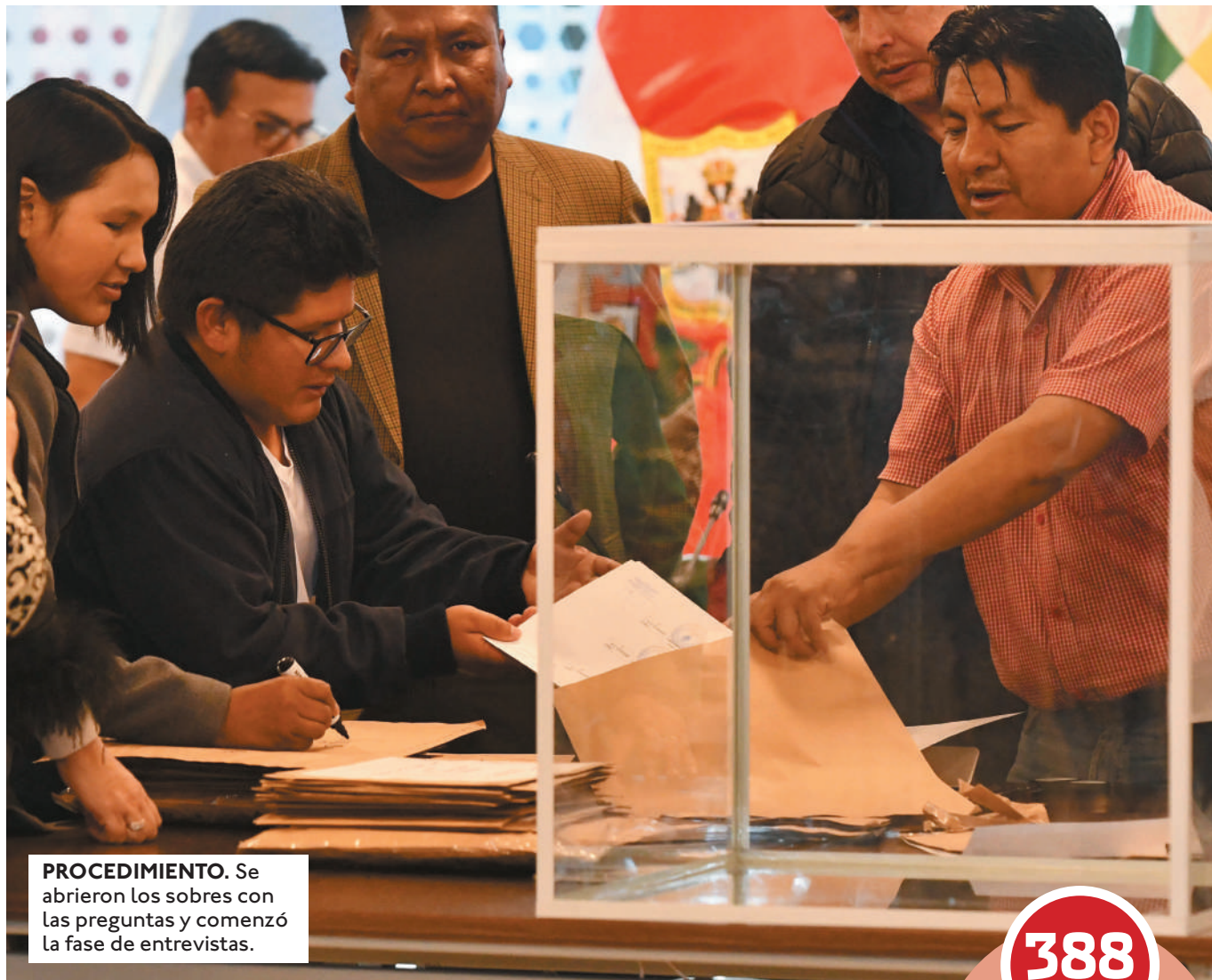
PROCEDIMIENTO. Se abrieron los sobres con las preguntas y comenzó la fase de entrevistas.

Se bajan. Al menos una decena ha retirado su candidatura para el Tribunal Constitucional Plurinacional (TCP) y el Tribunal Supre-