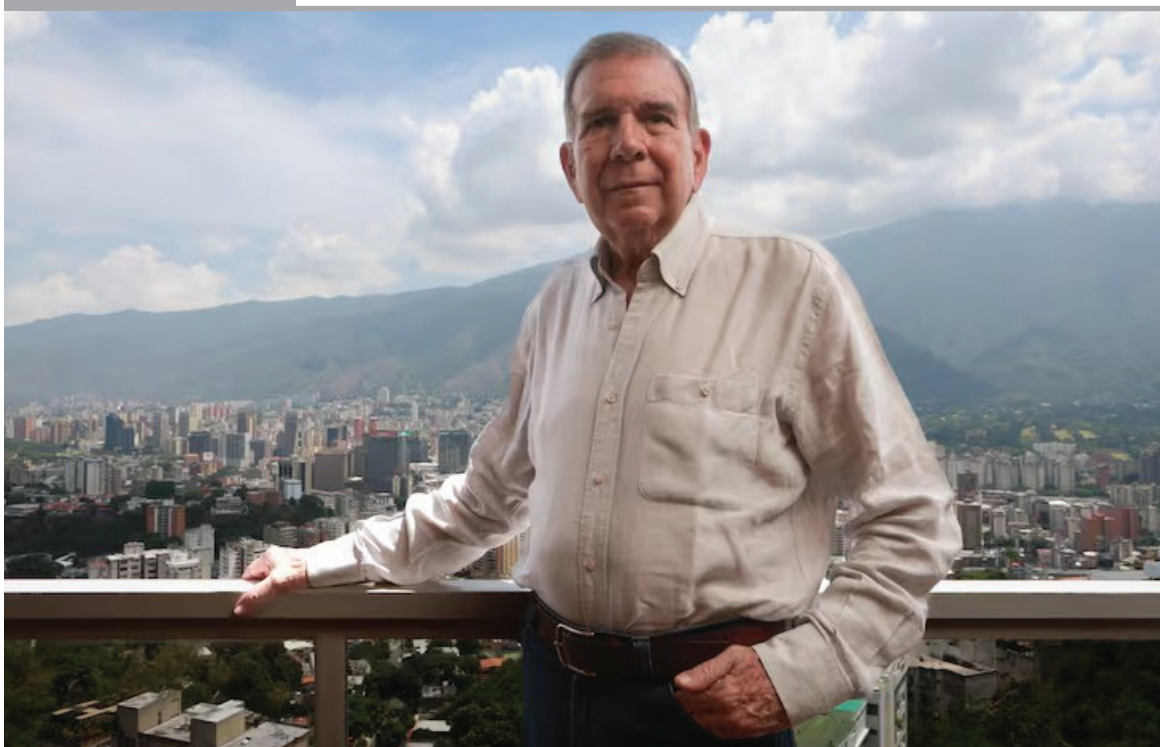
EDMUNDO GONZÁLEZ: "NUESTRA VICTORIA OBLIGARÁ AL GOBIERNO A NEGOCIAR". El candidato de la oposición venezolana se muestra seguro de su ventaja, pero duda de la conducta del presidente Maduro en caso de que pierda el chavismo