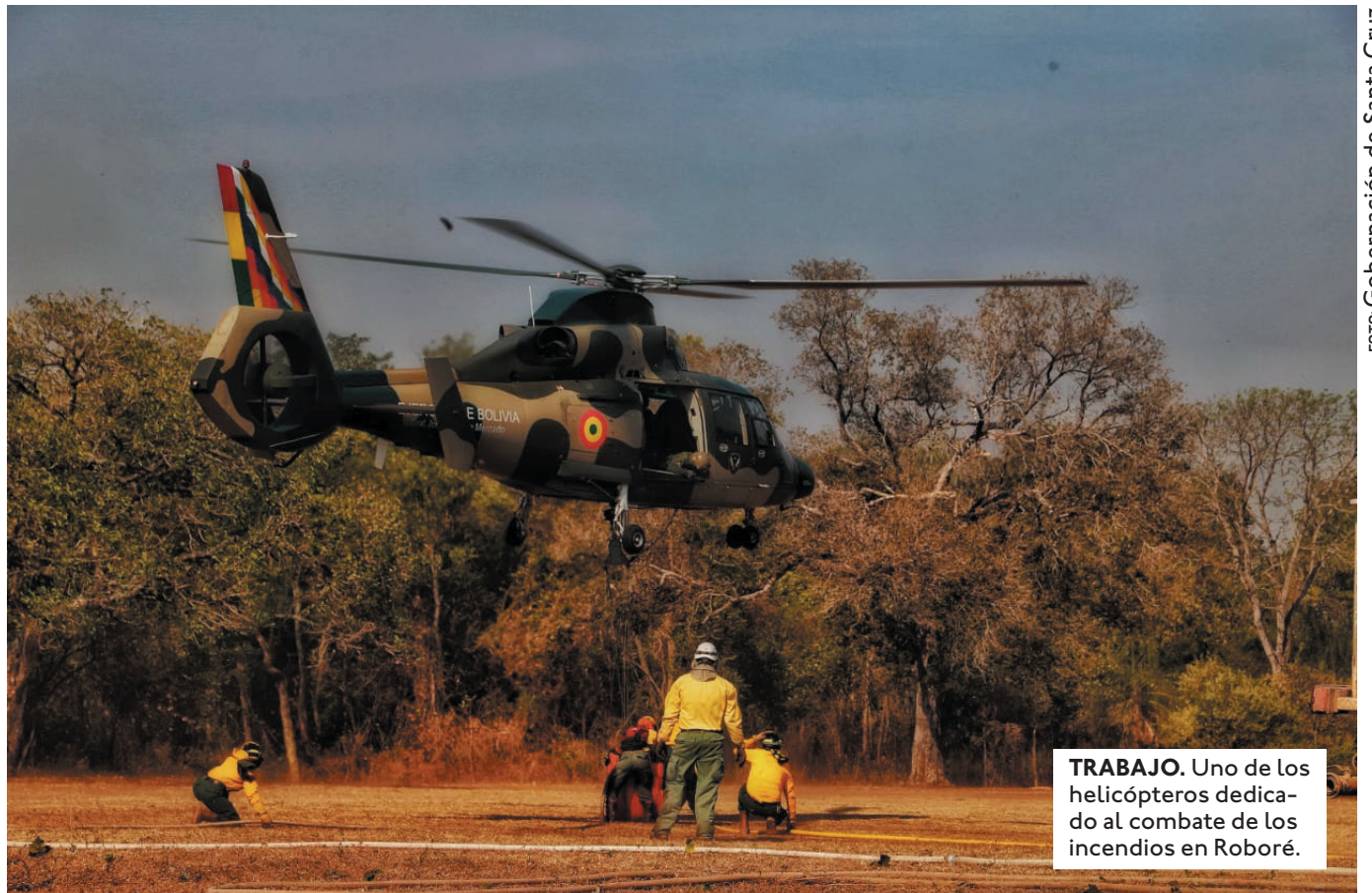
TRABAJO. Uno de los helicópteros dedicado al combate de los incendios en Roboré.