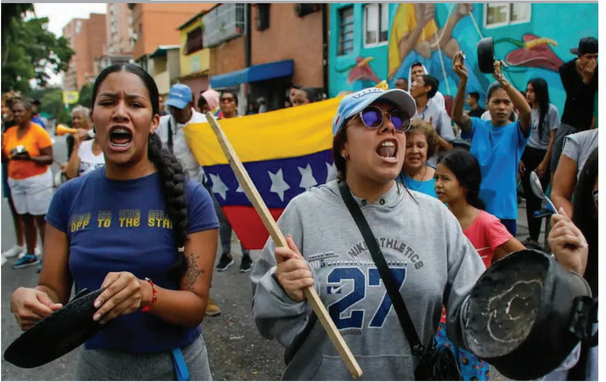
ESTALLAN PROTESTAS CONTRA LA REELECCIÓN DE NICOLÁS MADURO. Miles de personas iniciaron las protestas este lunes en barrios populares de Caracas contra la reelección del presidente venezolano Nicolás Maduro, según constataron periodistas de varias agencias y medios.