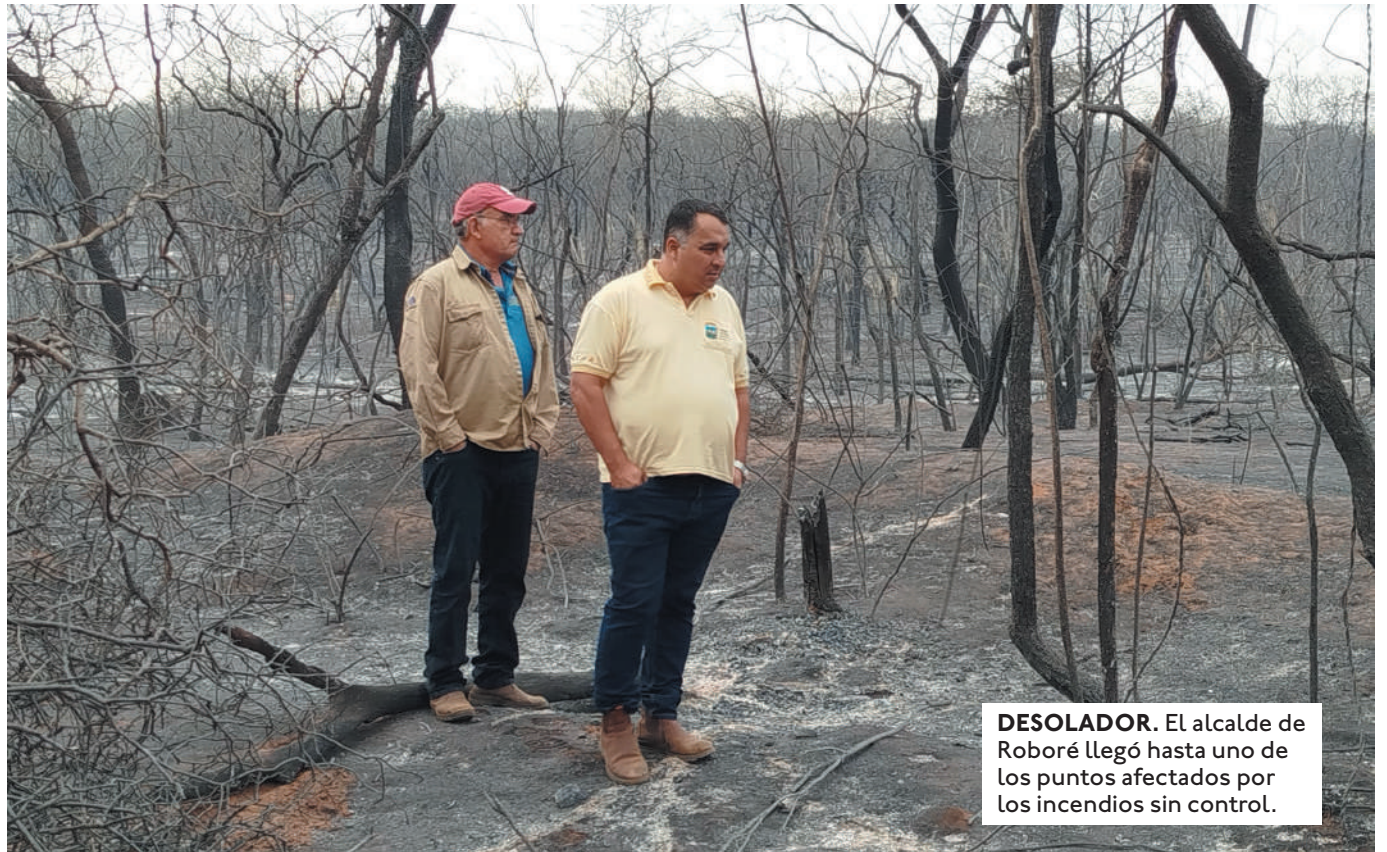
DESOLADOR. El alcalde de Roboré llegó hasta uno de los puntos afectados por los incendios sin control.