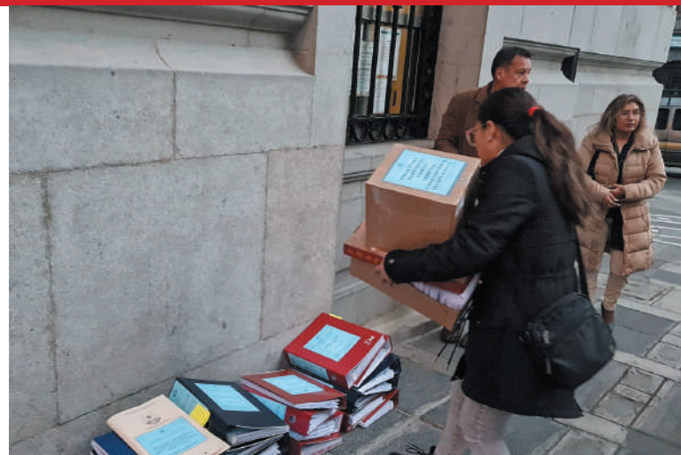
TRABAJO. Personal del Senado entregó los informes a la ALP.

mujeres) y los 14 para el Tribunal Agroambiental (7 varones y 7 mujeres). También está agendado el tratamiento del informe final de evaluación para el Tribunal Supremo de Justicia, que estuvo a cargo de la Comisión Mixta de Constitución. Se preseleccionó a 69 aspirantes. Para la aprobación de los informes se requiere el "voto de dos tercios del total" de los asambleístas presentes. / ABI