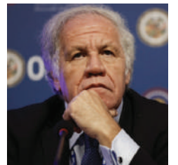
Luis Almagro SECRETARIO GENERAL DE LA OEA

La Organización de Estados Americanos (OEA) informó que los resultados manejados por el Consejo Nacional Electoral (CNE) de Venezuela que dan como ganador de la elección del domingo al presidente Nicolás Maduro "no merecen confianza ni deberían recibir reconocimiento democrático".