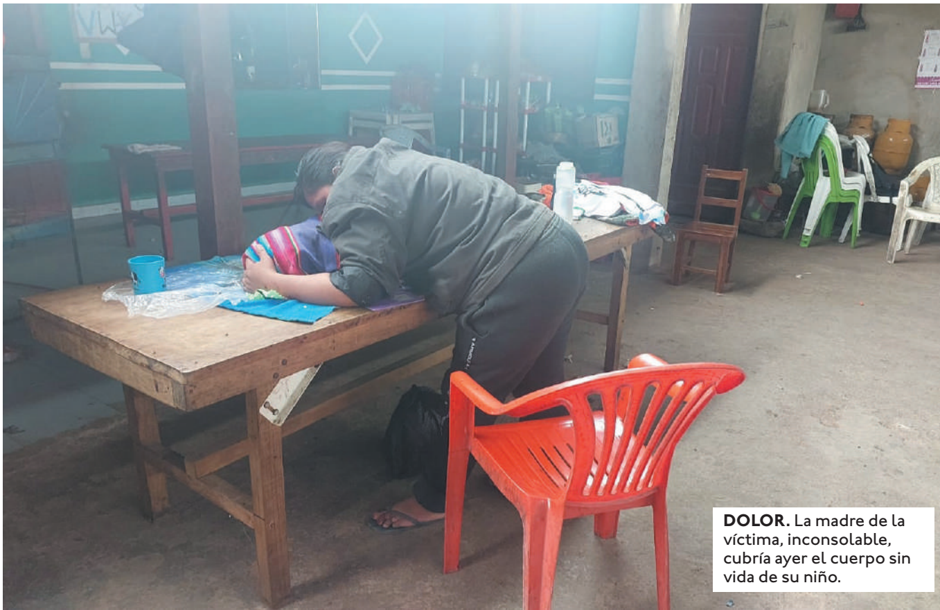
DOLOR. La madre de la víctima, inconsolable, cubría ayer el cuerpo sin vida de su niño.

POR HOMICIDIO EN ACCIDENTE DE TRÁNSITO SERÁ IMPUTADO EL PRESUNTO POLICÍA QUE ATROPELLÓ Y MATÓ AL MENOR.