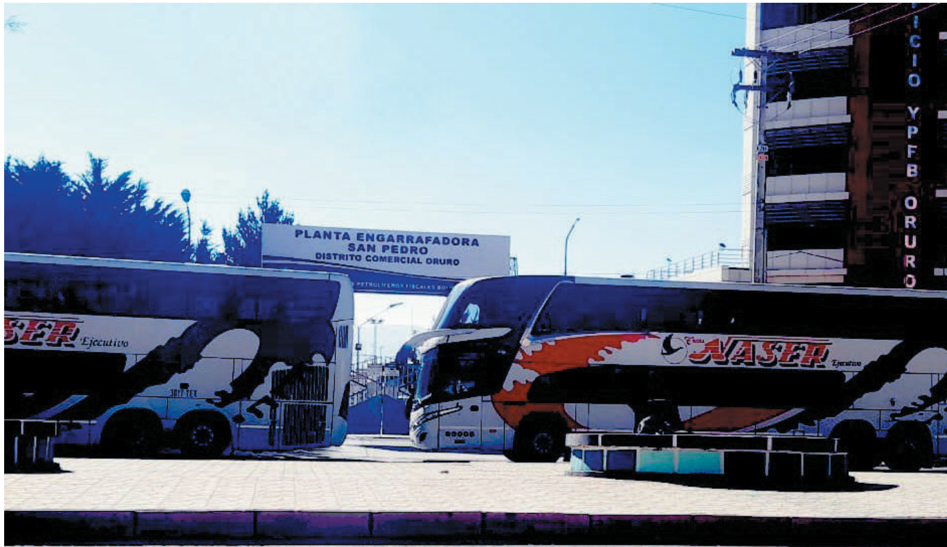
ORURO. Uno de los bloqueos se instaló en el distrito comercial de YPFB en esa ciudad.

LOS BLOQUEOS PERJUDICARON AYER EL PASO DE 17 CISTERNAS EN ORURO. POR OTRO BLOQUEO EN SAN JULIÁN QUEDARON 15 CISTERNAS VARADAS.