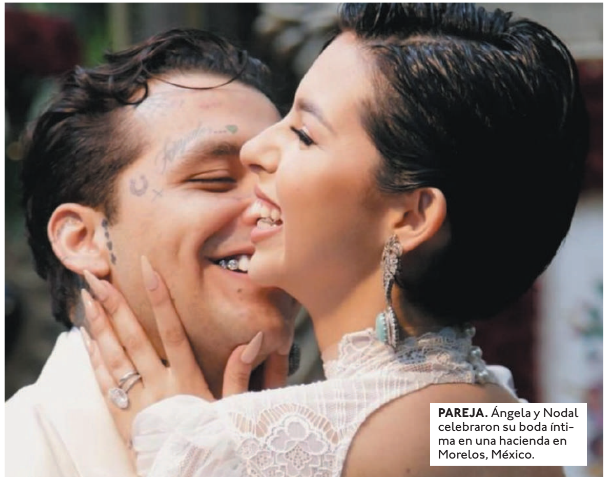
PAREJA. Ángela y Nodal celebraron su boda íntima en una hacienda en Morelos, México.

Tras la inesperada boda, los recién casados han compartido fotos de sus últimos días, incluyendo una