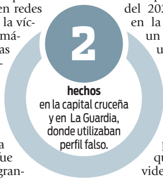
2 hechos en la capital cruceña y en La Guardia, donde utilizaban perfil falso.

En fecha 31 de julio del 2024, en audiencia de medidas cautelares se emitió mandamiento de Detención Preventiva por 180 días en el Centro de Rehabilitación Palmasola.