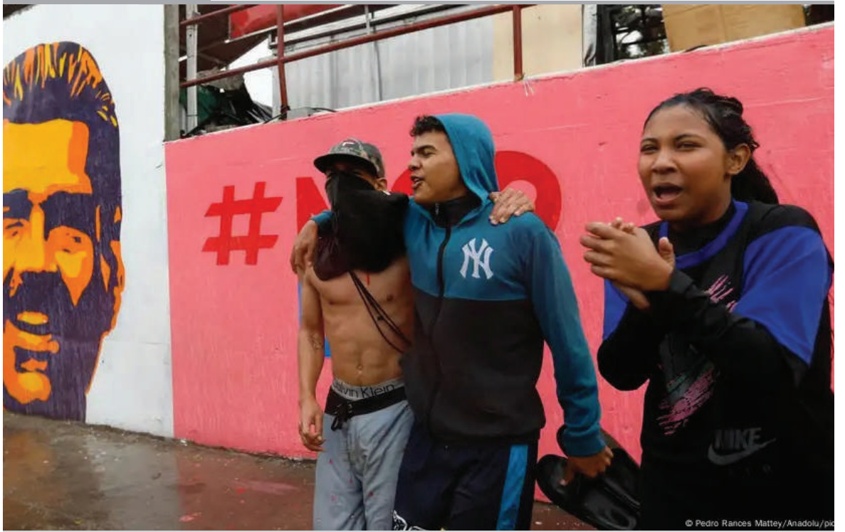
LA CRECIENTE ORFANDAD DE MADURO EN AMÉRICA LATINA. La pugna en torno a las elecciones venezolanas está llevando a los gobiernos latinoamericanos a decantarse. Y en la balanza están los principios democráticos, más que las parcelas ideológicas.