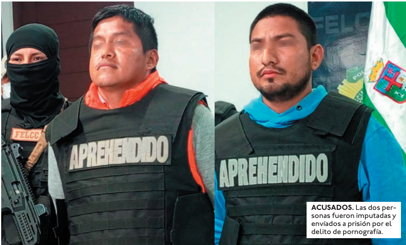
ACUSADOS. Las dos personas fueron imputadas y enviados a prisión por el delito de pornografía.

UNO DE LOS APREHENDIDOS TRABAJABA EN UNA FARMACIA, DESDE DONDE REALIZABA LAS LLAMADAS A SUS VÍCTIMAS Y LAS AMENAZABA.