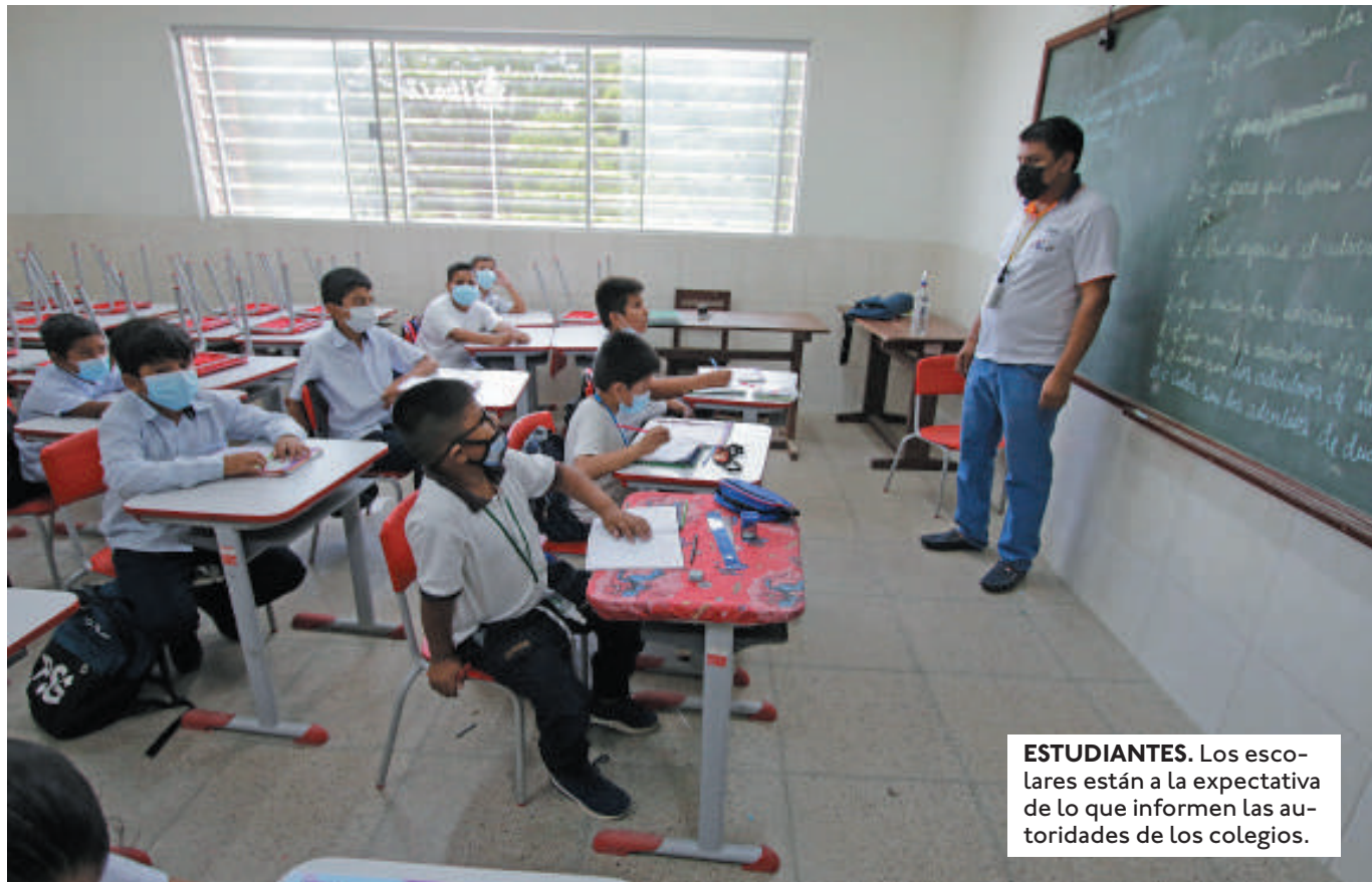
ESTUDIANTES. Los escolares están a la expectativa de lo que informen las autoridades de los colegios.

OSMAR CABRERA, ASEGURÓ QUE PASARÁN CLASES VIRTUALES DEBIDO A QUE NO HABRÁ TRANSPORTE PÚBLICO ESTE JUEVES.