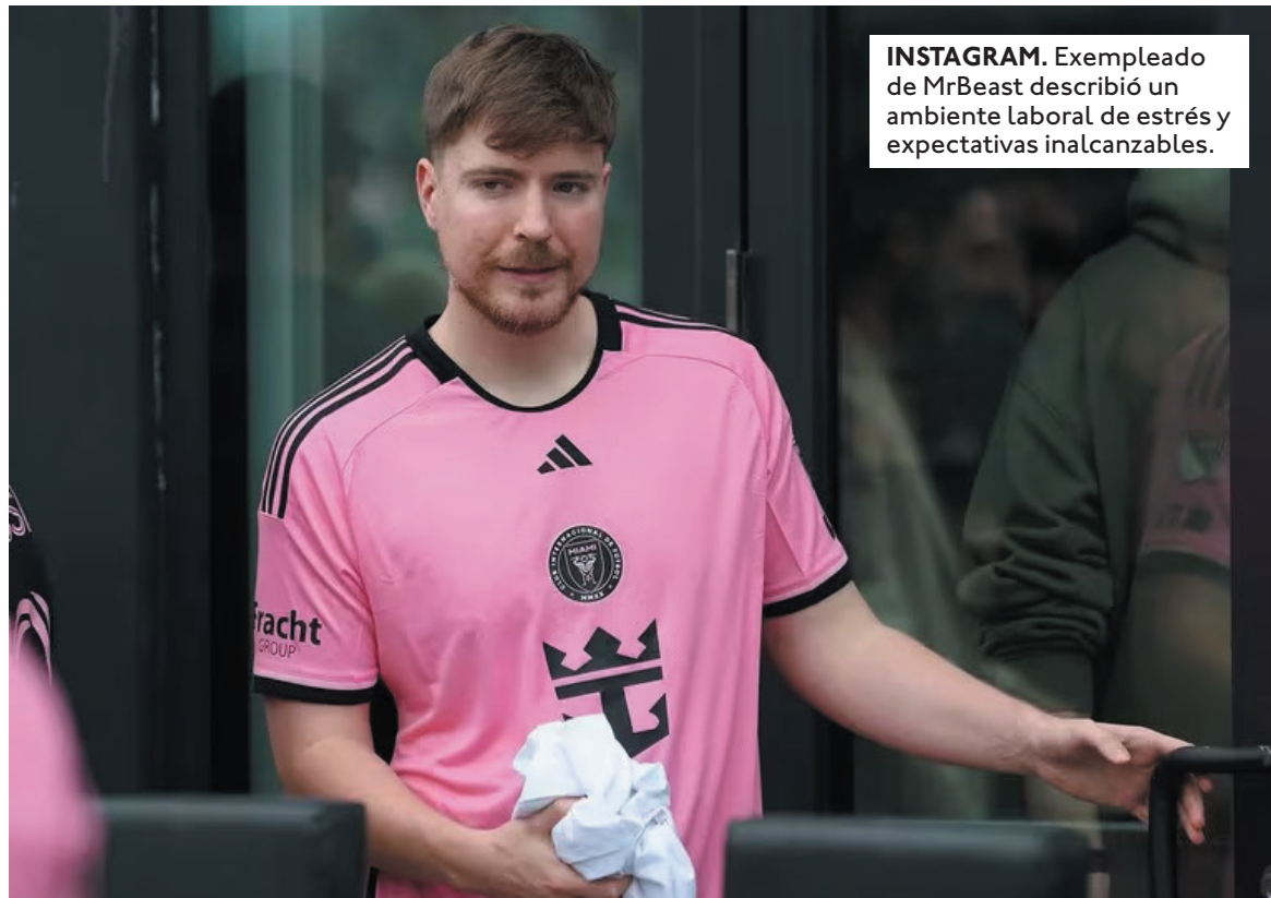
INSTAGRAM. Exempleado de MrBeast describió un ambiente laboral de estrés y expectativas inalcanzables.

Uno de los puntos más inquietantes de su denuncia fue la acusación de que la filantropía de MrBeast no es más que un mecanismo de lavado de dinero. En palabras de Weddle: "Su filantropía no sirve