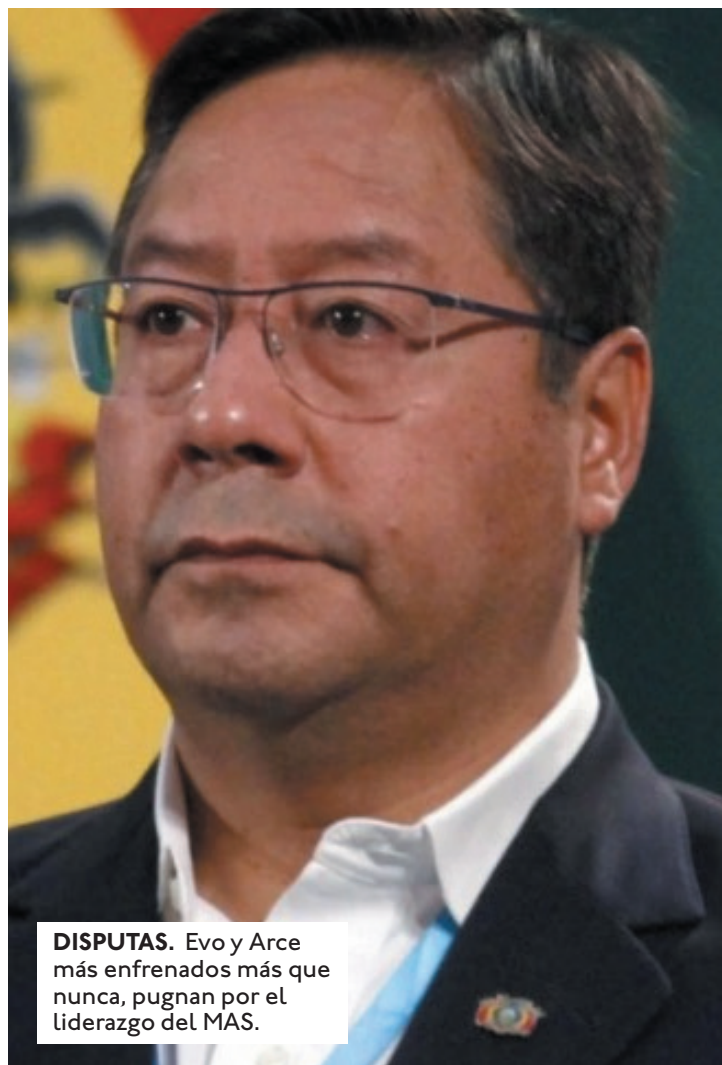
DISPUTAS. Evo y Arce más enfrenados más que nunca, pugnan por el liderazgo del MAS.

El expresidente del Estado, Evo Morales Ayma, en un mensaje público, recordó que la lucha y resistencia de las naciones indígena originario y campesinas "siempre fue contra los opresores y traidores". Y fustigó al presidente Luis Arce Catacora acusándolo de traicionar y darle la espalda al MAS IPSP, pese a que fue favorecido como candidato y luego elegido presidente del Estado Plurinacional