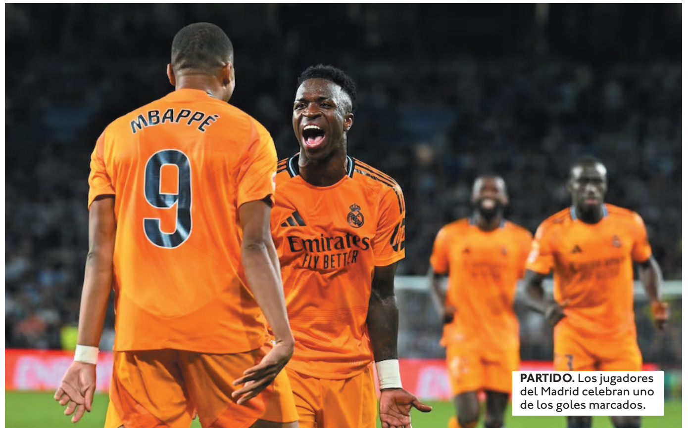
PARTIDO. Los jugadores del Madrid celebran uno de los goles marcados.

DURANTE EL PARTIDO EL CONJUNTO 'MERENGUE' SE SALVÓ EN TRES OCASIONES POR LOS POSTES.