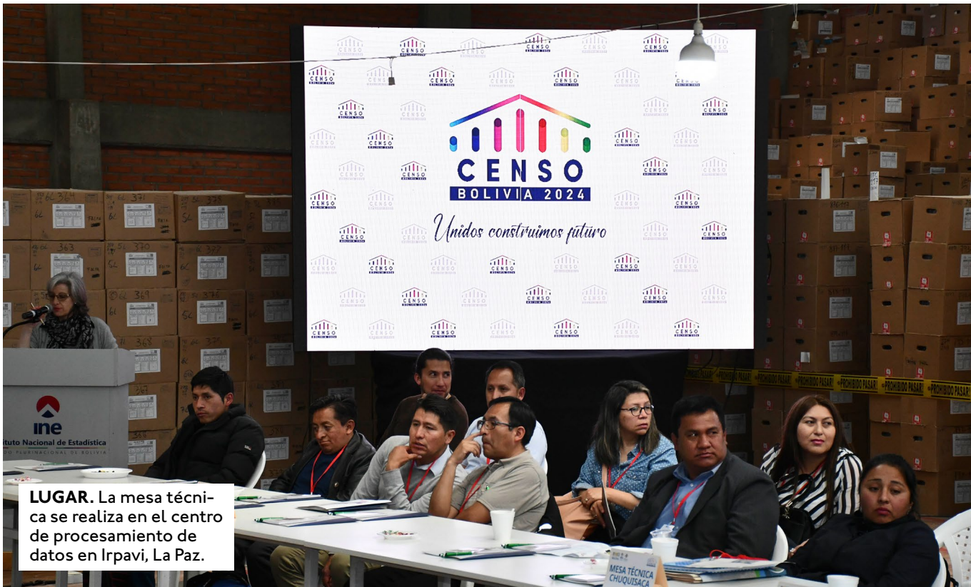
LUGAR. La mesa técnica se realiza en el centro de procesamiento de datos en Irpavi, La Paz.

ALCALDÍAS DE LA PAZ, COCHABAMBA, SANTA CRUZ Y EL ALTO HAN SEÑALADO QUE LOS DATOS DEL CENSO NO COINCIDEN CON PROYECCIONES PROPIAS EN BASE A INCREMENTO DE MANZANOS, NACIMIENTOS Y DEFUNCIONES REGISTRADAS.