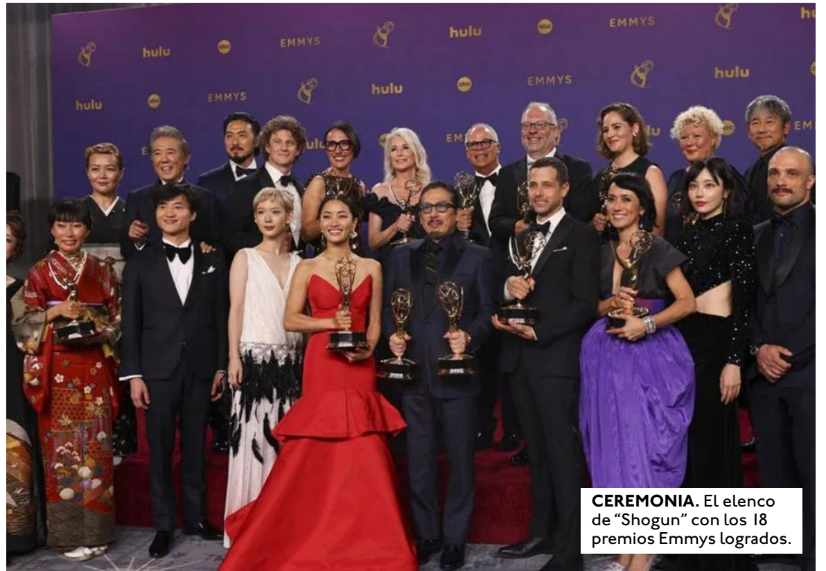
CEREMONIA. El elenco de "Shogun" con los 18 premios Emmys logrados.

«"Shogun" es un programa sobre la traducción, no sobre lo que se pierde, sino sobre lo que se encuentra, cuando haces reuniones