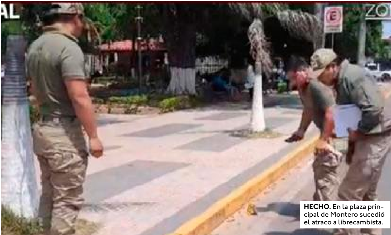
HECHO. En la plaza principal de Montero sucedió el atraco a librecambista.

LOS DELINCUENTES SE HICIERON PASAR POR CLIENTES, SE ACERCARON AL CAMBISTA Y LE DISPARARON PARA ESCAPAR CON SU CARTERA.