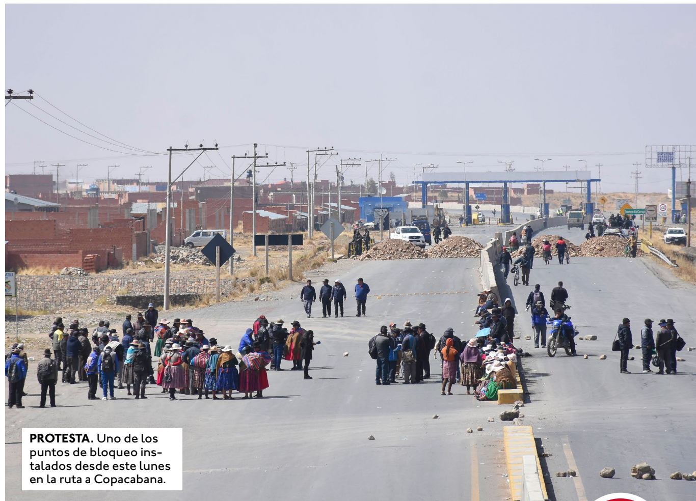
PROTESTA. Uno de los puntos de bloqueo instalados desde este lunes en la ruta a Copacabana.

Escalada verbal. "Si quiere, señor presidente del Estado, venga a detenernos en persona, no te tenemos ningún miedo", retó el senador Leonardo Loza, en respuesta al mensaje emitido el domingo por el presidente Luis Arce en el que sindicó a Morales de querer incendiar el país y la democracia. Loza que la marcha no es por una persona ni por una candidatura. "El presidente (Luis) Arce no solo está desesperado, sino también