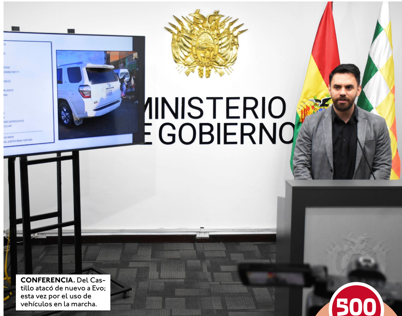
CONFERENCIA. Del Castillo atacó de nuevo a Evo; esta vez por el uso de vehículos en la marcha.