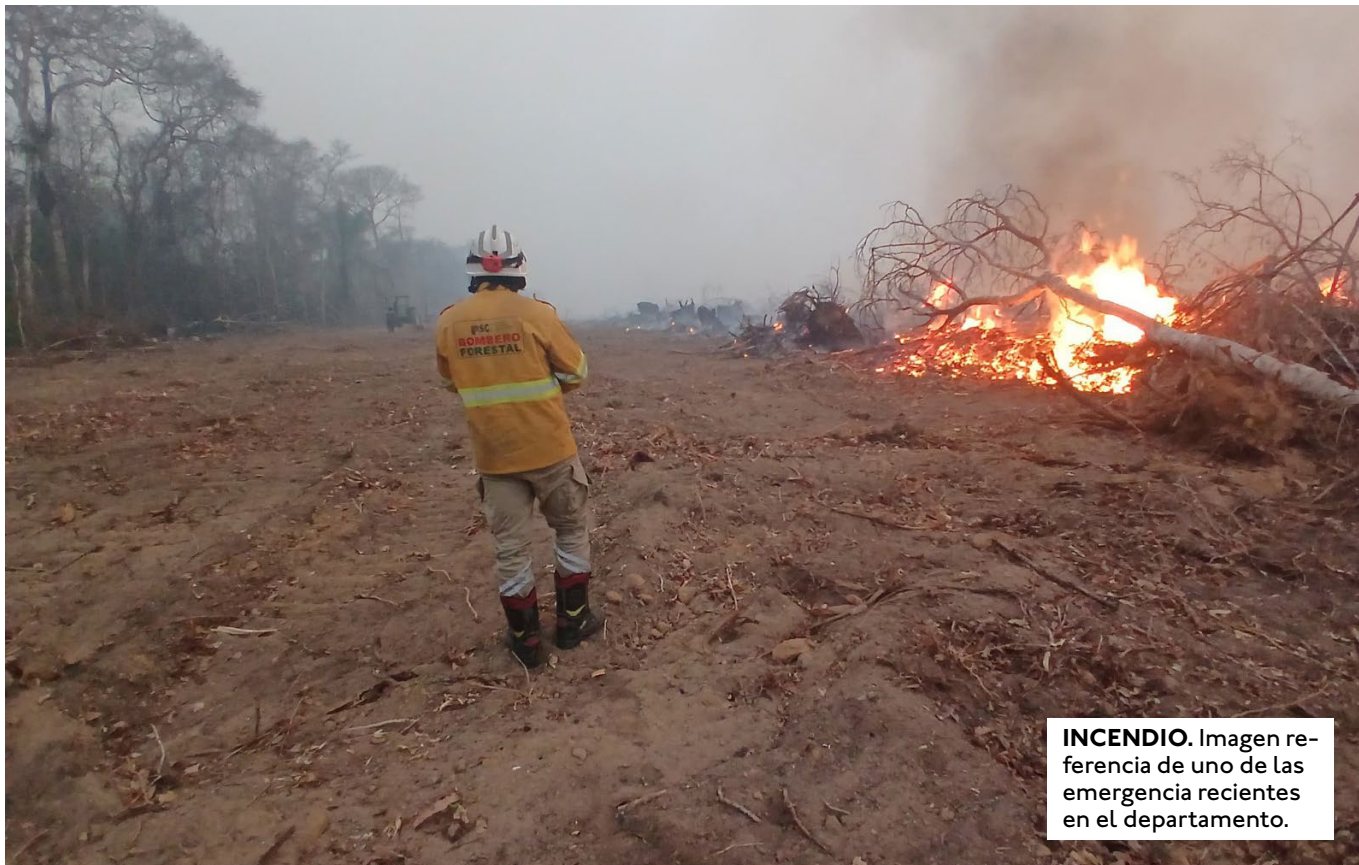
INCENDIO. Imagen referencia de uno de las emergencia recientes en el departamento.

EL ICA EN LA CIUDAD HA ALCANZADO UN ÍNDICE DE 172, EN LA CATEGORÍA "MUY MALO", LA HUMAREDA NUEVAMENTE SE SIENTE EN LA CAPITAL CRUCEÑA.