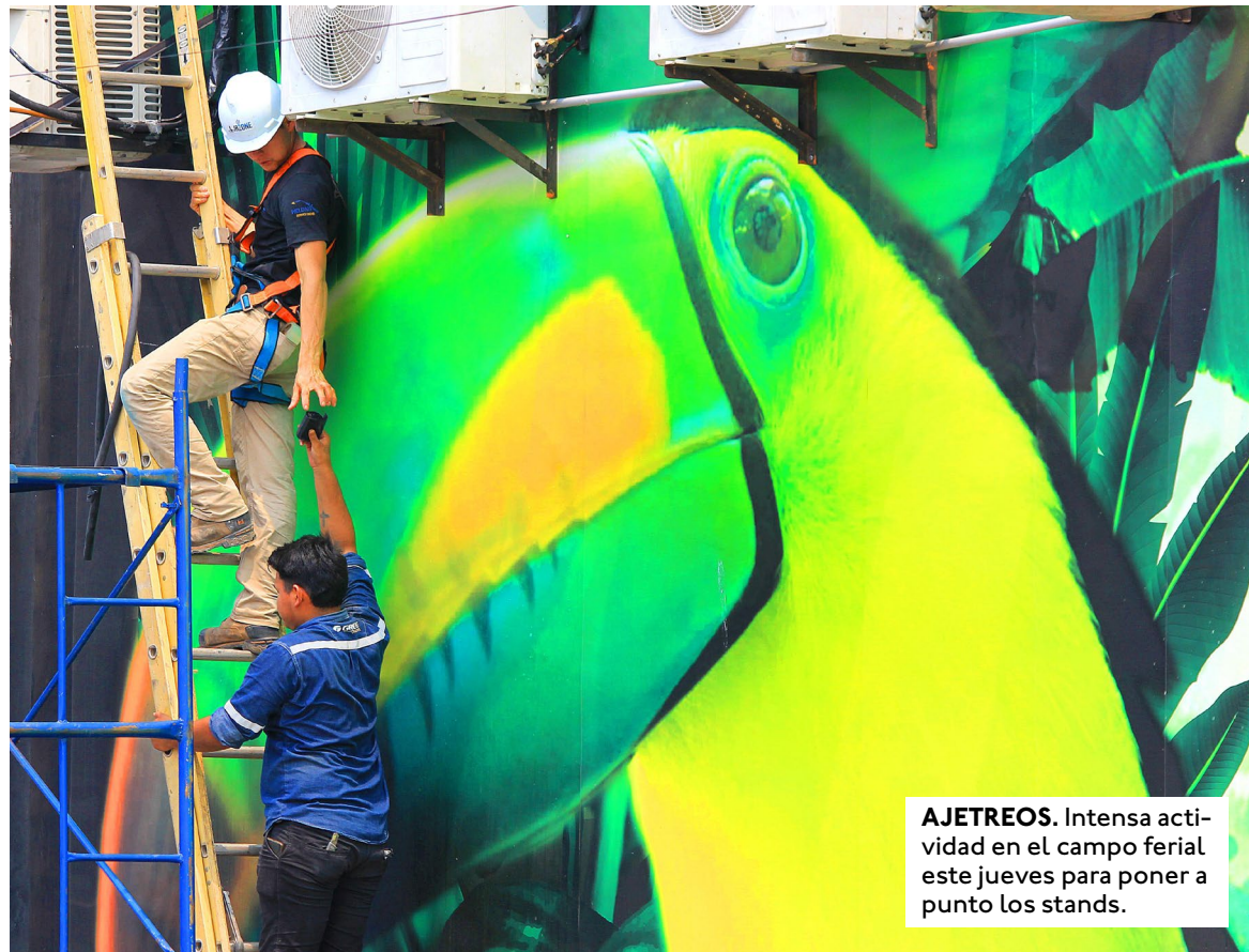
AJETREOS. Intensa actividad en el campo ferial este jueves para poner a punto los stands.

Sectores fuertes. Uno de los rubros más importantes, año tras año, es el pecuario. En esta ocasión hay unos 1.000 ejemplares en exhibición, 700 de ellos de razas cebuinas. Las actividades arrancaron desde la anterior semana y ya se conoció al toro más pesado, Pradesh FIV, con 1.180 kilos y la vaca más lechera, Catalina FIV, que impuso una nueva