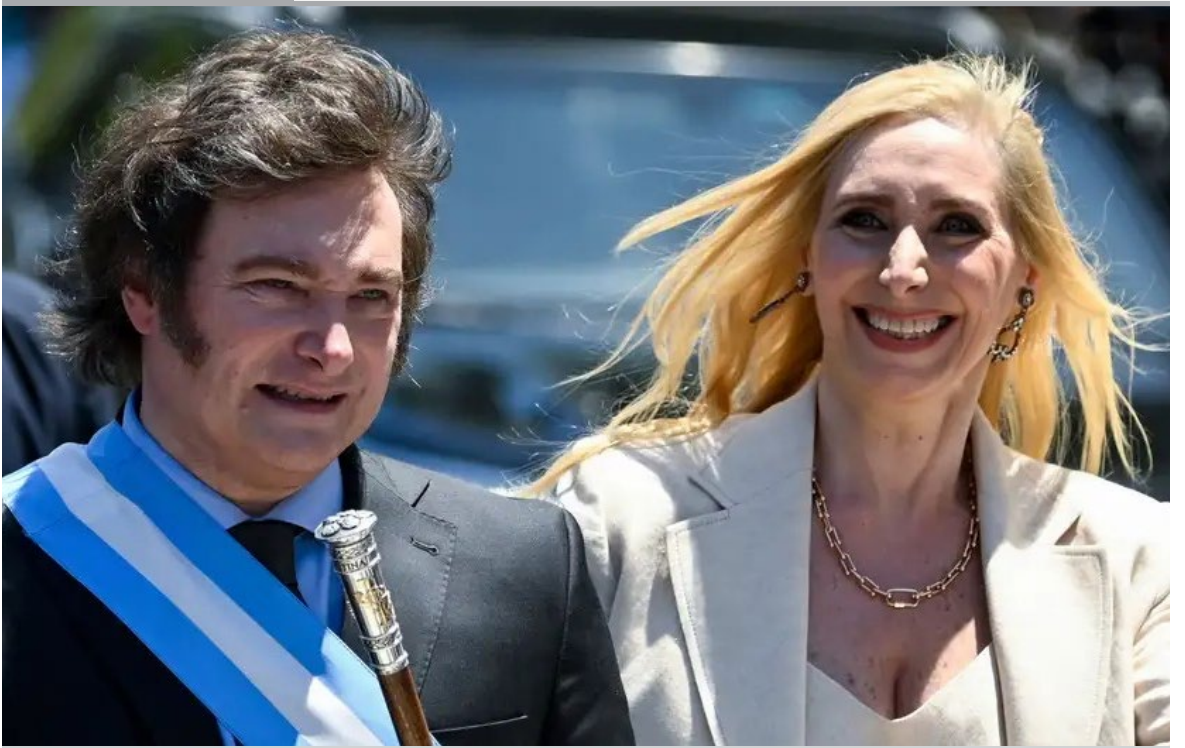
VENEZUELA TRAMITA UNA ORDEN DE CAPTURA CONTRA JAVIER MILEI. El fiscal general venezolano, Tarek William Saab dijo que tramitan una orden de aprehensión contra el presidente de Argentina, su hermana, Karina Milei, y contra la ministra de Seguridad, Patricia Bullrich.