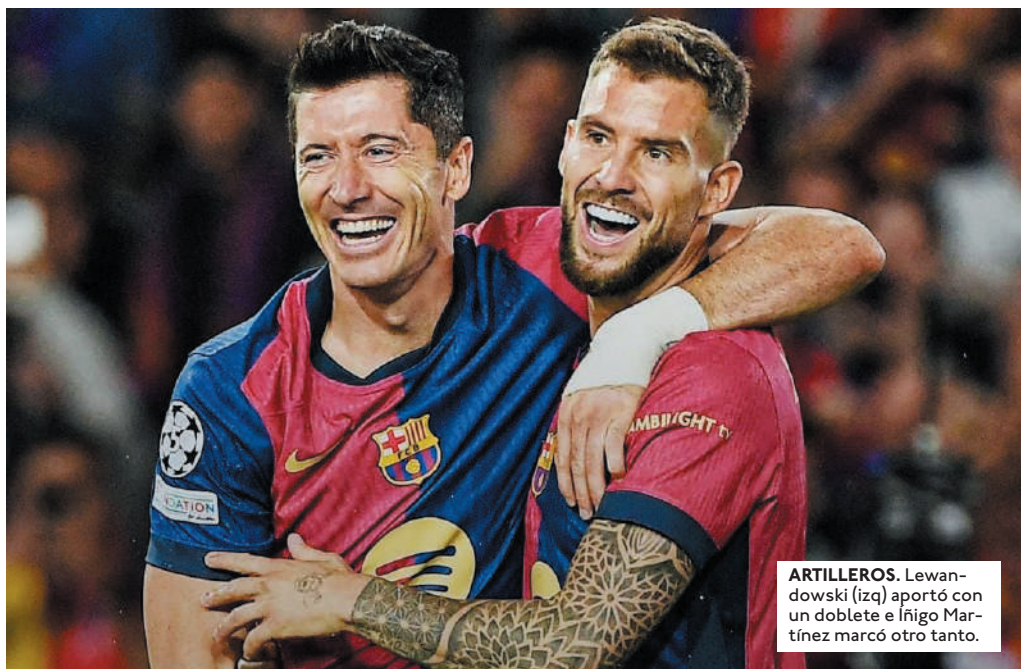
ARTILLEROS. Lewandowski (izq) aportó con un doblete e Iñigo Martínez marcó otro tanto.

EL INTER GOLEÓ A ESTRELLA ROJA POR 4-0, EL DORTMUND APLASTÓ AL CELTIC POR 7-1, MANCHESTER CITY DERROTÓ A SLOVAN BRATISLAVA POR 0-4 Y LEVERKUSEN VENCió 1-0 AL MILAN.