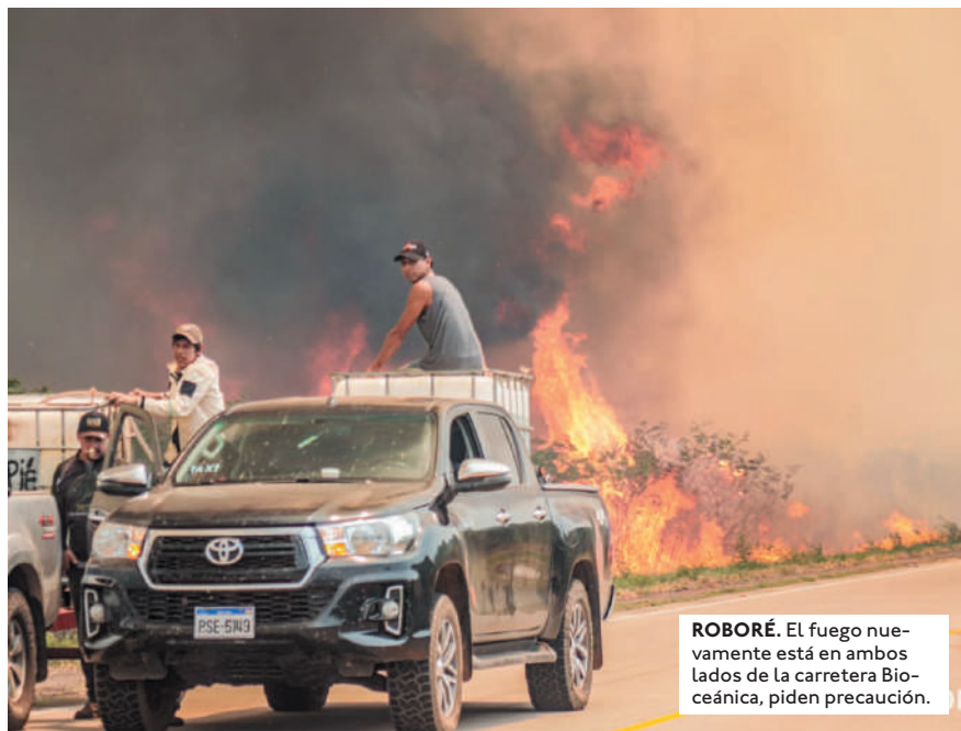
ROBORÉ. El fuego nuevamente está en ambos lados de la carretera Bioceánica, piden precaución.