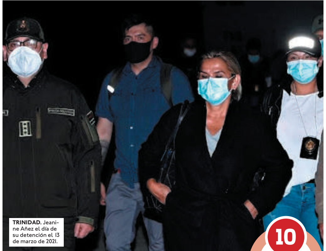
TRINIDAD. Jeanine Añez el día de su detención el 13 de marzo de 2021.

¿Qué procede? "Corresponde anular todos los juicios contra la Sra. Añez tal como están planteados e iniciar una investigación profunda a Morales, Lima y los jueces obseciones que se prestaron a esta infamia", añadió Mesa. El lunes también se pronunció el político y empresario Samuel Doria Medina, quien cuestionó porque no se pone fin al teatro, como calificó los procesos contra Añez. "Si el propio ex ministro de Justicia señala que el enjuiciamiento de Jeanine Añez por vía ordinaria no tiene pies ni cabeza y es un capricho del enemigo político de Añez, entonces ¿por qué sigue este teatro?", señaló. Además pidió al Órgano Judicial dejar de torturar a Añez. Enfatizó que la exmandataria debe ser procesada en un juicio de responsabilidades en el parlamento.