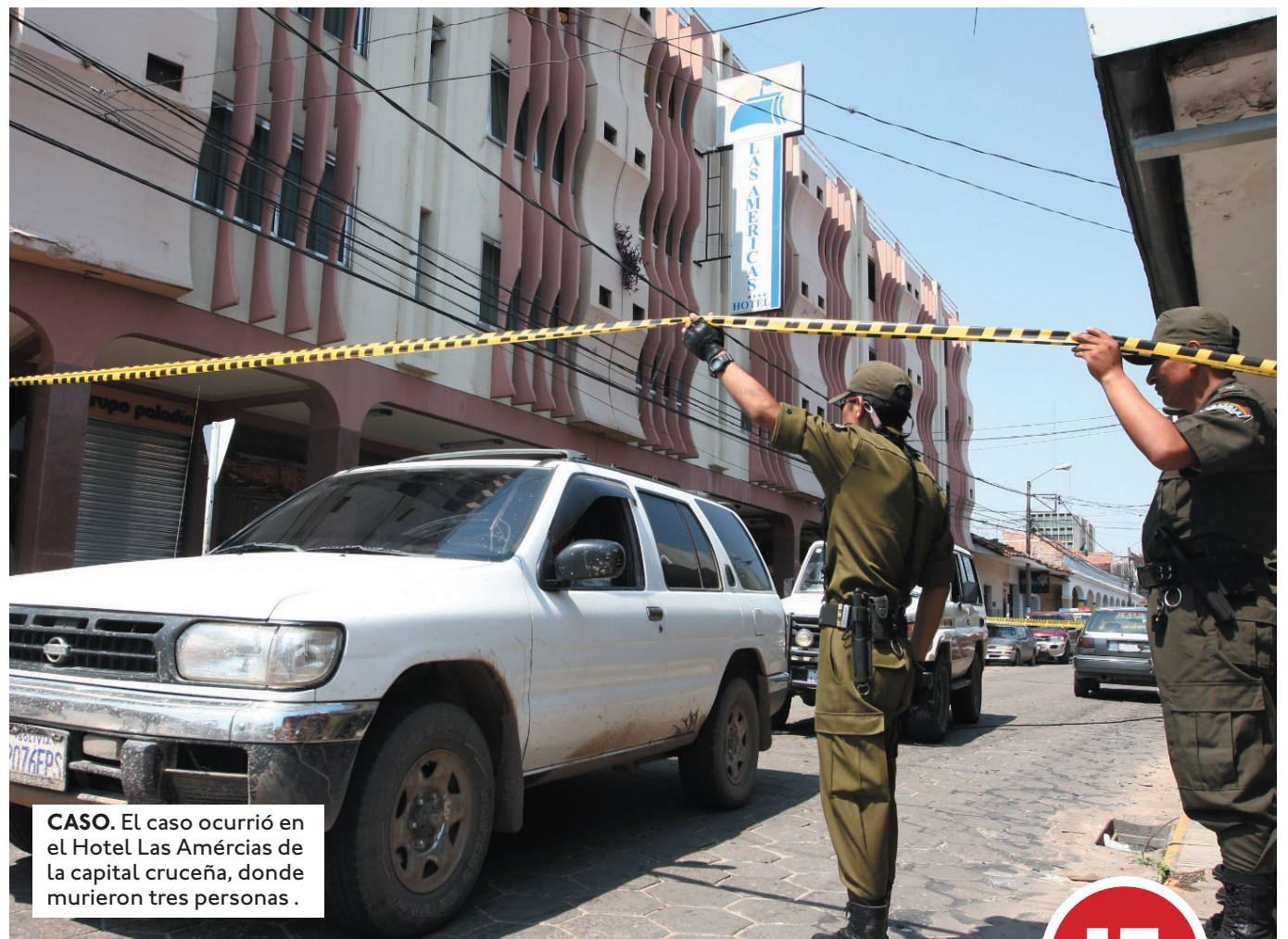
CASO. El caso ocurrió en el Hotel Las Américas de la capital cruceña, donde murieron tres personas.

Recomendaciones. La CIDH recomendó al Estado boliviano