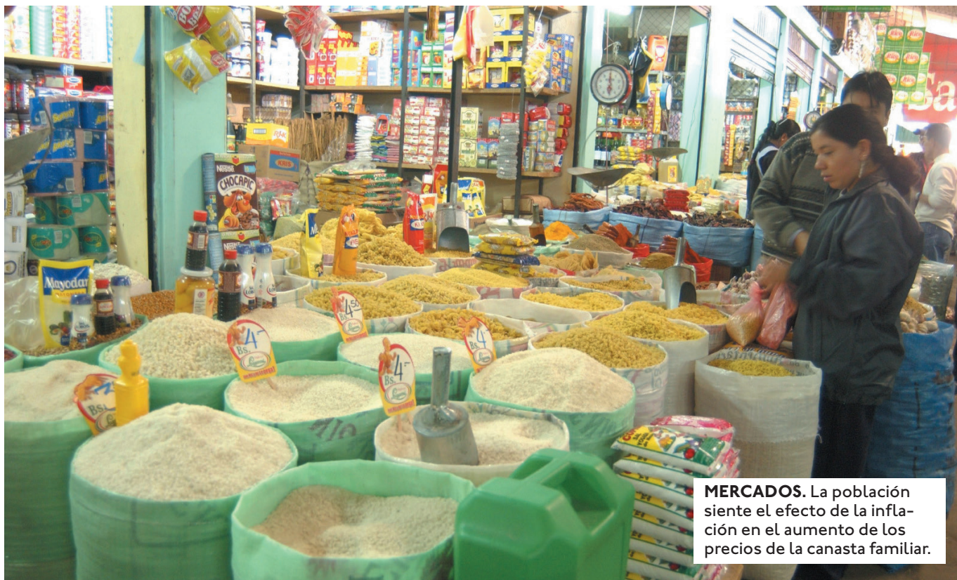
MERCADOS. La población siente el efecto de la inflación en el aumento de los precios de la canasta familiar.

LA SITUACIÓN ECONÓMICA SE COMPLICA AÚN MÁS POR EL DETERIORO DEL COMERCIO EXTERIOR, LA ESCASEZ DE DÓLARES Y EL AUMENTO EN EL COSTO DE LOS COMBUSTIBLES.