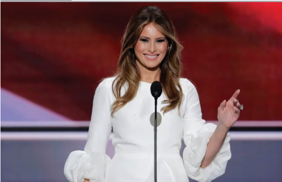
MELANIA TRUMP REVELA APOYO AL ABORTO ANTES DE PUBLICACIÓN DE SU AUTOBIOGRAFÍA. La ex primera dama de EEUU, defendió el derecho al aborto, algo en lo que difiere con su esposo, el candidato republicano Donald Trump, y con gran parte de la base de su partido.