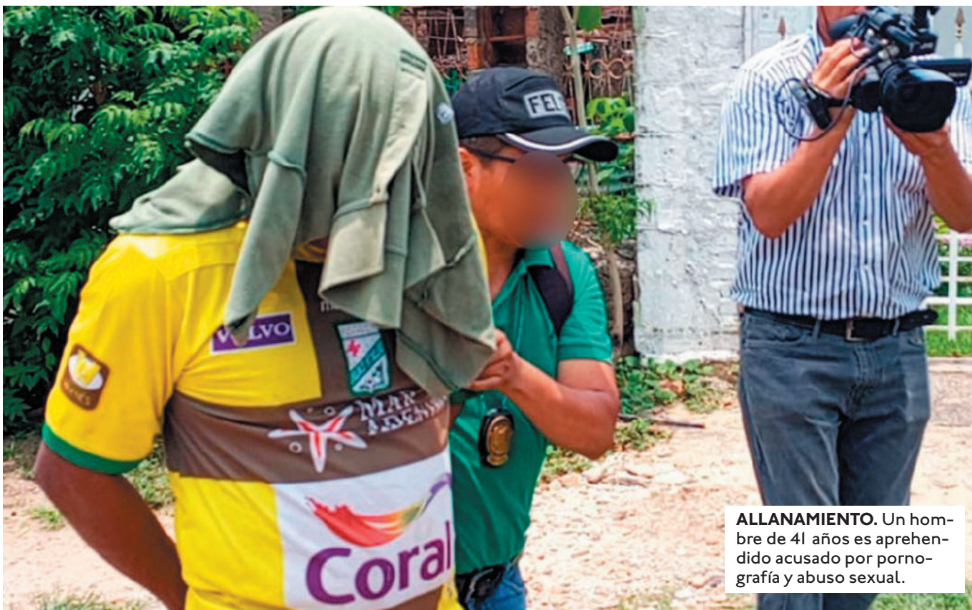
ALLANAMIENTO. Un hombre de 41 años es aprehendido acusado por pornografía y abuso sexual.

SEGÚN INFORMACIÓN POLICIAL, LA MENOR DE 13 AÑOS FUE ABUSADA SEUALMENTE POR SU PADRASTRO. OTROS TRES FUERON RESCATADOS.