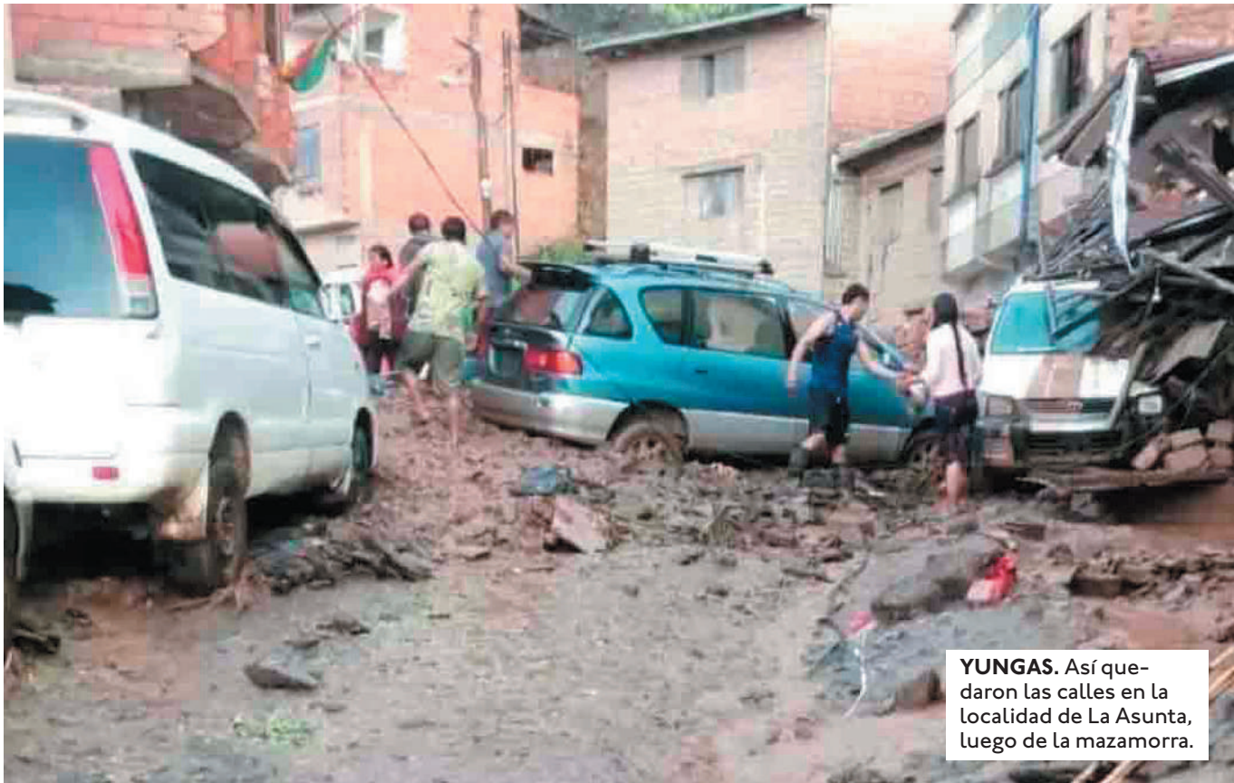
YUNGAS. Así quedaron las calles en la localidad de La Asunta, luego de la mazamorra.

LA LLUVIA CAÍDA EL DOMINGO ANEGÓ VARIAS ÁREAS DEL HOSPITAL DE TARIJA. SE TEME DAÑOS EN EQUIPOS DE TOMOGRAFÍA Y RAYOS X.