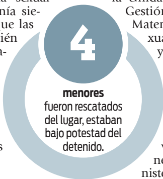
4 menores fueron rescatados del lugar, estaban bajo potestad del detenido.

constatar la existencia de imágenes y contenidos de abuso sexual cometidos en contra de menores de edad, por ello, se solicitó los allanamientos que han dado resultados favorables para la investigación”, dijo Zeballos. “La víctima habría sido agredida desde que tenía siete años, actualmente ya fue rescatada junto a sus dos hermanas quienes recibirán atención psicológica y valoración médico forense”, explicó Zeballos. El hombre fue trasladado a celdas policiales y en las próximas horas se presentará la imputación formal en su contra por los delitos de Abuso Sexual y Pornografía.