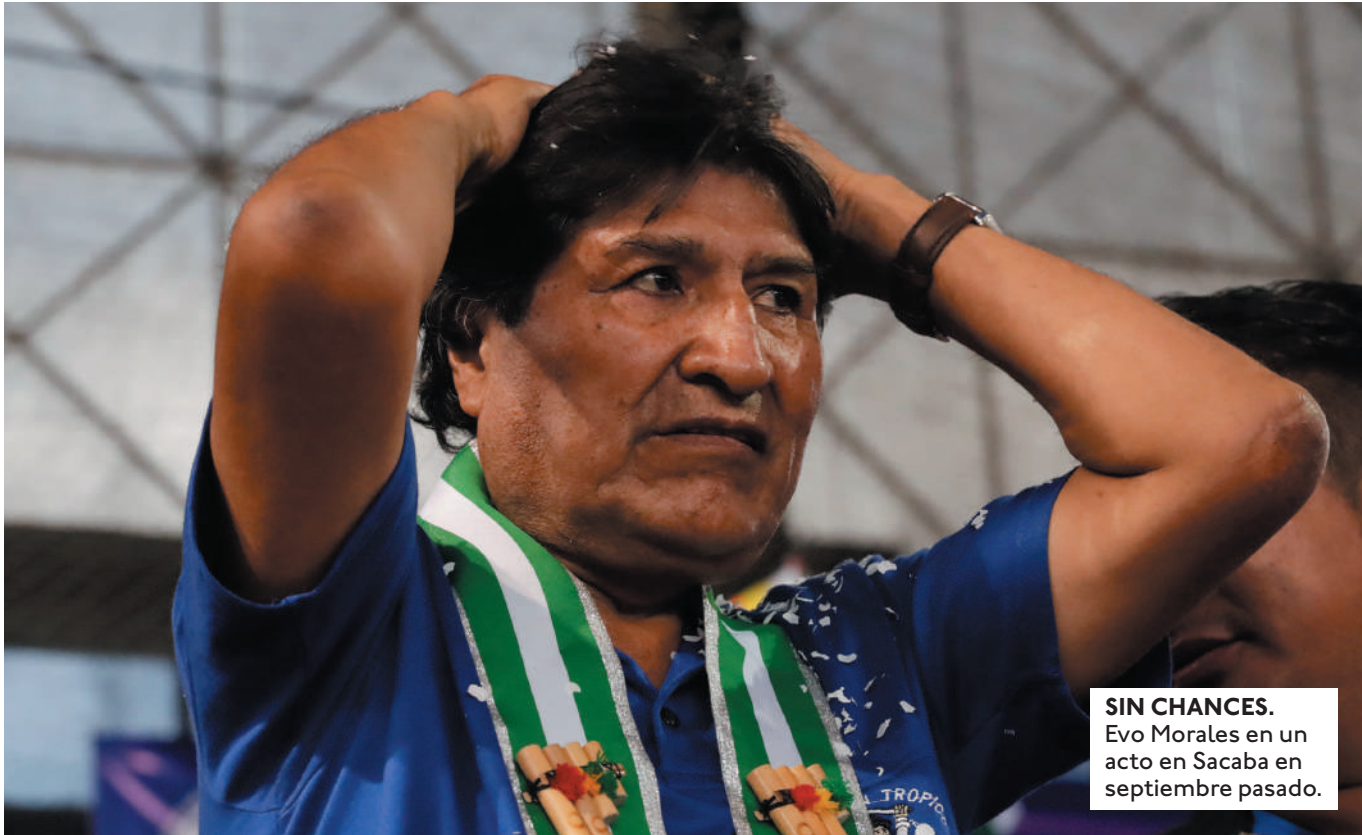
SIN CHANCES. Evo Morales en un acto en Sacaba en septiembre pasado.

EL ALA RADICAL MANTIENE EL CONTROL DEL MAS Y ANALISTAS YA VEN A ANDRÓNICO RODRÍGUEZ COMO POTABLE CANDIDATO EL 2025.