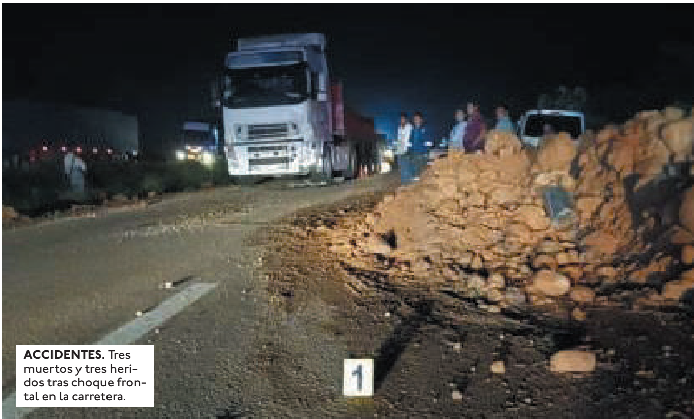
ACCIDENTES. Tres muertos y tres heridos tras choque frontal en la carretera.

POBLADORES DE YAPACANÍ PIDEN A LAS AUTORIDADES LIMPIAR LAS CARRETERAS, YA QUE EL BLOQUEO DEJÓ PIEDRAS Y PROMONTORIOS DE TIERRA EN LA VÍA.