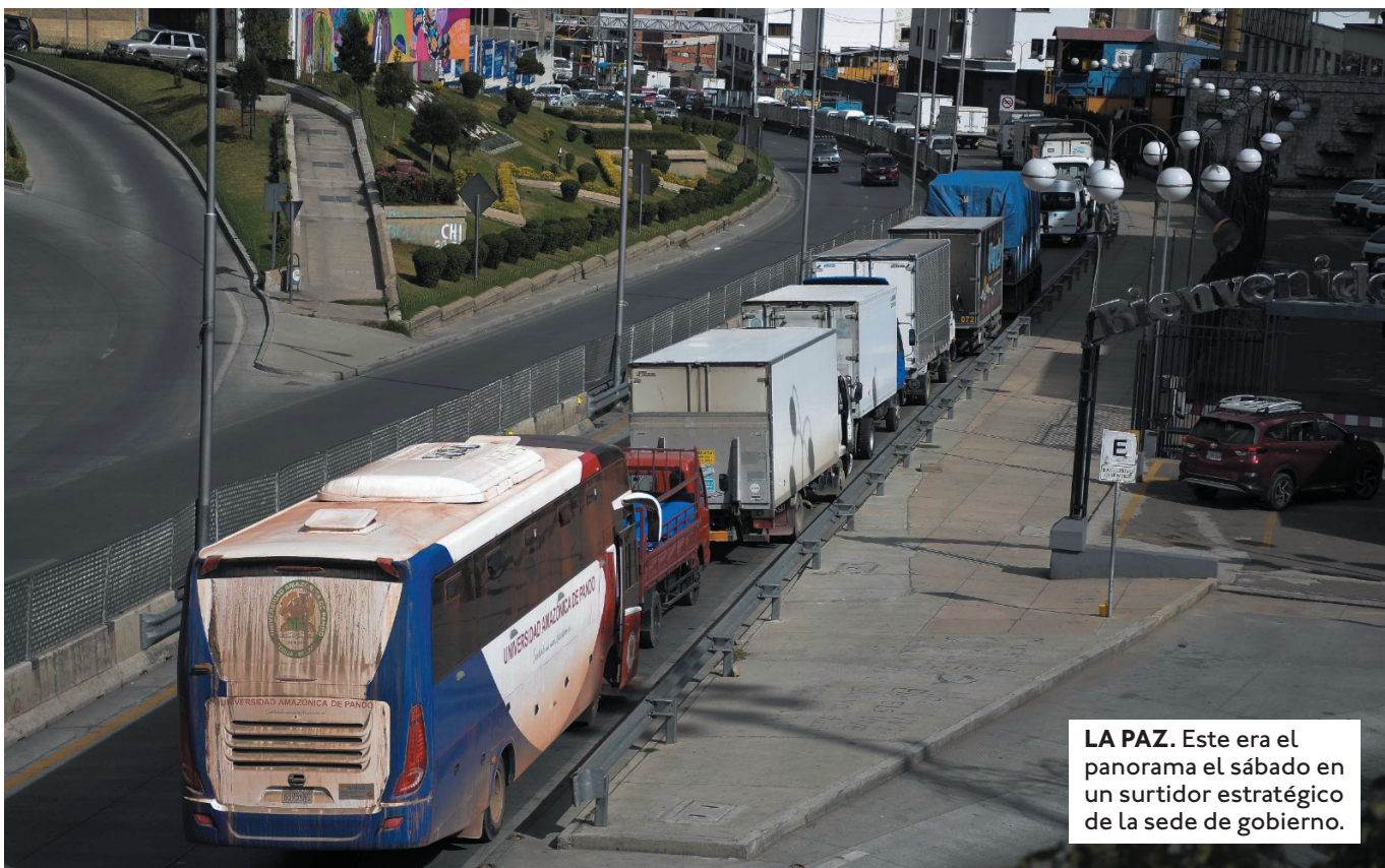
LA PAZ. Este era el panorama el sábado en un surtidor estratégico de la sede de gobierno.

EL EXPRESIDENTE PROPUSO LEVANTAR GRADUALMENTE LA SUBVENCIÓN DE COMBUSTIBLE. AÑADIÓ QUE EL SUBSIDIO DE $US 4.000 MILLONES ES INSOSTENIBLE.