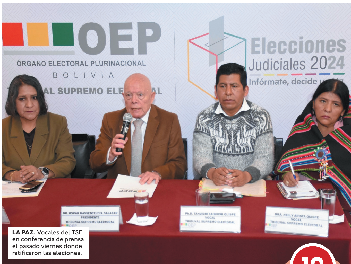
LA PAZ. Vocales del TSE en conferencia de prensa el pasado viernes donde ratificaron las elecciones.

“Esta ley corta sería una herramienta fundamental, porque nos estaría protegiendo, nos estaría blindando como Órgano Electoral. Desde 2010 hemos enfrentado múltiples ataques a la institucionalidad, como la exclusión de los vocales de la Ley 044, que regu-