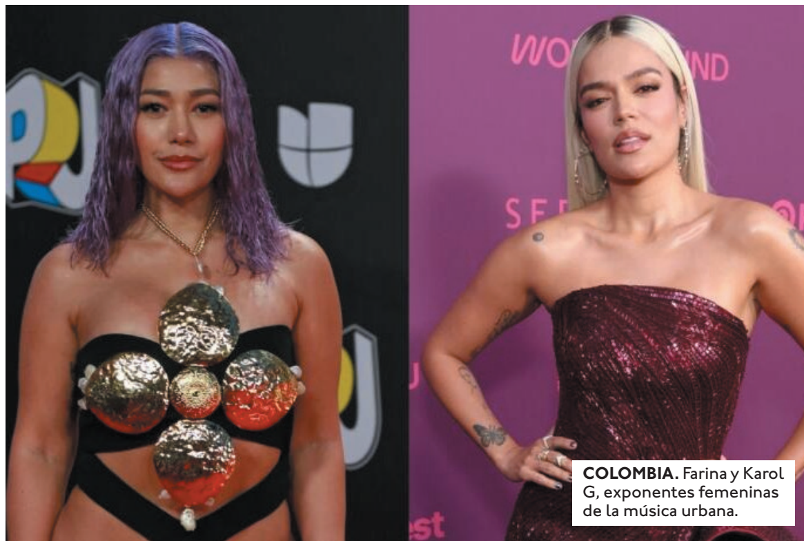
COLOMBIA. Farina y Karol G, exponentes femeninas de la música urbana.

A partir de ese pensamiento hubo cientos de preguntas y comenta-