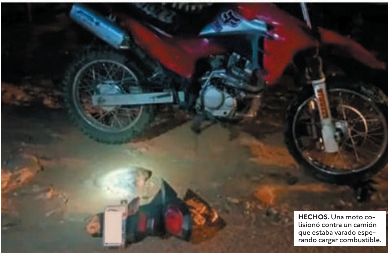
HECHOS. Una moto colisionó contra un camión que estaba varado esperando cargar combustible.

TRAS LOS HECHOS DE TRÁNSITO, AMBOS CONDUCTORES DE VEHÍCULOS VARADOS FUERON ARRESTADOS CON FINES INVESTIGATIVOS.