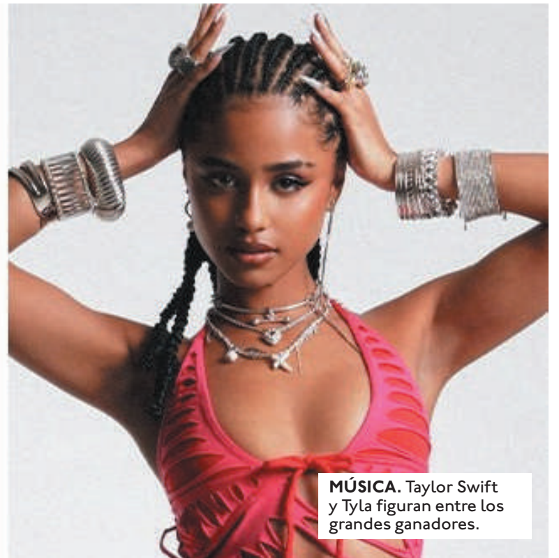
MÚSICA. Taylor Swift y Tyla figuran entre los grandes ganadores.