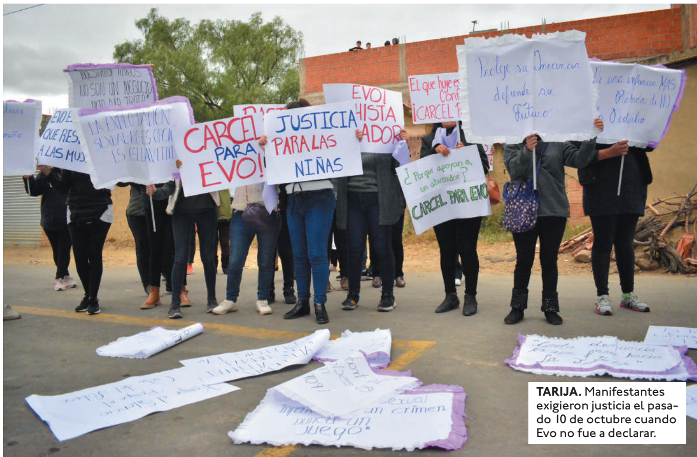
TARIJA. Manifestantes exigieron justicia el pasado 10 de octubre cuando Evo no fue a declarar.