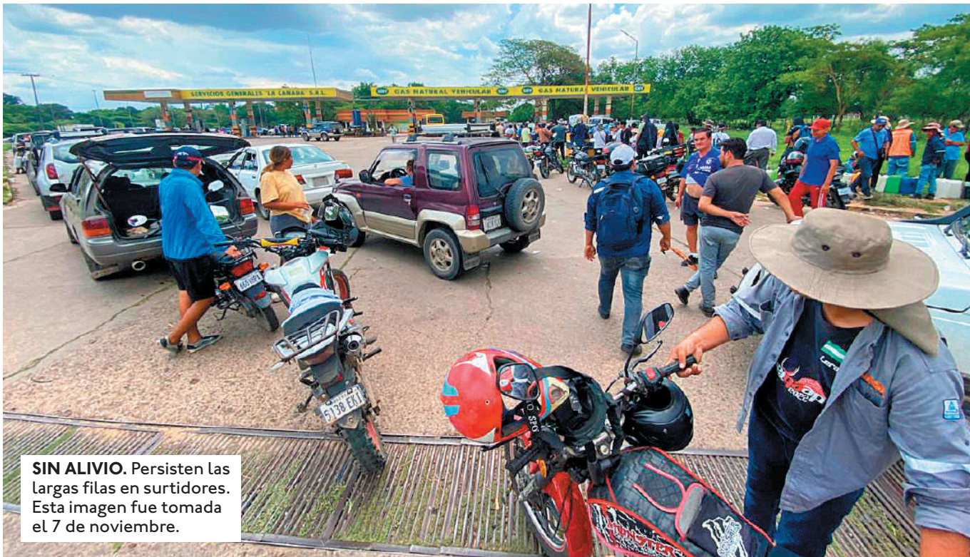
SIN ALIVIO. Persisten las largas filas en surtidores. Esta imagen fue tomada el 7 de noviembre.

EL TEMA DE LOS COMBUSTIBLES SERÁ UNO DE LOS PUNTOS A TRATAR EN EL AMPLIADO DE SANTA CRUZ. TAMBIÉN ABORDARÁN EL ALZA DE PASAJES.