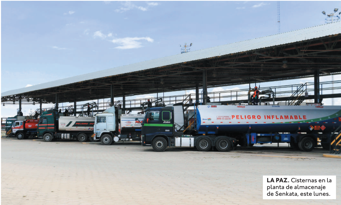
LA PAZ. Cisternas en la planta de almacenaje de Senkata, este lunes.

EL EXPRESIDENTE EVO MORALES INSISTIÓ EN QUITAR GRADUALMENTE EL SUBSIDIO, PERO SEÑALÓ QUE LA DECISIÓN DEBE TOMARSE CON EL PUEBLO.