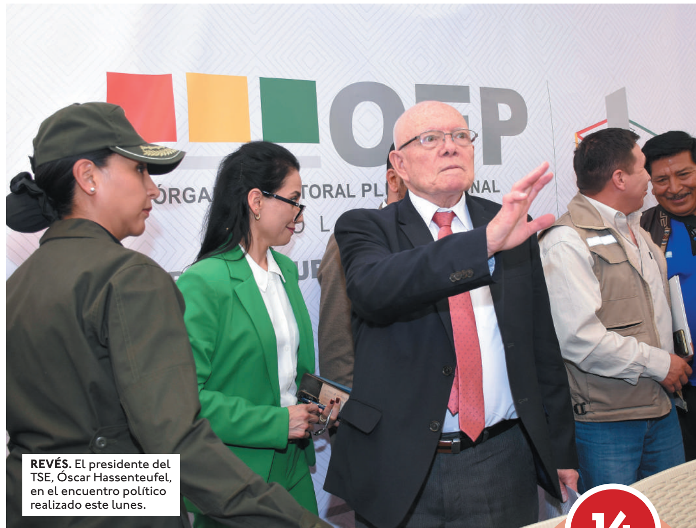
REVÉS. El presidente del TSE, Óscar Hassenteufel, en el encuentro político realizado este lunes.

No le quedó opción. El TSE señala que pese a la voluntad expresada en el encuentro político, realizado el lunes, la Asamblea Legislativa Plurinacional (ALP) no emitió un pronunciamiento de rechazo a la Sentencia 0770/2024, ni tampoco se aprobó una ley para proteger a los vocales del TSE de pro-