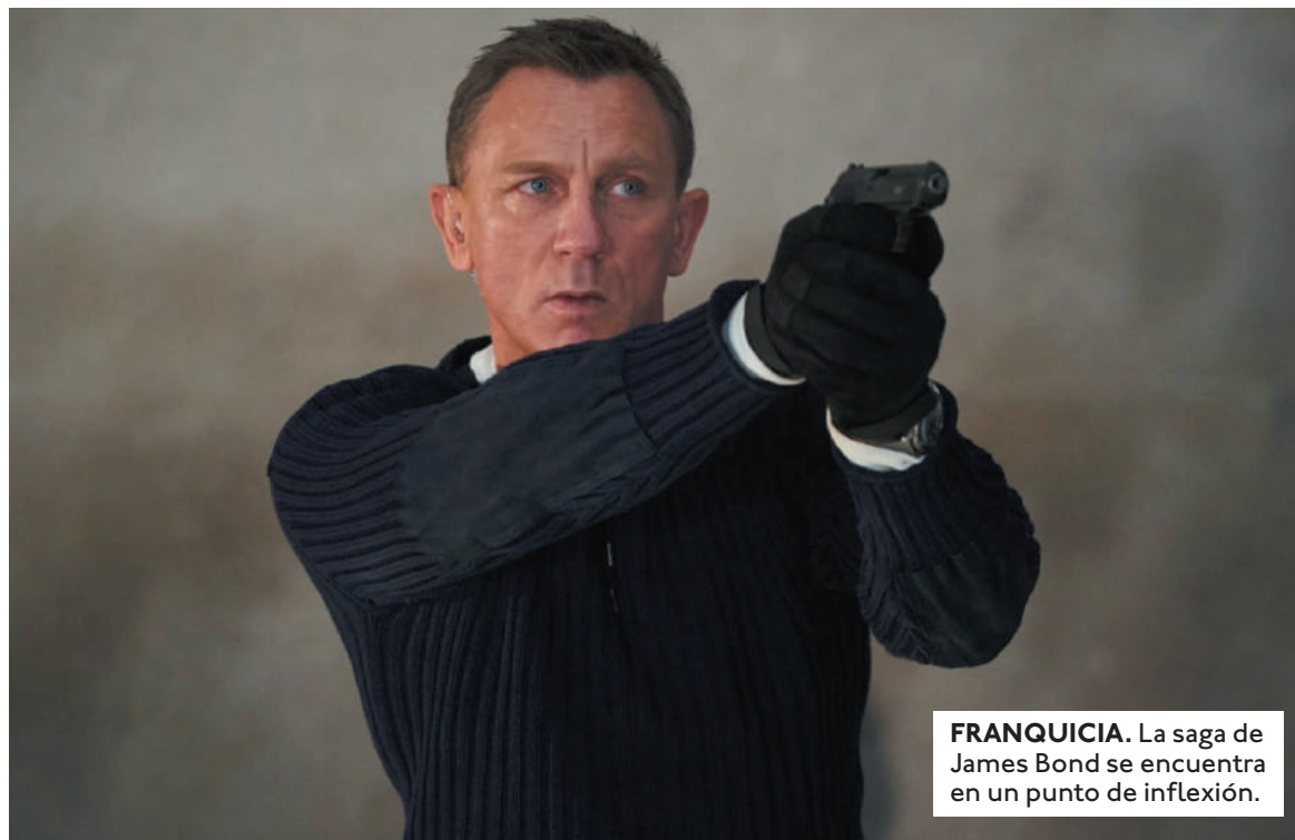
FRANQUICIA. La saga de James Bond se encuentra en un punto de inflexión.

Los posibles candidatos. Desde que Daniel Craig soltó la bomba en 2021, diciendo que preferiría "cortarse las venas antes de volver a ser James Bond", el mundo del cine ha estado en un frenesí de especulaciones sobre quién tomará el relevo. Los rumores no dejan de dar vueltas, y el nombre que más suena es el de Aaron Taylor-Johnson, el británico que se hizo famoso por Kick-Ass y Tren Bala. Según The Sun, ya se ha reunido con los productores, y lo que parecía un sueño de Hollywood podría estar mucho más