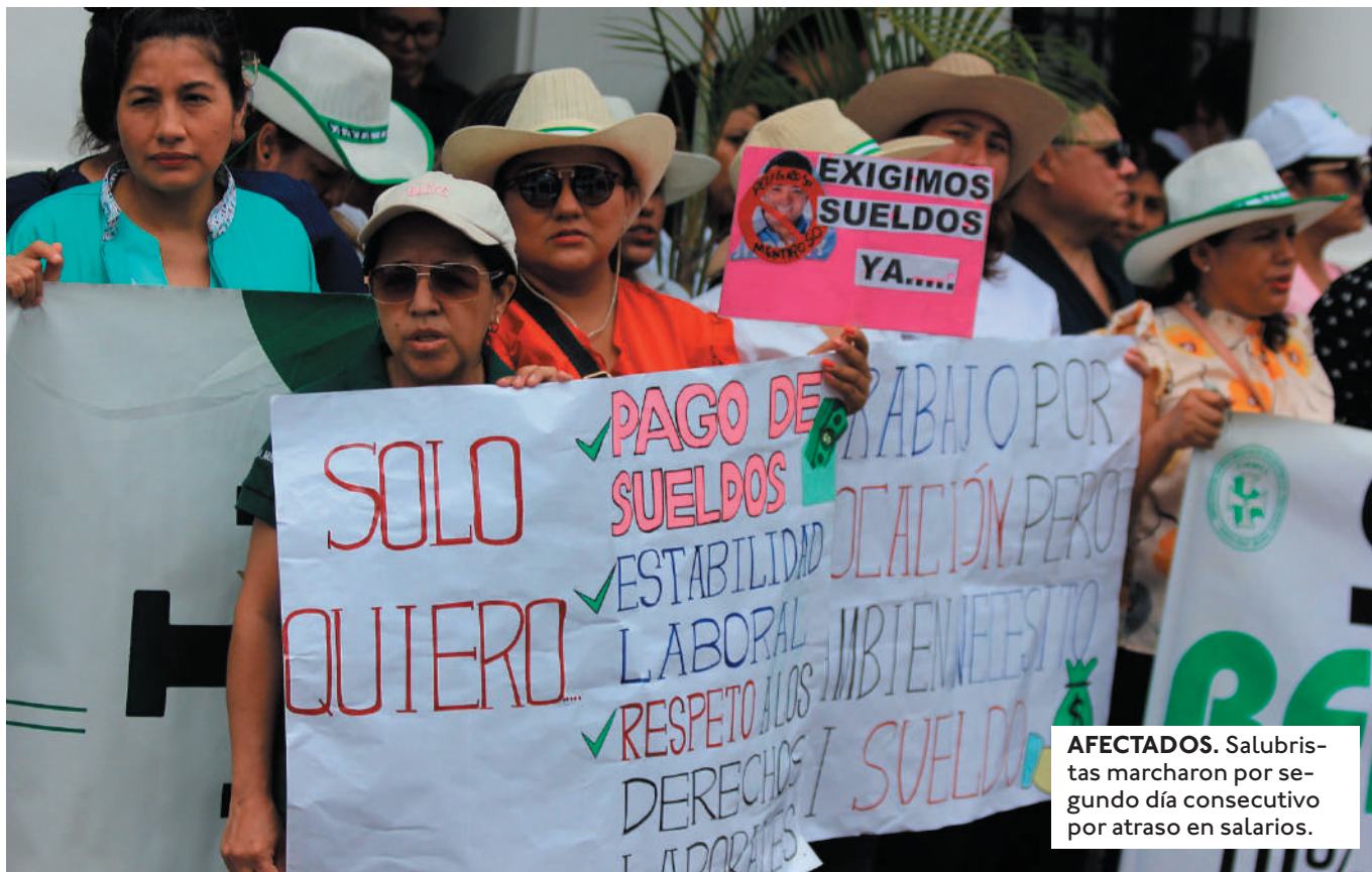
AFECTADOS. Salubristas marcharon por segundo día consecutivo por atraso en salarios.

LA INSTITUCIÓN ENFRENTA DIFICULTADES TRAS ACUMULAR UNA DEUDA DE BS 550.000 POR PROYECTOS CULTURALES YA EJECUTADOS.