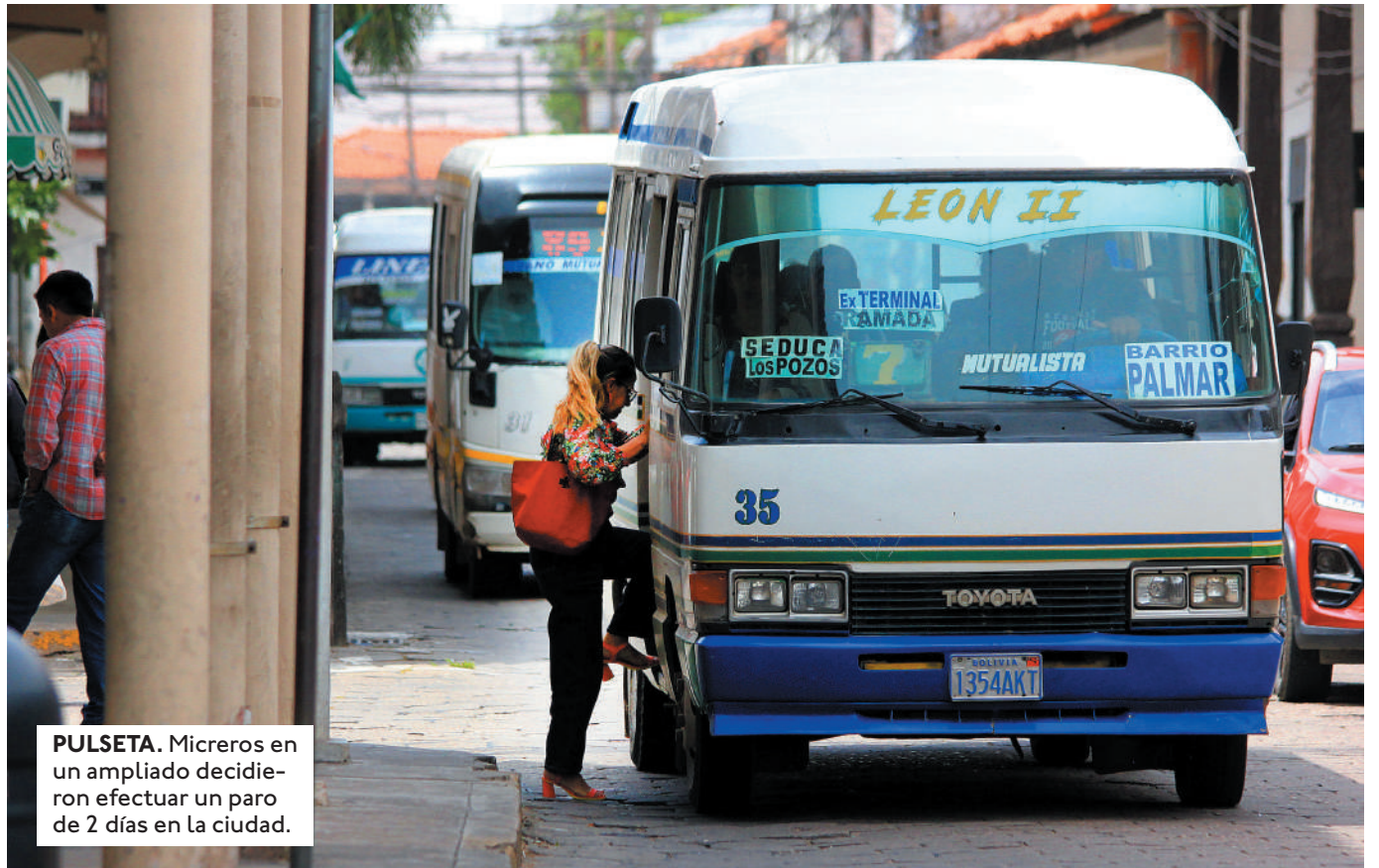
PULSETA. Micreros en un ampliado decidieron efectuar un paro de 2 días en la ciudad.