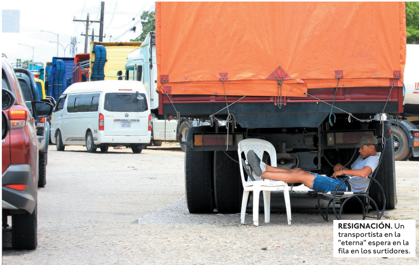
RESIGNACIÓN. Un transportista en la "eterna" espera en la fila en los surtidores.

PRODUCTORES DE ESTE MUNICIPIO DEL NORTE INSTALARON UNA VIGILIA EN UN POZO PETROLERO DE LA ZONA Y ADVIERTEN CON CIERRE DE VÁLVULAS PARA EXIGIR SOLUCIÓN A LA ESCASEZ DE COMBUSTIBLES.