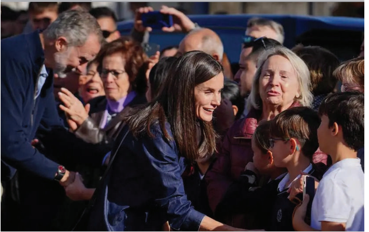
ESPAÑA. Los reyes de España regresaron este martes (19.11.2024) a las zonas devastadas por las inundaciones, donde fueron recibidos con aplausos, a diferencia de una caótica primera visita hace dos semanas cuando la comitiva en la que iban recibió insultos y bolas de barro.