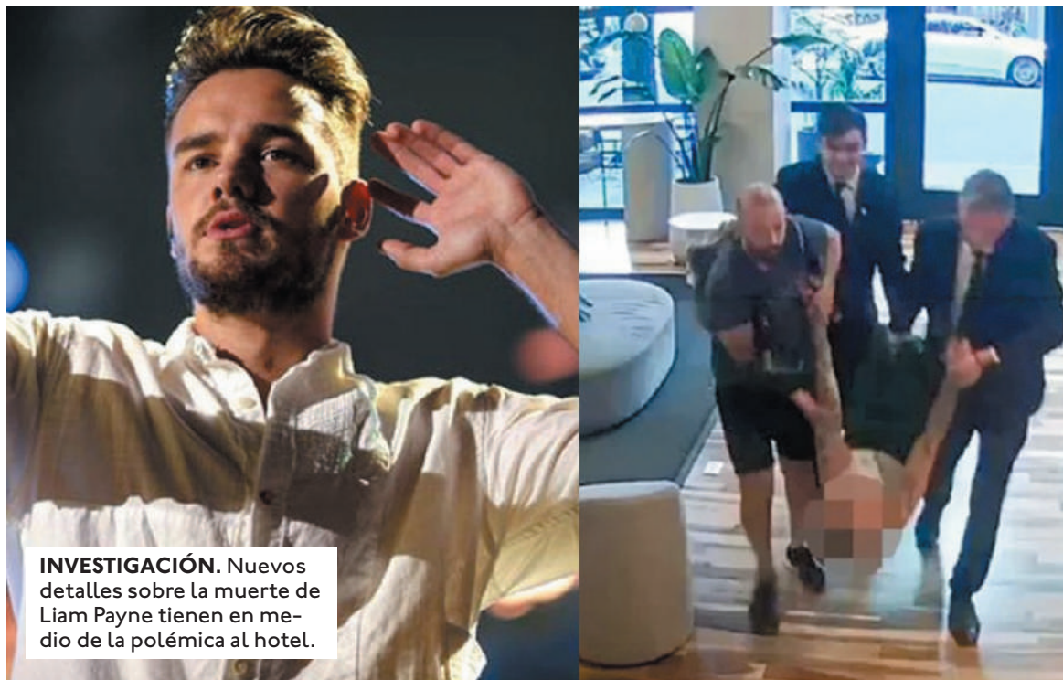
INVESTIGACIÓN. Nuevos detalles sobre la muerte de Liam Payne tienen en medio de la polémica al hotel.

En los reportes policiales se detalla que cuando los empleados del hotel llevaron a Liam a su habitación, él forcejeó con ellos porque claramente no quería entrar. Sin embargo, el hotel utilizó una llave maestra para abrir el cuarto y meterlo contra su voluntad. Además, quitaron un espejo de la pared justo afuera de su habitación, presumiblemente, para que no lo dañara. Liam les dijo a los empleados que no quería estar en la habitación y que usaría el balcón para escapar, esto se dedujo porque uno de los empleados llamó