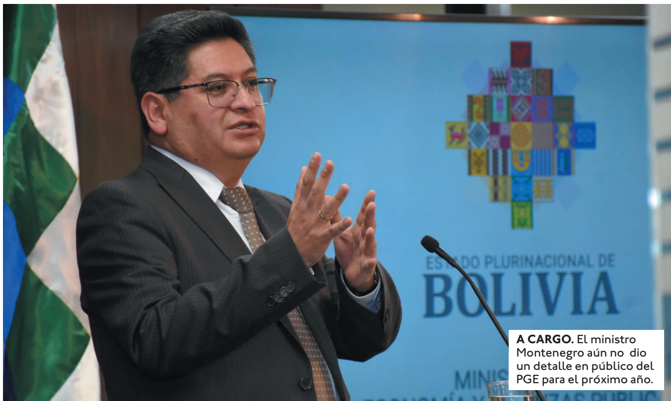
A CARGO. El ministro Montenegro aún no dio un detalle en público del PGE para el próximo año.

EL ECONOMISTA GONZALO CHÁVEZ LAMENTÓ QUE EL PRESUPUESTO MUESTRE CIFRAS COMO SI EN BOLIVIA NO PASARA NADA.