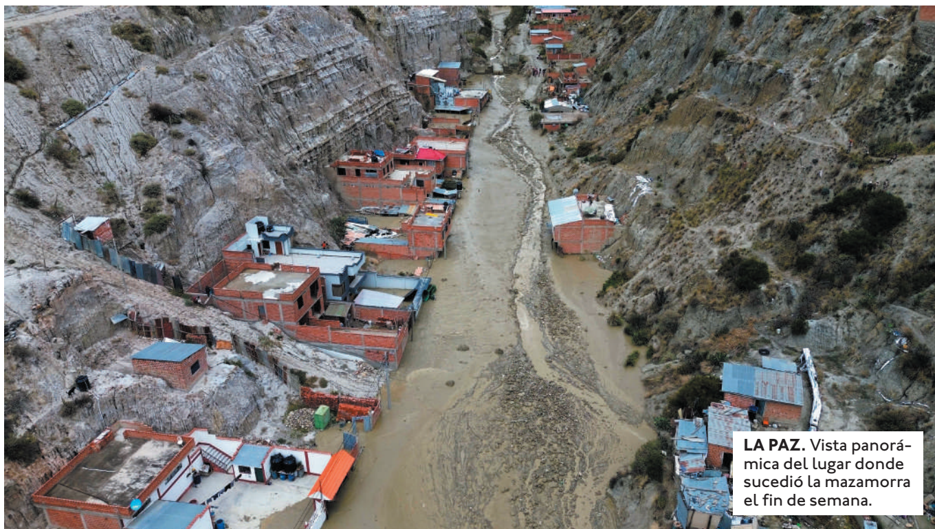
LA PAZ. Vista panorámica del lugar donde sucedió la mazamorra el fin de semana.

LOS ALCALDES DE LA PAZ Y ACHOCALLA DIERON A LA INMOBILIARIA UN PLAZO DE 24 HORAS PARA PRESENTAR Y EJECUTAR UN PLAN DE CONTINGENCIA DESTINADO A PREVENIR DESASTRES MAYORES.