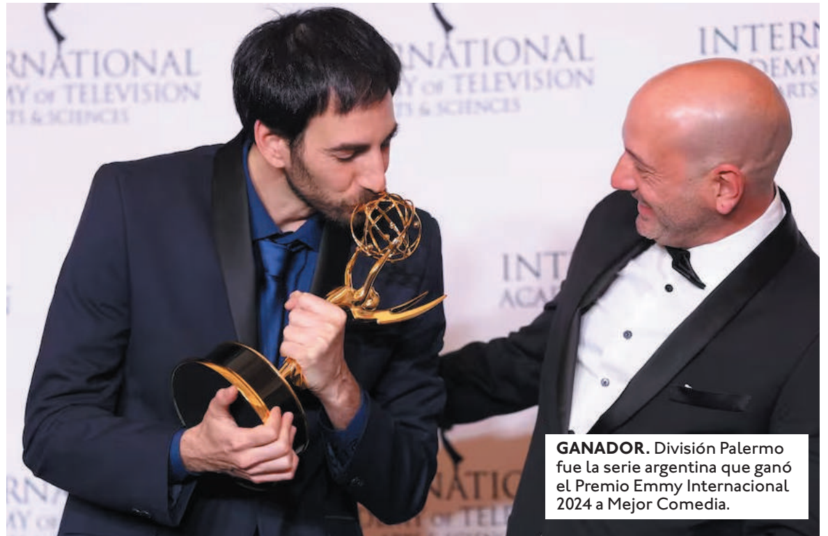
GANADOR. División Palermo fue la serie argentina que ganó el Premio Emmy Internacional 2024 a Mejor Comedia.